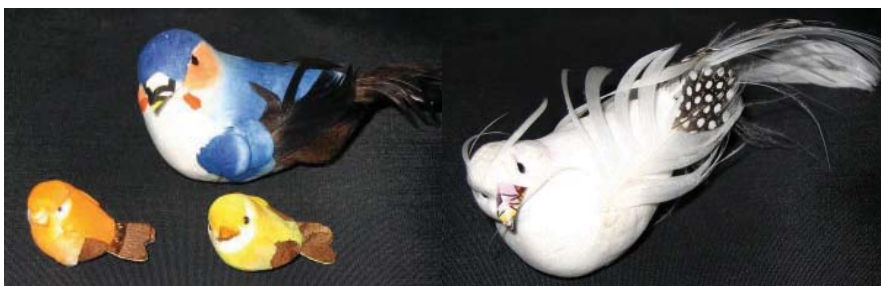
图：黑嘴子劳教所奴役产品