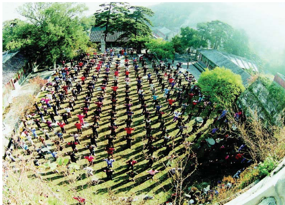
图：一九九六年北京国际法会的各国法轮功学员在戒台寺晨炼

一九九二年五月由李洪志先生传出的佛家上乘修炼大法，以宇宙最高特性“真善忍”为根本指导，按照宇宙的演化原理而修炼。修炼者遵循“真、善、忍”的法理，注重心性的修炼，凡事先他后我；五套功法简单易学，祛病健身功效卓著。经亿万人的修炼实践证明，法轮大法在把真正修炼的人带到高层次的同时，对稳定社会、提高人们的身体素