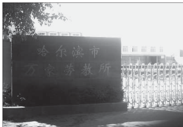
图：臭名昭著的万家劳教所

中共的劳动教养制度的罪恶不仅仅局限于对民众的迫害，使中华大地冤狱丛生，这一制度的罪恶还在于它将法律的尊严践踏殆尽；使法度尽废；使许许多多公安警察、狱警执法犯法，将良心出卖换取眼前利益。这一罪恶必须停止也必将被清算。