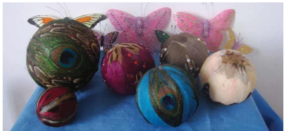
图：明慧网二零一二年六月四日报导“吉林省女子劳教所的奴工产品”。这种装饰性小球、蝴蝶，据说拿到上海世博会参展

奴工生产仍在继续，商品源源不断的流向世界各地，这不仅违反世界贸易规则，更使这场对法轮功修炼者的迫害渗透到社会各个领域。