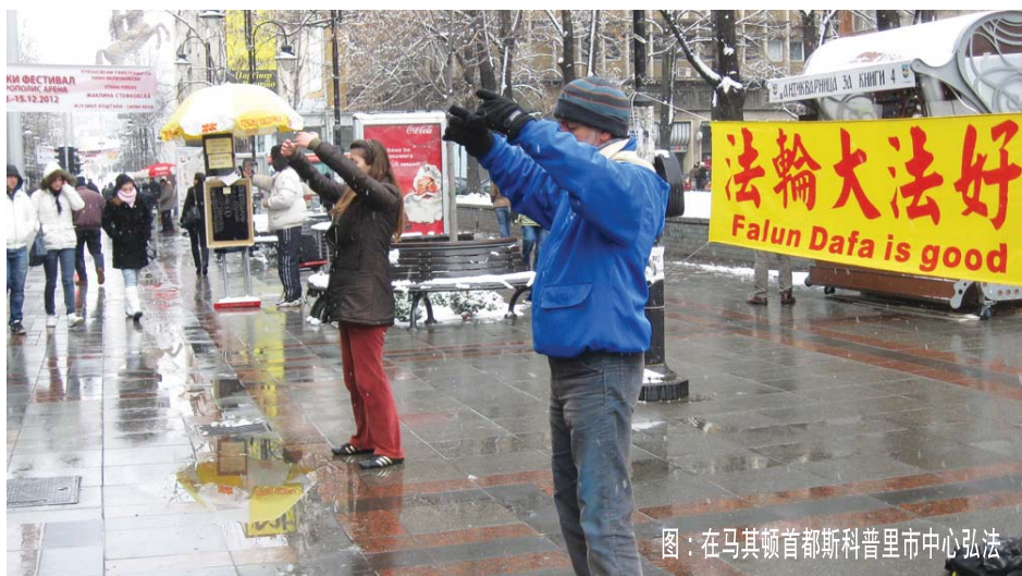
图：在马其顿首都斯科普里市中心弘法

在马其顿首都斯科普里市中心步行街，法轮功学员演示功法，散发真相传单。不少当地人接了真相传单后迟迟不愿离去，在一旁静静地看功法演示。学员们走访了马其顿文化部。办公室主任和几位同僚们认真听了法轮功在世界弘传的盛况和中共迫害法轮功的真相。他们对中共的恶行十分震惊，并表示要把学员们留下的真相传单交送领导办公室和其他各办公室。