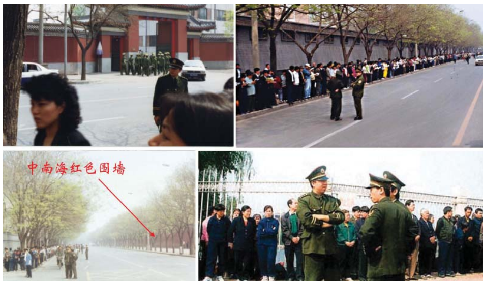
图：一九九九年四月二十五日，逾万名法轮功学员和平上访，学员们静静地路边看书、等待。从当时的中央电视台新闻画面和现场照片都可以看到，上访群众的身后，并不是中南海特有的红色围墙，而上访群众隔街相望的才是。在央视播出的现场录像中，没有出现示威中常见的情绪激动的人群，没有标语，也没有口号。中共所谓“围攻中南海”谎言不攻自破。

“4·25”和平上访得到了海外媒体的高度评价，被称作“中国上访史上规模最大、最理性平和的上访”。而江泽民却强行推翻总理的开明决定，把和平上访污蔑为“围攻中南海”，并于同年7月开始全面迫害法轮功。