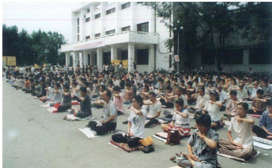
图：98年8月份哈尔滨法轮功学员集体炼功

在未确诊前，已经被误诊为多发硬化症，此病在世界上是无法治疗的，只能维持几年，等待死亡。这种近似死亡的噩耗重重地压在我的心头三个月。确诊为脑瘤后。自己真的感到了死亡向我袭来，生命的进程已经进入倒计时，此时此刻我绝望了。我抱着生的一线希望，怀着极其悲