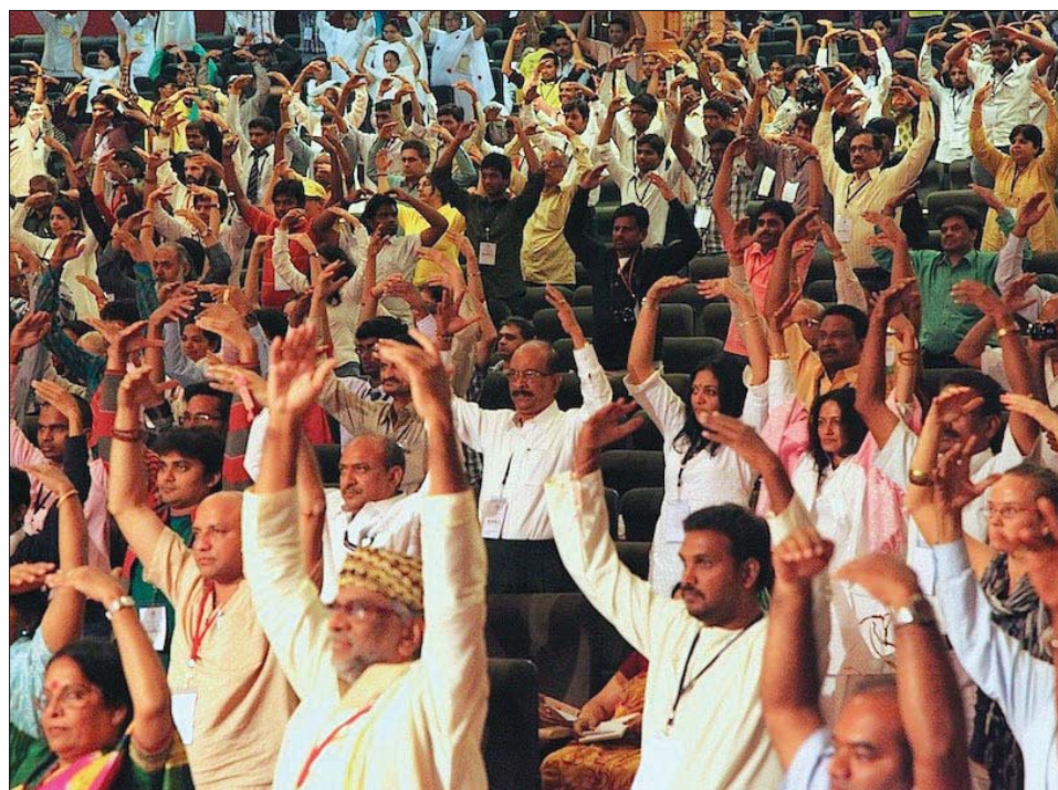
图：参与精神领袖会议中的贵宾集体学炼法轮功。

与会的印度精神领袖们首次听闻充满祥和正气的乐音，都非常赞赏，也当场学炼起法轮功法。有一位九十多岁的印度长老领袖，在听了天国乐团的演奏后表示：“从来没见过、听过这么美好的乐团，很想在有生之年再听一次演奏。”他邀请乐团到他居住的园区内演奏，还赠送小点心给团员们表达感谢，并学着用中文说“法轮大法好”，现场所有人也学着说中文“法轮大法好”。