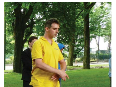
图：比利时法轮功学员约翰中使馆前炼功，抗议中共迫害

一九九九年七月二十日，中共在大陆发动了一场对法轮功和广大法轮功学员的全面迫害。从那时起，中国官方媒体长期对法轮功进行造谣、魔化和仇