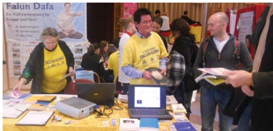
图：在曼海姆展览会上介绍法轮功

通过此次脱口秀节目，一些民众因中共谎言宣传而对法轮大法产生的误解经由法轮功学员的解释都一一澄清了。