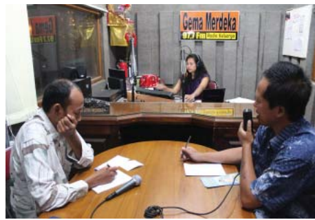
图：印尼巴厘岛自由回声电台邀请法轮功学员做脱口秀节目

法轮功学员还讲述了以“假恶暴”维持统治的中共不能容忍亿万民众对“真、善、忍”的信仰，自一九九九年发动了对法