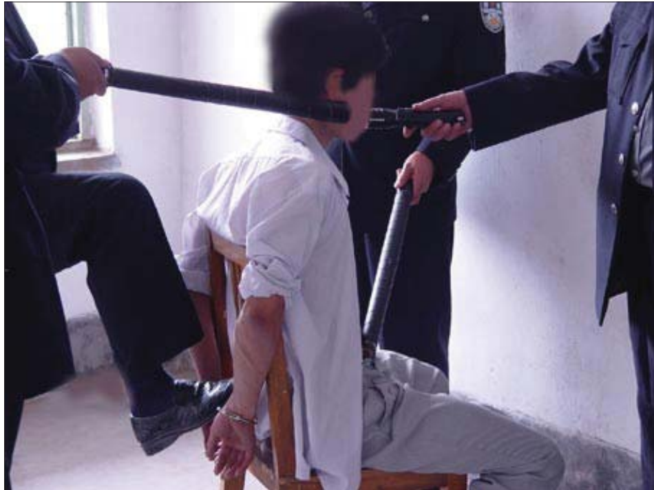
图：山东王村劳教所酷刑图示——将法轮功学员铐在椅子上，多名警察用电棍电。

中国劳教所迫害政治犯良心犯的手段可谓无奇不有，包括超强度的奴工劳动，剥夺睡眠，五花八门的酷刑，药物摧残，令人发指的性侵害（包括对男性劳教人员），披着科学外衣的所谓“心理咨询”，还有惨绝人寰的活摘人体器官。在这些手段的摧残下，被非法劳教者轻则心身受伤，重则被折磨得不成人样，精神失常，甚至失去生命。