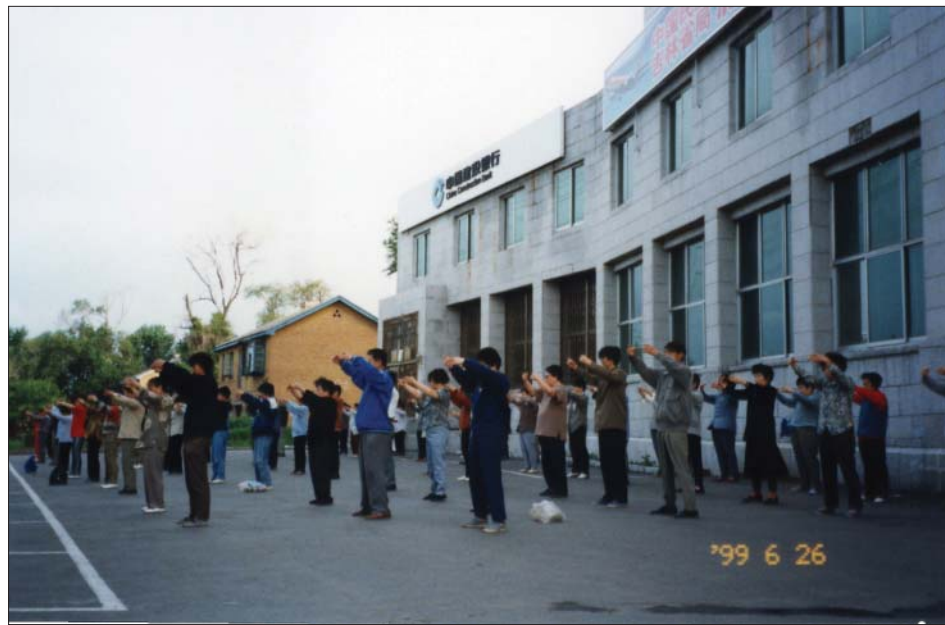
图：一九九九年大陆法轮功学员炼第二套功法 -- 法轮桩法

二零零五年，一个偶然的机，接触到了法轮功。虽然我知道法轮功是被中共禁止的，但听说这个功法祛病健身有奇效，我就决定要炼，管它禁止不禁止呢！我的身体有病，很痛苦，谁