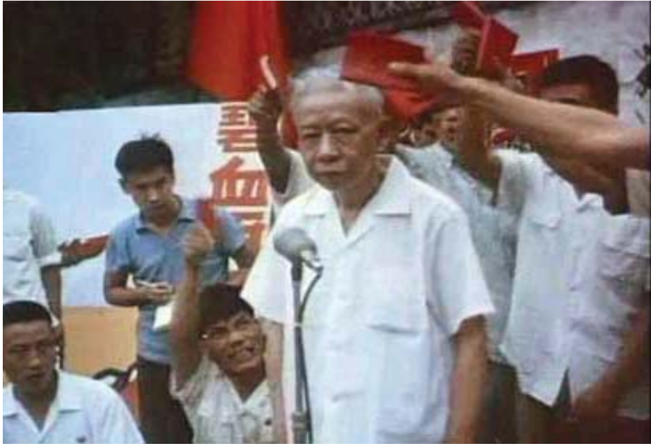
图：文革中红卫兵批斗刘少奇