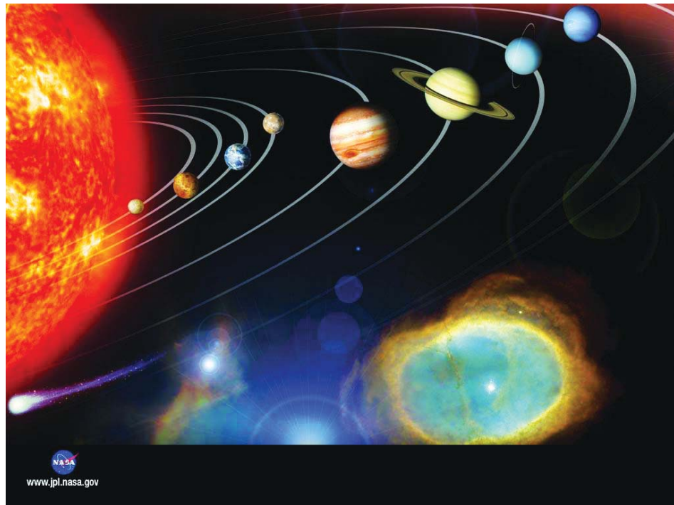
图：牛顿反问道：真正的太阳系原型比模型不知精巧多少倍，难道竟然无须造物主造就，通过无数个偶然叠加就能产生？

合乎逻辑的推理会帮助人们突破思维的框框，改变人的固有观念，看透事物本质和事实真相。例如，牛顿晚年全身心研究神学后，有个信奉天演论（认为宇宙是若干年无序运动、无数个偶然促成产生）的朋友到家做客，看到客厅里有个太阳系模