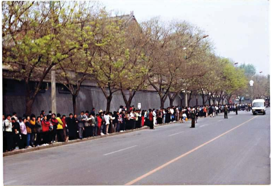
图：1999年4月25日万名法轮功学员和平上访

“放下生死”不过是指敢为捍卫真理而舍弃一切，这本是一种崇高的道德品质，不怕死不是让人去死。再说，古往今来，许多仁人志士杀身成仁、舍生取义的事迹惊天地泣鬼神，永为后人缅怀景仰，他们是为了正义之事而视死如归的，他们的死重于泰山，决不是轻生，诬蔑这些人是对历史的不负责任，是罪恶，妄图用这种手法对法轮功栽赃陷害是徒劳的。