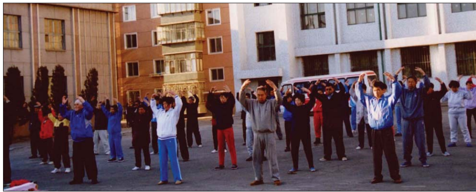
图：一九九八年东北法轮功学员集体炼功

我每天以泪洗面，在极其痛苦中度过每分每秒，于是我狠下心来想出了一个一了百了的办法。轻生的念头一出，结束生命的办法也想出来了。在这关键时刻，丈夫拿回来一本《转法轮》，他对我说：别人都说炼法轮功可神奇了，你真心地去学去炼什么病