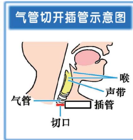
图：采访大面积重度烧伤病人不穿隔离衣？气管切开4天能唱歌？