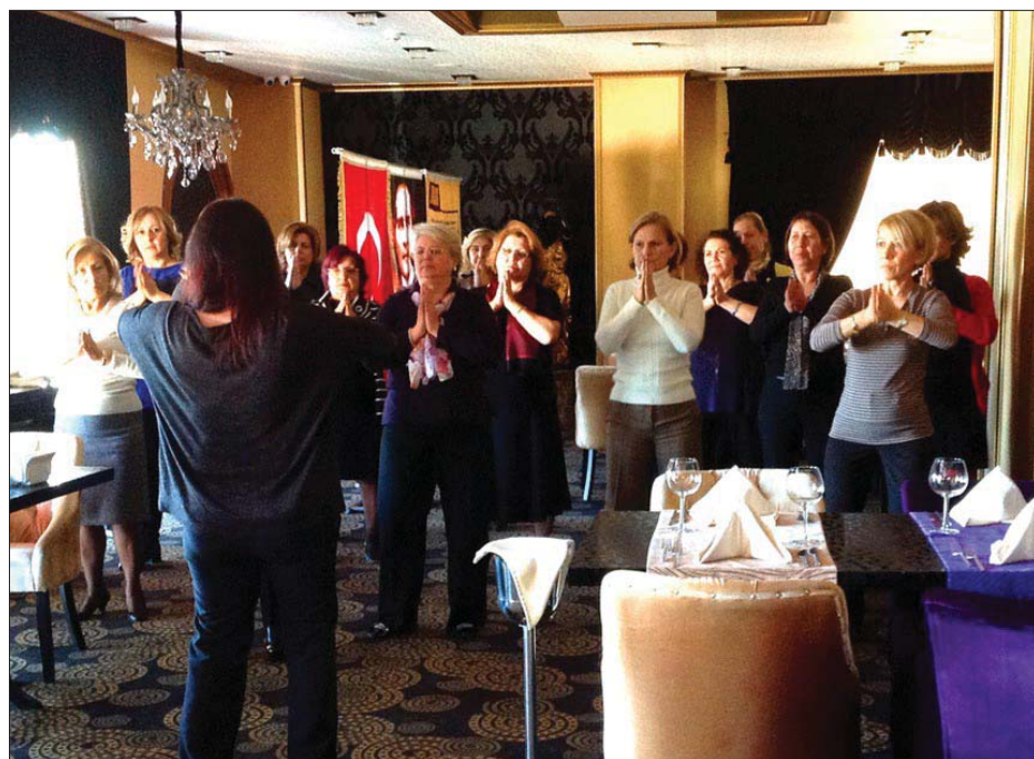
图：国际狮子会土耳其美乐贝分会成员认真学炼法轮功功法

介绍会之后，绝大多数与会者认真地学炼了法轮功的五套功法。美乐贝分会会长还特意向学员们颁发了感谢证书，感谢学员使她们明白了法轮功真相。两个月前，法轮功学员们曾给国际狮子会土耳其地中海分会