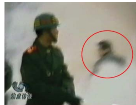
图：CCTV“自焚”节目慢动作分析-4：一名身穿大衣的男子正好站在出手打击的方位，仍然保持着一秒钟前用力打击的姿势