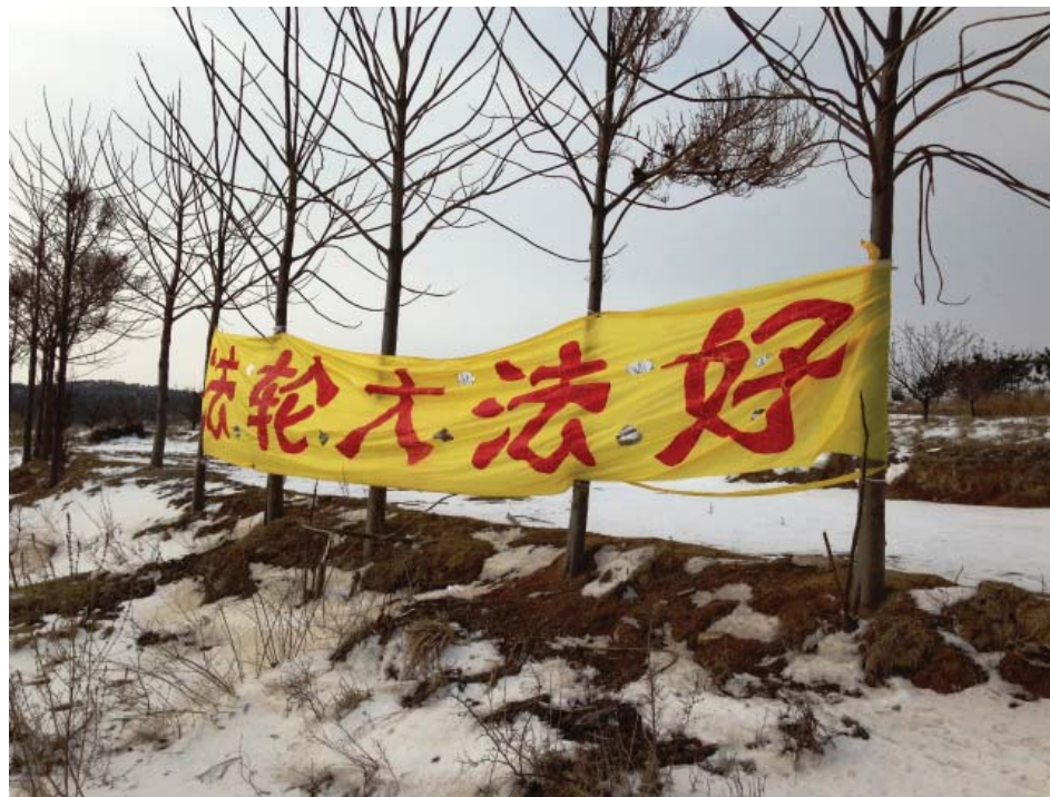
图：中国新年期间烟台某地出现十米长“法轮大法好”横幅

看过《九评共产党》（人们习惯简称为《九评》）的人，越是独具慧眼的，越是赞叹不已。高智晟律师对该书的评价是：“无论《九评共产党》作者是谁，该宏文背后蕴藏着的空前智慧及空前的力量价值将永垂人类正气青史。”大法弟子为什么传播《九评》？很多人认为迫害法轮功是江泽民一手发起的，它是罪魁祸首，但江的残暴能够被推行，是要借助中共制度的，是