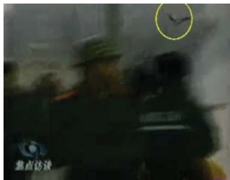
图：CCTV“自焚”节目慢动作分析-3：重物逆着灭火器喷射流飞向警察