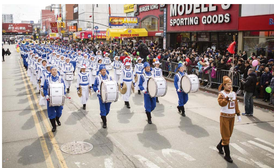
图：法轮功学员参加纽约法拉盛华人新年游行

“很棒！特别是(天国乐团的)演奏让我印象深刻，很激动人心，音乐节奏协调、整齐，非常