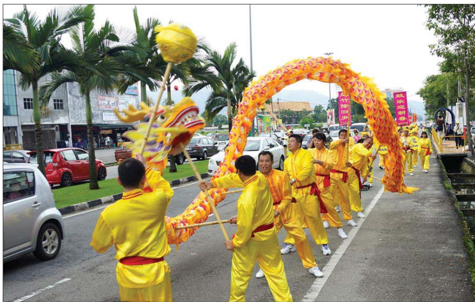
图：大年初四，法轮功学员来到柔佛州第二大城市，株巴辖举行新年游行