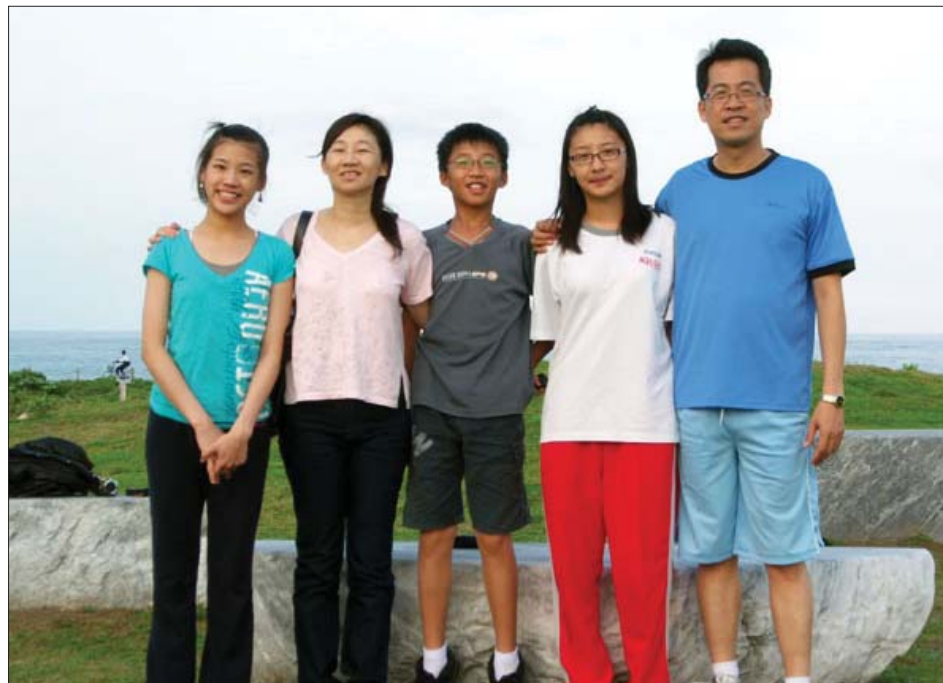
图：全家修炼 其乐融融。

一般国中生，正值青春狂飙期，心性不稳定，但是他的孩子修炼后，心性容易稳定得下来，不但能克制自己，也比较不任性，收放自如的表现是发自内