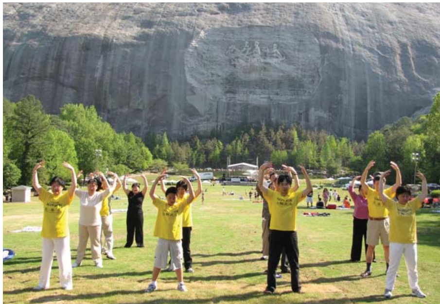
图：亚特兰大法轮功学员在炼功

从那时起，我开始学法炼功，处处要求自己做一个好人，看淡名利，与人为善。从那时起，我的身体从来没有得过病，连常见的发烧感冒都没有。我知道，这是修大法带来的福份，内心深深感激慈悲的师父。