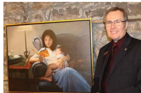
图：国会议员史蒂芬·伍德沃兹表示很高兴通过观赏画展了解了更多有关法轮功的信息。

前亚太司司长乔高表示：“我们正处在一个图象信息的时代，画面比一切语言文字、文章书籍更具有说服力、感染力。”他指着作品《雨中纯真的呼唤》说：“就拿这幅画来说，这位在曼哈顿街头手举横幅、久久伫立在雨中的小女孩，她的眼神和形象我永远都会记得。”