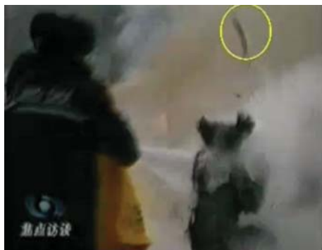
图：CCTV“自焚”节目慢动作分析-2：重物猛击刘的头部后被弹起