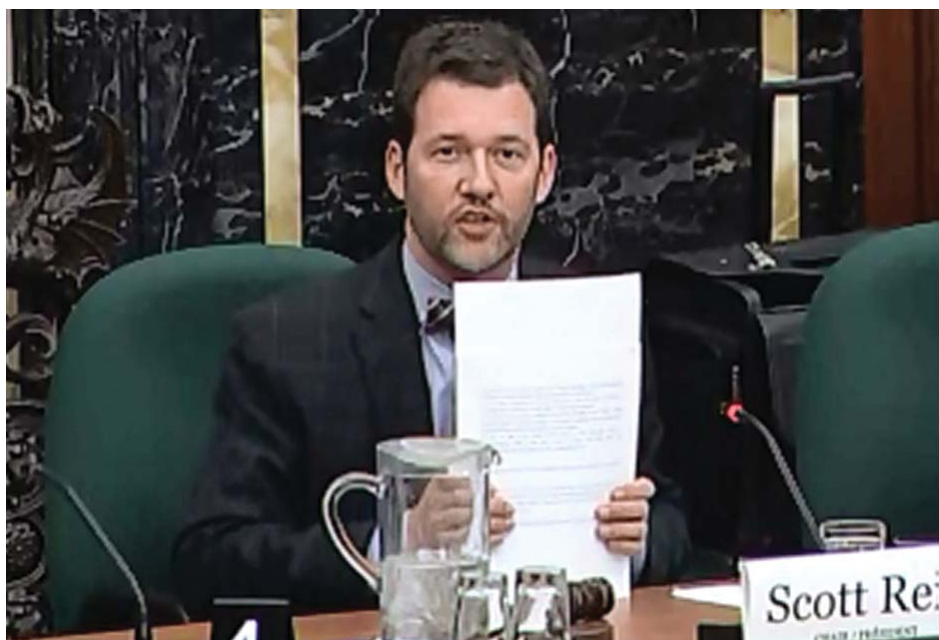
图：加拿大人权委员会主席、国会议员斯科特·瑞德

瑞德议员认为，活体摘取器官越来越引起人们的注意，这是一个明显的人权新案例，它正在变成一个越来越大的问题。他认为两位证人已经证明了他们提出的证据非常令人信服，他们已经