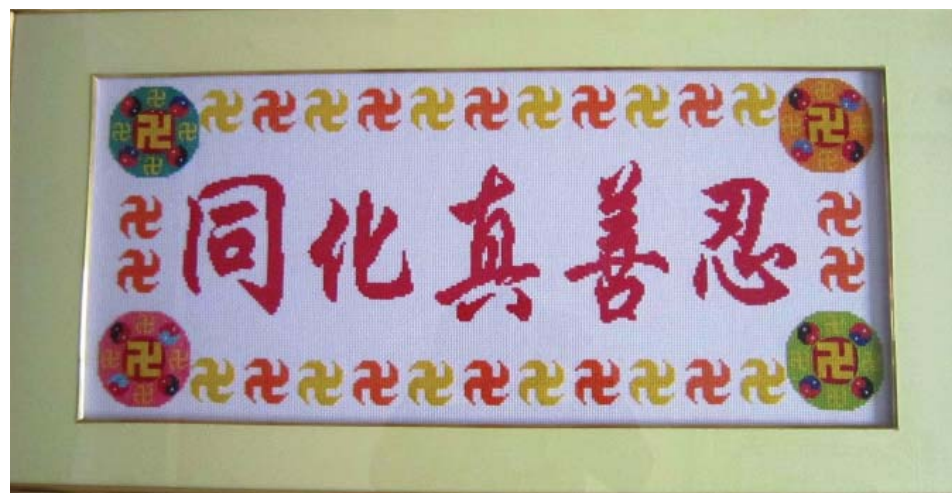
图：十字绣：同化真善忍

我在一个大型企业工作，单位经济效益、医疗都非常好。在医疗费改革前，各大医院、诊所、药店无论开什么药，只要有收据，我都可以报销。我的身体十分不好，药吃的多开的也多，这样一来，用我的名义，一个人就可以管全家甚至亲朋好友没有看病条件的人。因此我的两个孩子从出生一直到我一九九八年三月四日开始修炼法轮大法前，只要有个头疼脑热、小灾小病都用我开的药。从而我也成了个“半个医生”了，什么病吃什么药全懂。尤其是一九九三年六月我从原单位退休跟随丈夫调到丈夫家乡的城市定居，而我的一切人事关系还在原单位，这样我就更有条件了，更是天高皇帝远。我用我的名字给孩子开药、看病，当时孩子年轻很少有病，就给婆婆开西洋参补身子，还用药费买理疗器，再加上我自己用药，给单