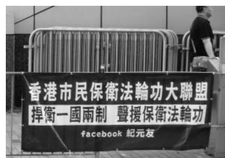
图：香港人支持法轮功的横幅

还有的横幅写着：“‘反党’是个什么罪？（爱国者）”有的上书：“镇压法轮功是中共制造的大冤案，以党代法，以权