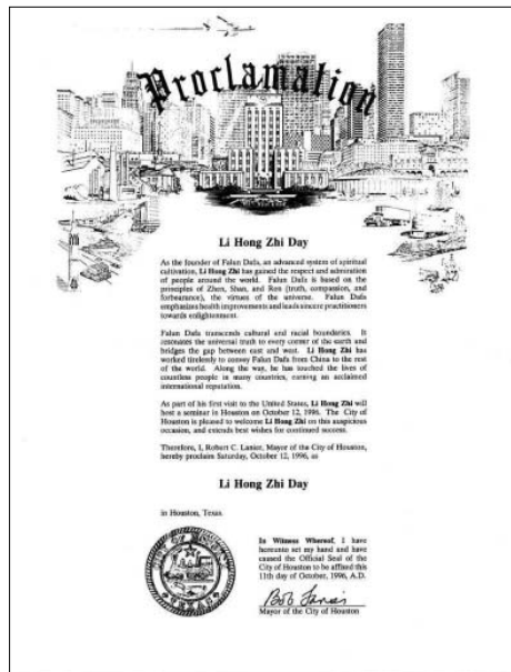
图:美国休斯顿市市长宣布1996年10月12日为“休斯顿李洪志大师日”,图为褒奖状

在世风日下的今天,象陈儒庆这样舍己救人的人已不多见,有些人甚至将这样的人认为“傻子”。那么陈儒庆为什么要冒生命危险去做这样的“傻子”呢?原来,他是一位法轮功学员,他这样做是因为他的信仰所致。获奖后,当有记者问陈儒庆为什么要在冰天雪地里下河救人时,他回答说:“李洪志老师教导我们:作为法轮大法的修炼者,如果你见到杀人放火都不管,就不是我的弟子。那我们看到人都快要死了,你不去救她,作为一个修炼者肯定是不合格的。所以我