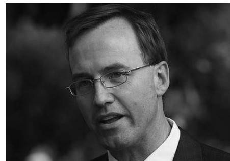
图：澳洲纽省立法会成员、绿党司法事务发言人大卫·舒布瑞吉先生

的活体摘取人体器官和器官交易问题，澳洲纽省绿党起草了一份新的法案，并展开公众咨询。他进一步指出，虽然诸多国家已立法严禁强制摘取人体器官及其买卖，有证据显示，在某些国家，这种行径仍然普遍发生。有可信报导显示，对政治犯和被迫害的少数人权利团体强制摘取器官的案例在中国持续发生。