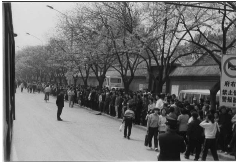
图：1999年4月25日，上访的法轮功学员静静等待着向国务院信访办反映情况。

而在天津事件之前，一九九六年中宣部管辖的新闻出版署就向全国各省市新闻出版局下发内部文件，以“宣扬迷信”为由，禁止出版发行当时名列北京十大畅销书的《转法轮》、《法轮功》等法轮功书籍。