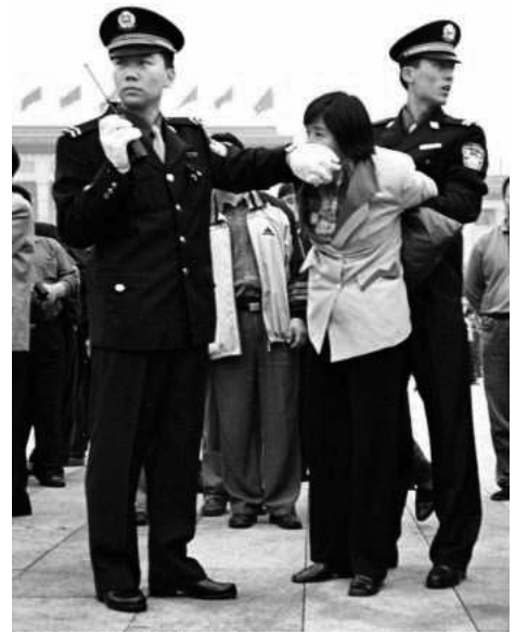
图：2000年10月1日，天安门广场上警察用法轮功学员请愿的黄横幅堵住学员的嘴，以防她喊出“法轮大法好”