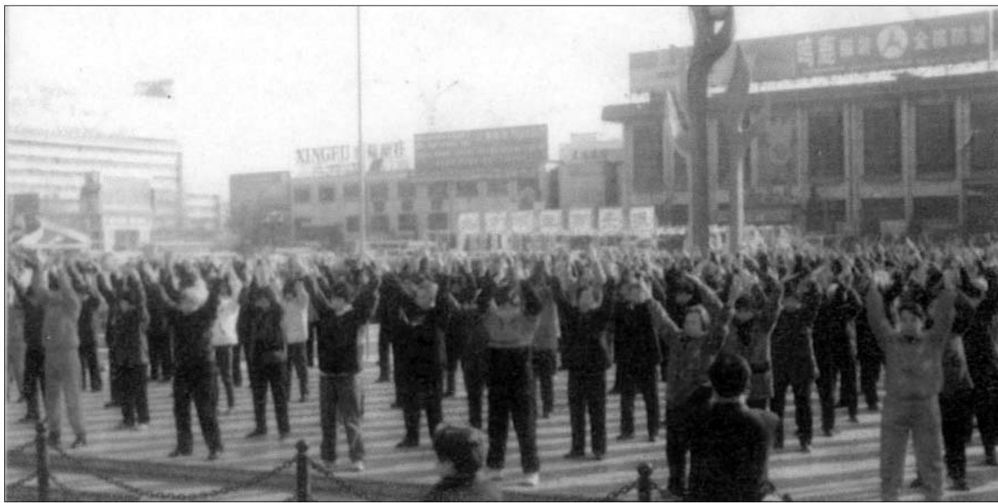
历史图片：一九九八年秋法轮大法修炼者在石家庄火车站广场炼功

看完书我也明白了学其它气功时百思不得其解的问题和许多错误的做法。在其它气功中根本就说不明白的问题，大法师父只寥寥数语就讲的明明白白。当时我就想师父一定比其他气功师高的不知有多少，这回我找到真正的师父了！就在我不断看书的过程中，我的头不晕了，好起来了。回老家过年时，婆婆请来一位大法弟子教会我们全家五套功法动作，从此以后我真正的走入