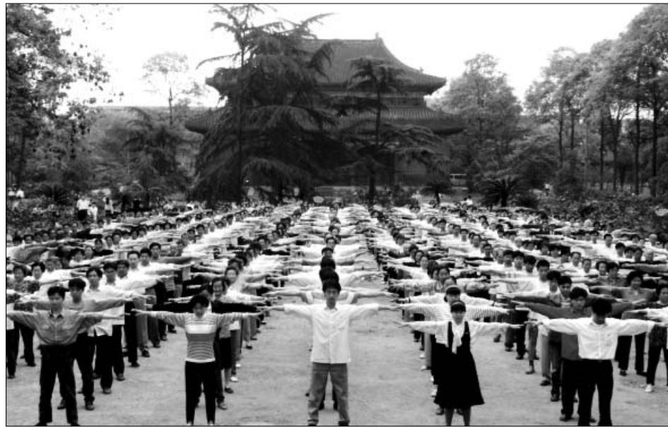
历史图片：四川省成都市的法轮功学员在晨炼

能单纯为了治病来学法，也明白了自己的病是生生世世欠下的业力，以前做了不好的事，今生吃苦遭罪，因果报应是宇宙的理。