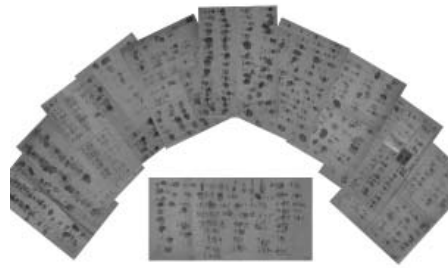
图：民众签名声援法轮功学员

中共政法委一直以维稳的名义，挥霍大量国家财力、物力、人力资源以显示权威，贪污腐败中饱私囊，对民众动则绑架抄家抢劫和罚款，甚至酷刑劳教和判刑，把法律变成一纸空文，使民众对政府公权力失去信心，结果是越维越不稳。中共此次抓捕事件造成的国际影响更为恶劣，原中央政法委书记周永康、现河北省政法委书记兼公安厅长张越，