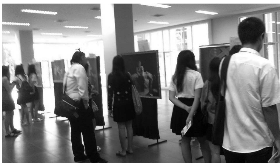
图：学生们认真观看画展

为了让泰国民众了解法轮大法，呼吁人们关注法轮功在中国遭到的迫害，泰国法轮功学员长期在社会上举办真善忍美展，受到各地民众的欢迎。