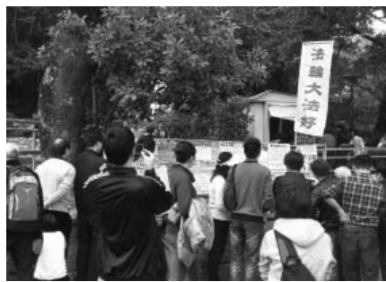
图：新年期间来澳门的大陆游客，阅读法轮功学员展出的真相资料

从初一至初五，三退（退党、退团、退队）人数超过一千五百名，有全家一起退的，有一伙朋友一起退的，有自己在三退登记本上签真名退