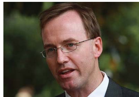
图：澳洲纽省立法会成员、绿党司法事务发言人大卫·舒布瑞吉先生

的活体摘取人体器官和器官交易问题，澳洲纽省绿党起草了一份新的法案，并展开公众咨询。他进一步指出，虽然诸多国家已立法严禁强制摘取人体器官及其买卖，有证据显示，在某些国家，这种行径仍然普遍发生。有可信报导显示，对政治犯和被迫害的少数人权利团体强制摘取器官的案例在中国持续发生。