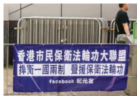
图：香港人支持法轮功的横幅

还有的横幅写着：“‘反党’是个什么罪？（爱国者）”有的上书：“镇压法轮功是中共制造的大冤案，以党代法，以权