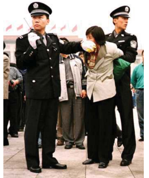
图：2000年10月1日，天安门广场上警察用法轮功学员请愿的黄横幅堵住学员的嘴，以防她喊出“法轮大法好”