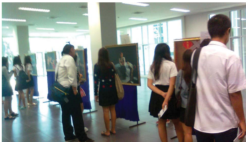
图：学生们认真观看画展

为了让泰国民众了解法轮大法，呼吁人们关注法轮功在中国遭到的迫害，泰国法轮功学员长期在社会上举办真善忍美展，受到各地民众的欢迎。