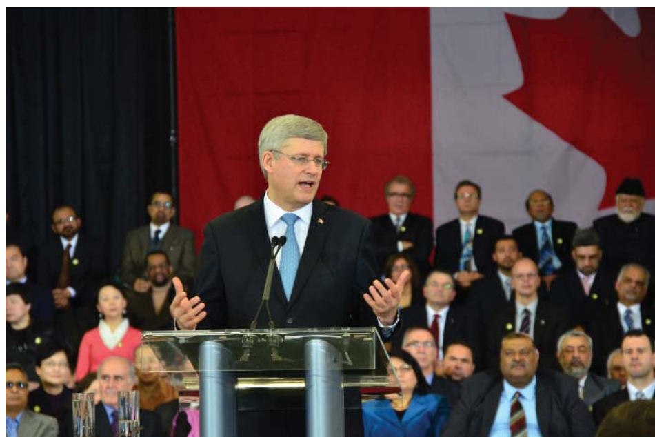
图：加拿大总理哈珀宣布成立宗教自由办公室

哈珀指出，“在世界上，侵犯宗教自由的现象还相当普遍，而且还在增加。”在讲话中特别提到了在中国等国发生的宗教迫害，并表示，中国法轮功学员、西藏佛教徒、维吾尔穆斯林仍遭受打压，基督教信徒被迫走入地下。哈珀说，“面对这些不公及暴行，加拿大不会保持沉默”，