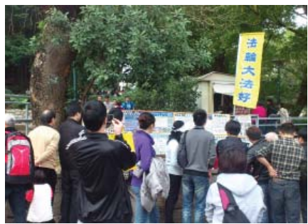
图：新年期间来澳门的大陆游客，阅读法轮功学员展出的真相资料

从初一至初五，三退（退党、退团、退队）人数超过一千五百名，有全家一起退的，有一伙朋友一起退的，有自己在三退登记本上签真名退