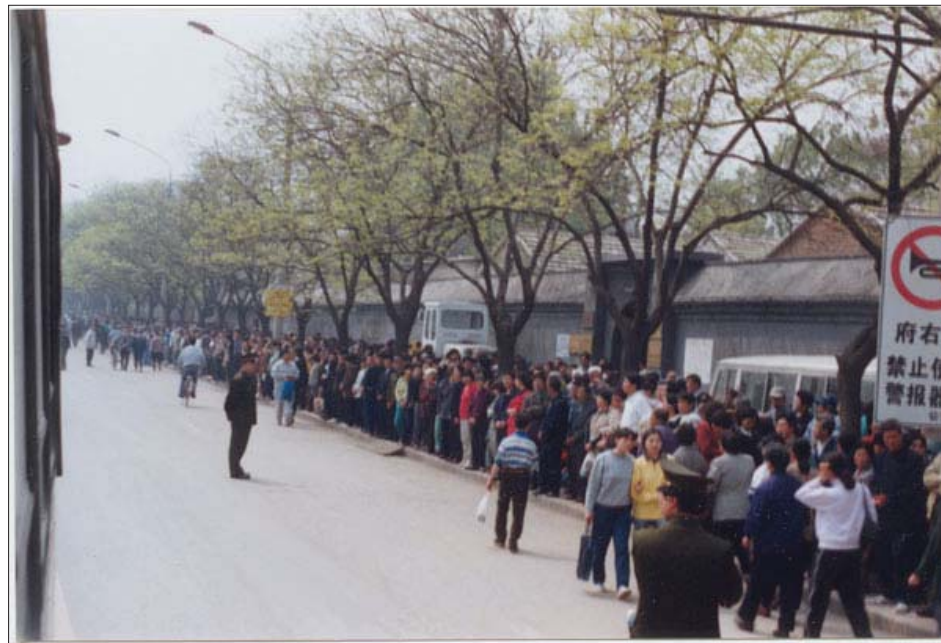
图：1999年4月25日，上访的法轮功学员静静等待着向国务院信访办反映情况。

而在天津事件之前，一九九六年中宣部管辖的新闻出版署就向全国各省市新闻出版局下发内部文件，以“宣扬迷信”为由，禁止出版发行当时名列北京十大畅销书的《转法轮》、《法轮功》等法轮功书籍。