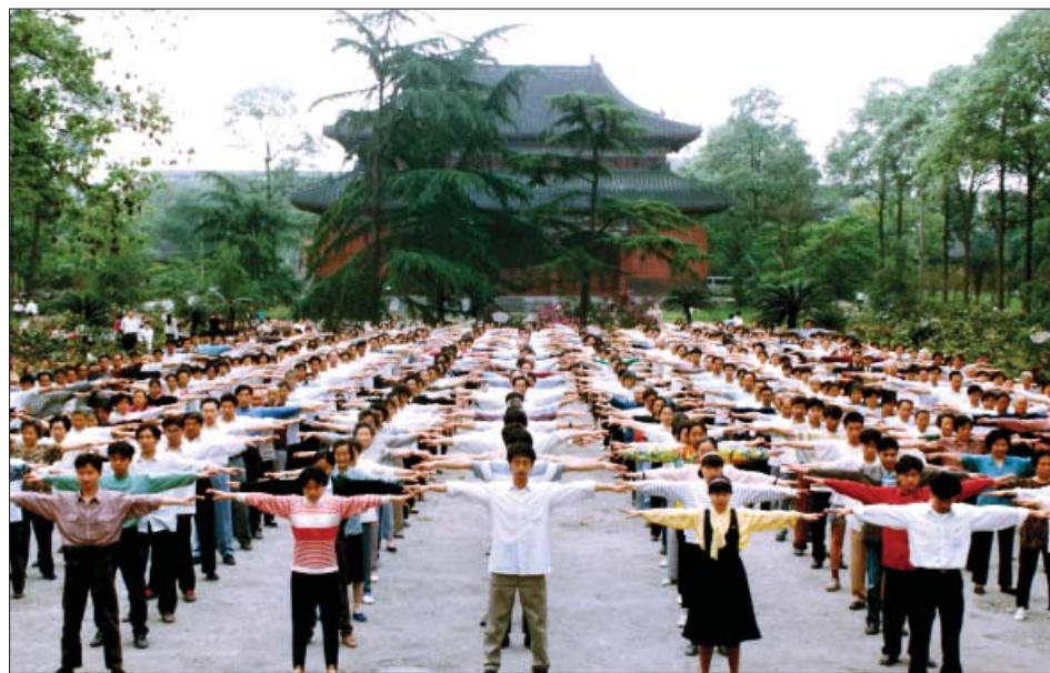
历史图片：四川省成都市的法轮功学员在晨炼

能单纯为了治病来学法，也明白了自己的病是生生世世欠下的业力，以前做了不好的事，今生吃苦遭罪，因果报应是宇宙的理。于是我加紧学法炼功，抄写《转法轮》、背经文，炼功不怕吃苦，开始打坐时双腿疼得汗水泪