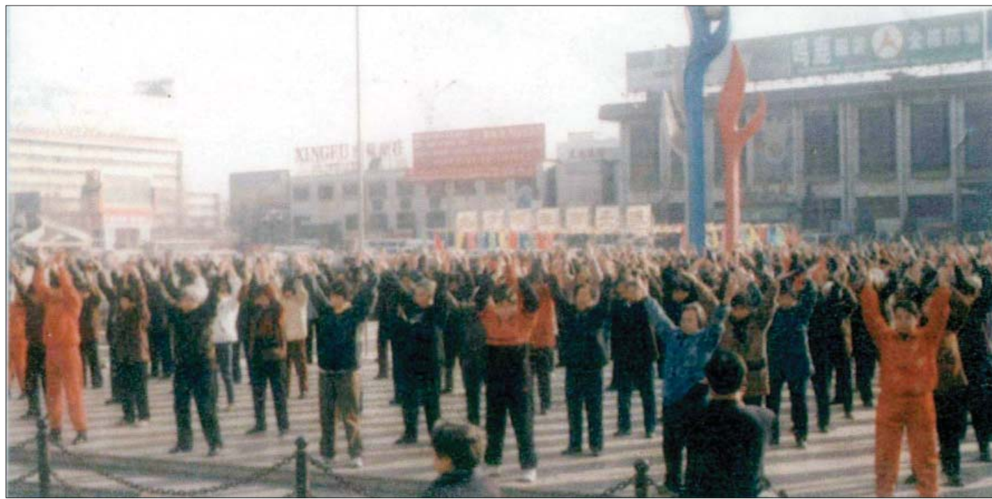
历史图片：一九九八年秋法轮大法修炼者在石家庄火车站广场炼功

看完书我也明白了学其它气功时百思不得其解的问题和许多错误的做法。在其它气功中根本就说不明白的问题，大法师父只寥寥数语就讲的明明白白。当时我就想师父一定比其他气功师高的不知有多少，这回我找到真正的师父了！就在我不断看书的过程中，我的头不晕了，好起来了。回老家过年时，婆婆请来一位大法弟子教会我们全家五套功法动作，从此以后我真正的走入