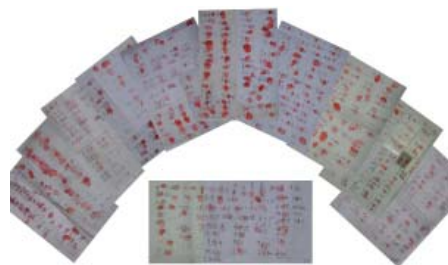
图：民众签名声援法轮功学员

中共政法委一直以维稳的名义，挥霍大量国家财力、物力、人力资源以显示权威，贪污腐败中饱私囊，对民众动则绑架抄家抢劫和罚款，甚至酷刑劳教和判刑，把法律变成一纸空文，使民众对政府公权力失去信心，结果是越维越不稳。中共此次抓捕事件造成的国际影响更为恶劣，原中央政法委书记周永康、现河北省政法委书记兼公安厅长张越，