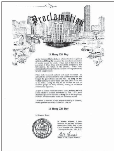
图:美国休斯顿市市长宣布1996年10月12日为“休斯顿李洪志大师日”,图为褒奖状

在世风日下的今天,象陈儒庆这样舍己救人的人已不多见,有些人甚至将这样的人认为“傻子”。那么陈儒庆为什么要冒生命危险去做这样的“傻子”呢?原来,他是一位法轮功学员,他这样做是因为他的信仰所致。获奖后,当有记者问陈儒庆为什么要在冰天雪地里下河救人时,他回答说:“李洪志老师教导我们:作为法轮大法的修炼者,如果你见到杀人放火都不管,就不是我的弟子。那我们看到人都快要死了,你不去救她,作为一个修炼者肯定是不合格的。所以我