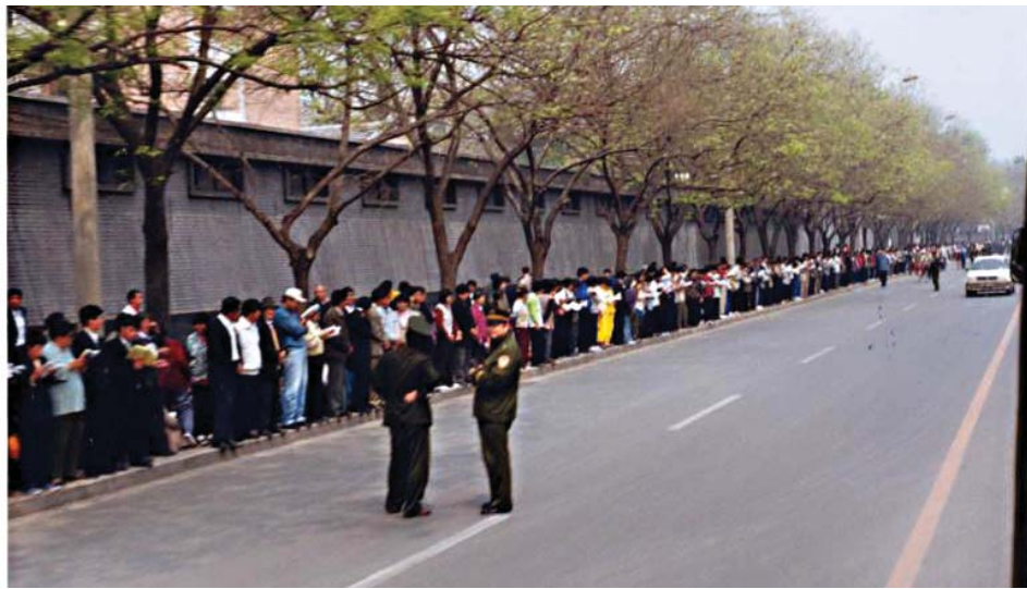
图：1999年4月25日法轮功学员在国务院信访办门外的府右街和平上访