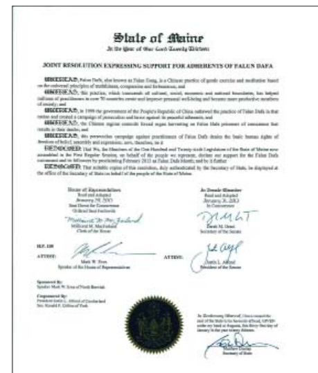
图：缅因州参众两院支持“法轮大法学员”的联合决议

因此，缅因州第一百二十六届议会的议员现聚集在第一次正式会议上，代表缅因州人民，宣布我们对法轮大法和法轮大法学员的支持，并将二零一三年二月定为法轮大法月；并进一步决定由州务卿确认的决议案复印件，将陈列在缅因州州务卿办公室。