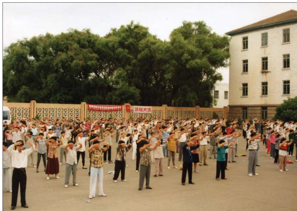
历史图片：1999年7月中共非法镇压法轮功以前东北一处法轮功集体炼功场景。

就在二零零八年的秋天，我突然得了“顽固性皮肤病”，怎么治也治不好，越治满身象个烂窝瓜似的，出血流脓，就在我痛不欲生的情况下，我又到她家去了，我说：我看你炼功炼的什么病都没了，我明天也跟你学法炼功吧。她说：好啊，你什么时候想炼就炼。我说：今天不行，我得回家商量一下，因我家供个“保家仙”（低灵），我得跟它商量。到了晚上，我对着那个牌位说：我供你这么多年，你也没