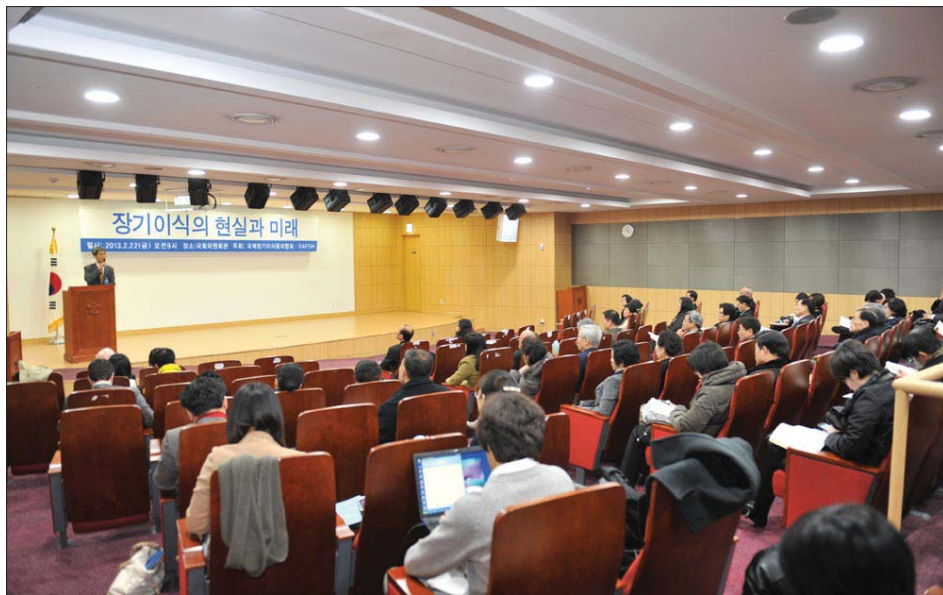
图：各界专家在韩国国会召开研讨会，探讨制止中共活摘器官的方案

拉维教授在发布会的演讲中提到，在举行活动、促进立法禁止以色列人到中国去接受器官移植过程中，顶住了来自中共外交和经济方面的胁迫。针对这个问题，《中央日报》和《周刊东亚》记者请拉维教授介绍如何正确面对中共压力。对此，拉维教授说：“我是二零零五年开始做这件事的，那时一名亲共的律师打来电话，威胁说：‘你如果一直搞这种活动的话，我要在法庭上告你。’我把这个受威胁的事