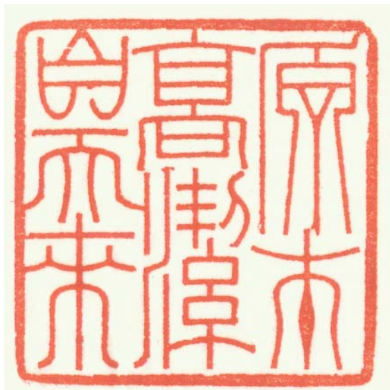
篆刻：原本高潔自天來

这时单位的领导让我去负责我市一个区的二百多家餐饮行业客户的燃料销售计量和收费工作。由于计量仪表的老化、更换不及时，以及单位财务管理上的不完善，使我对查收用户燃料费的多少有着相当大的决定权，随意性很强。