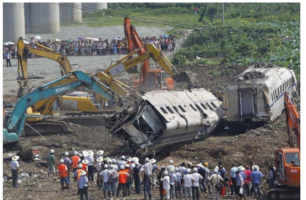
图：7·23 动车事故后，当局掩埋事故车厢。

从她的言论可以看出，她要的只是平安出门、快乐回家的权利。这是一个在正常社会中，人们应当积极参与、过问的最平常