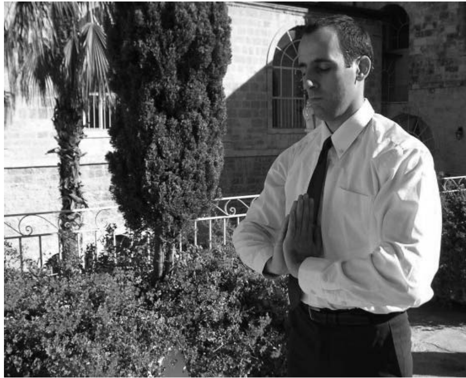
图：欧哈德在修炼法轮功后不仅得到了身体的健康，也找到多年心中困惑的答案。

炼功两周后，欧哈德按照以前就预约好的时间，去睡眠实验室进行了一次健康检查。他说：