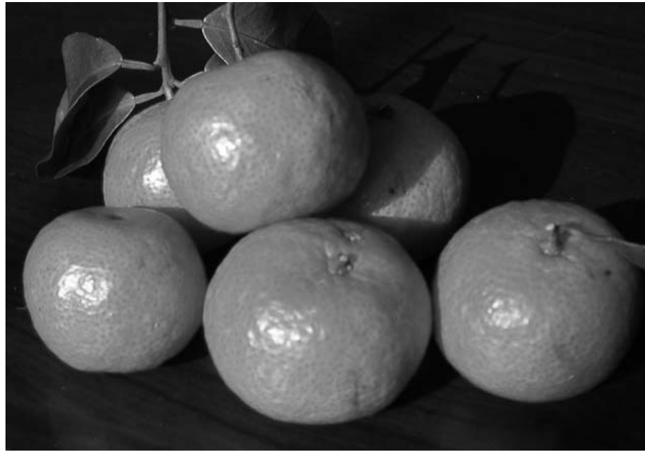
图：刘伯温写的“金玉其外，败絮其中”难道不正是中共以破坏道德的代价，所谓发展经济造成的社会现状的写照吗？

依靠这个用来养活自己。我卖它，别人买它，不曾有人说过什么的，却唯独不能满足您的要求吗？世上做欺骗的事的人不少，难道只有我一个吗？你没有好好的思考。