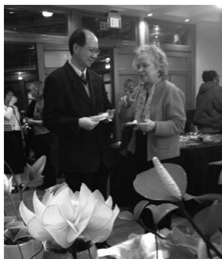
图：法轮功学员介向市长办公室来宾（右）介绍发生在中国的迫害情况