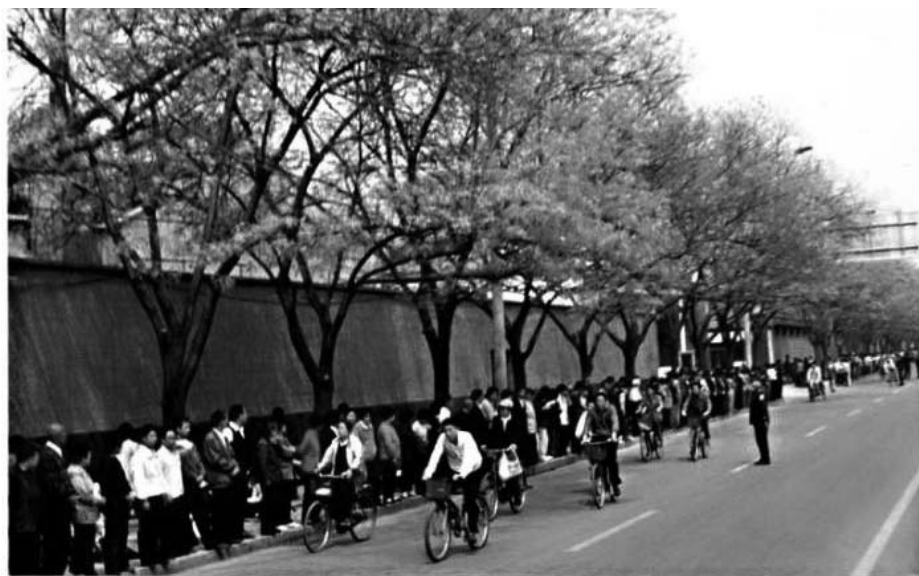
图：秩序井然的“四·二五”上访民众

这就是所谓的“1400例”，而其它攻击法轮功的谎言，也都是这样捏造出来的。希望善良的人们都能看清中共的造假本质，走出谎言的陷阱。