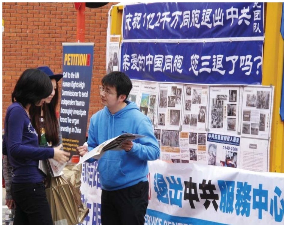
图：退党自救正成大陆民众的头等大事

“听说过贵州‘中国共产党亡’的藏字石吧？你干这行，你最清楚共产党的邪恶，你说它能不遭天谴吗？物极必反。现在民众已觉醒，全民反迫害，从几百上万人按手印声援受迫害的法轮功学员，到风起云涌的民众大规模维权抗暴，历史的巨变就在眼