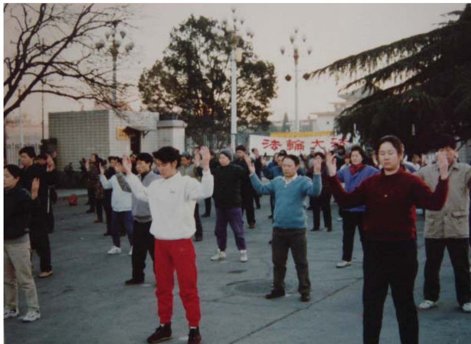
历史图片：一九九九年七月中共开始迫害法轮功之前北京朝阳区一个法轮功炼功点

我在修炼前曾被检查出乳腺小叶增生病，医生建议我做手术切除，我没同意。修炼法轮大法后我就忘了乳腺小叶增生病，修炼第三年的一天我忽然想起了这个病，用手一摸，原先象玉米面饼那样的硬块不见了，什么时候好的？不知道。还有自小就经常头痛的毛病也没有了，肺结核也没有了，每到夏季有时出现的痢疾病也没有了。这些毛病都是在不知不觉中师父给我去了病根了。感冒症状和小时候得的腿部关节炎症状出现那也不超过三天