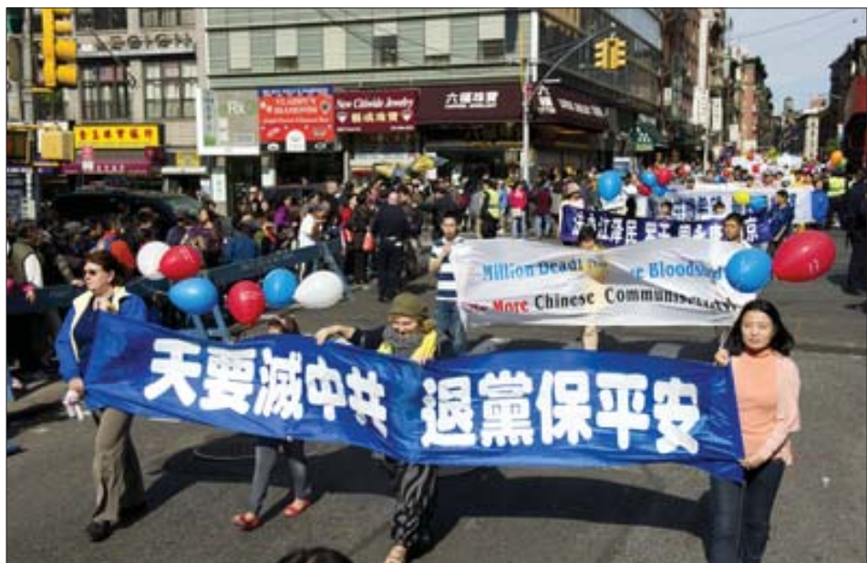
图：美国纽约各界在中国城游行，庆祝一亿四千万中国人三退。