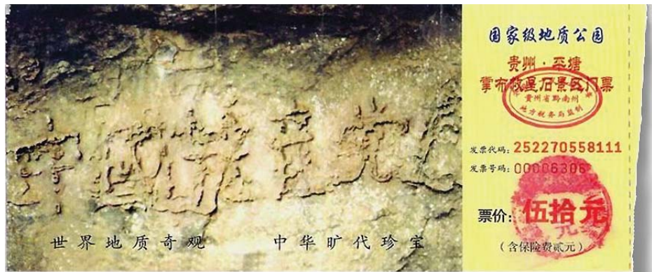
图：贵州省平塘县掌布乡国家级地质公园门票

恶；《解体党文化》则着重介绍了中共破坏传统文化和道德，建立的一套包括“无神论”邪说在内的“党文化”系统，蒙蔽、毒害中国人。这两本书值得研读，