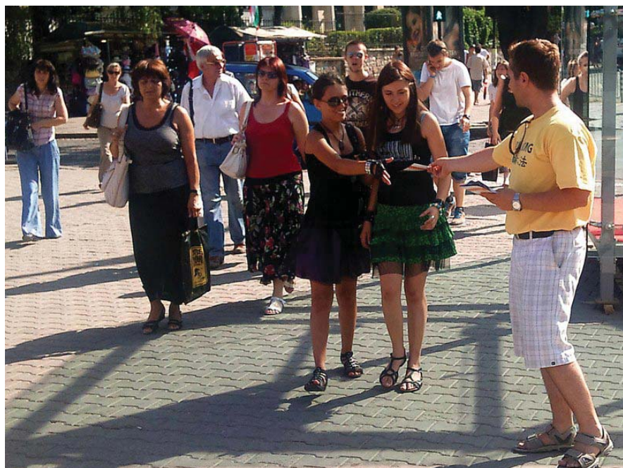
图：法轮功学员在保加利亚索非亚市街头发传单讲真相

我们无意去拿喂狮子的受害者与被活摘器官的受害者来比较，我们看到的是施暴者如何变得更加阴毒、险恶和变态。古罗马是狮子在吃人，而中共是为了发泄私愤和捞取金钱去杀人，是用活人的器官去赚取暴利，等同于人吃人。