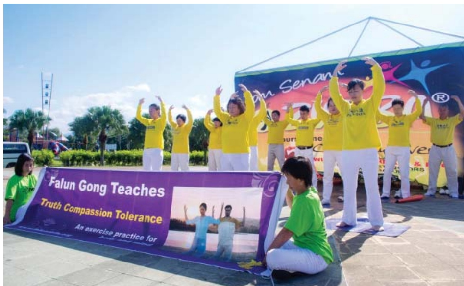
图：马来西亚法轮功学员在健身慈善活动中为大家示范五套功法

法轮大法，也称法轮功，是一九九二年五月由李洪志先生传出的佛家上乘修炼大法，以宇宙最高特性“真善忍”为根本指导。经亿万人的修炼实践证明，法轮大法是大法大道，在把真正