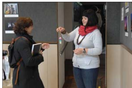
图：法国驻克罗地亚大使米奇·柏库兹（左）接受写有“法轮大法好”的纸莲花

她的丈夫一起参观了展览。一位学员向他们详细解释展出的照片，以及目前在中国发生的迫害。柏库兹女士表示感谢，并接受了纸莲花和资料。