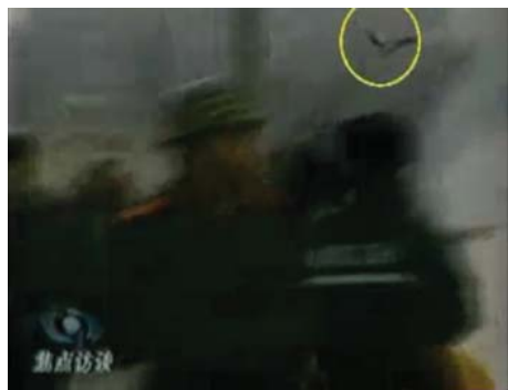
图：CCTV“自焚”节目慢动作分析-3：重物逆着灭火器喷射流飞向警察