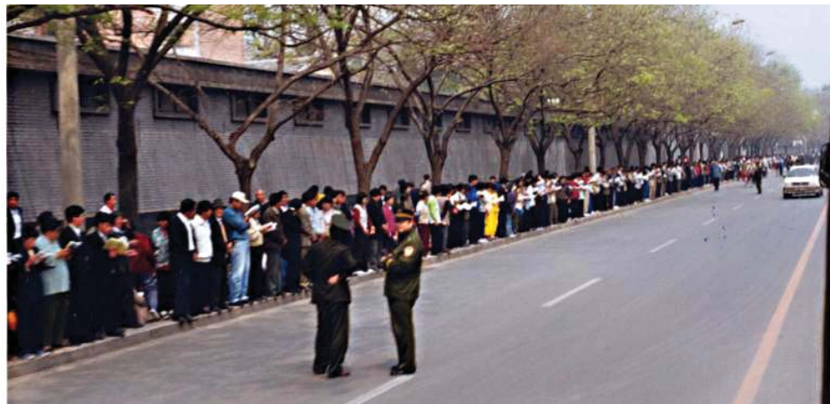
图：“4·25”和平上访的人群。可以看到执勤的警察在闲聊（注意上访人群身后不是中南海紫禁城特有的红色围墙，人群实际是在中南海对面的马路和府右街，可见“围攻”之说乃是陷害）

这样一个被暴政逼死的“贫苦农民自杀案”，却被中共嫁祸到法轮功身上，并通过电视、广播等反复向全国播放，欺骗百姓。