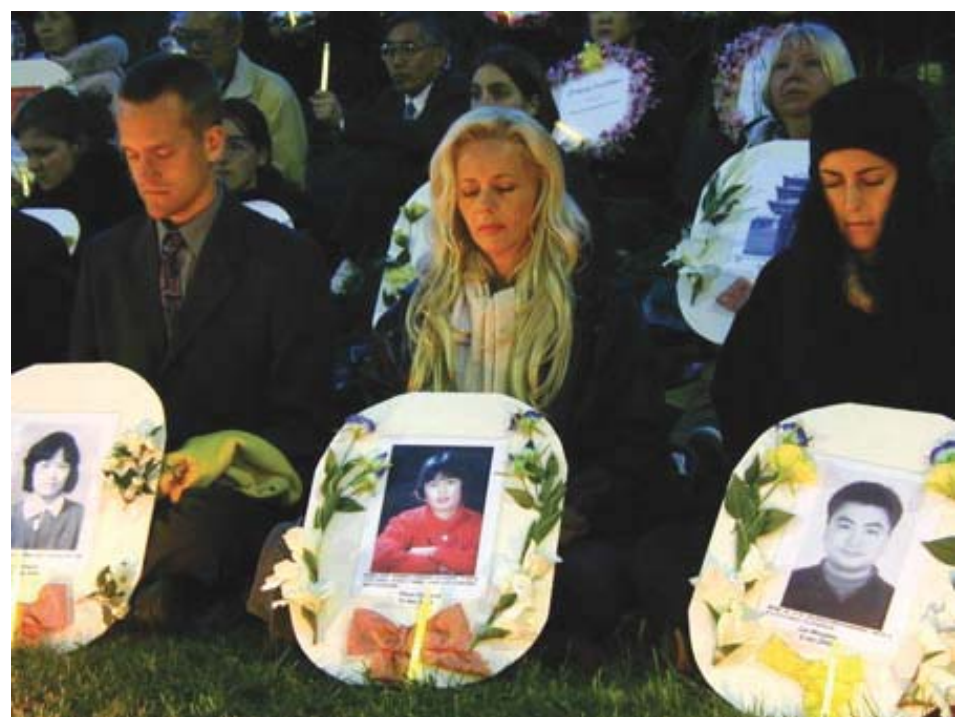
图：法轮功学员烛光守夜悼念被迫害致死的同修

他们只是普通的老百姓，却敢于对抗无比强大的邪恶政权。他们身上，由中国人久违的骨气。对法轮功的诬蔑，早已在时