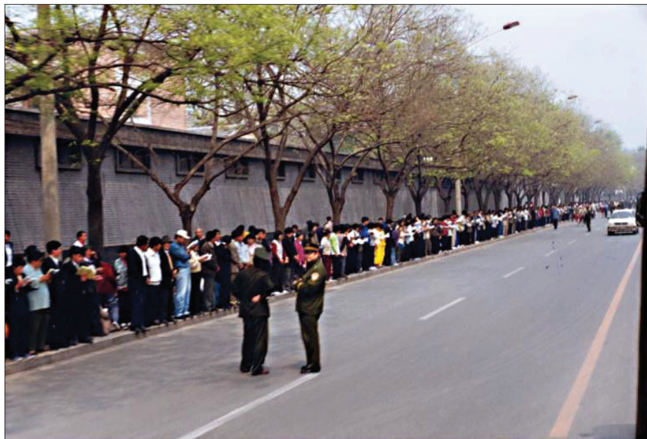
图：一九九九年四月二十五日，逾万名法轮功学员在北京和平上访