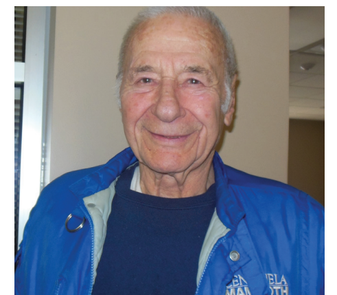
图：知名卫生法学家南森·何希教授

2005-06年度美国肾和胰腺移植委员会主席。他表示中共活体摘取法轮功学员器官的恶行受到美国医学协会和美国器官移植委员会的强烈谴责。这样的不法器官移植是根本不应该发生的，必须立刻停止！他希望自己今后能为制止暴行提供更多的帮助。