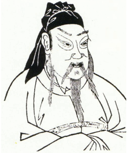
图：义薄云天的关羽

老公公安接过话说，谈到“忠”，那就是忠于政府，听党的话。我告诉老公公安，“忠”不是上边说啥，你都服从照办，那只能是像和珅那样拍马溜须、阿谀奉承的奸臣干的。这还是在正常社会中讲是这样。如果是在像商纣王