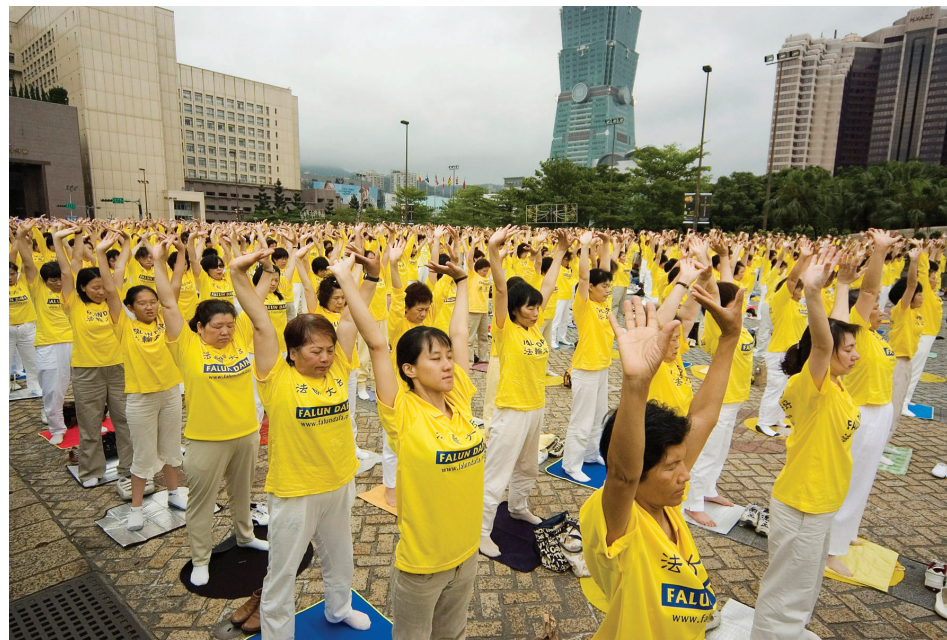
图：炎黄两岸，同沐佛光，中原蒙难，台岛洪扬。图为二零零六年五月台湾台北市府前千人炼功。