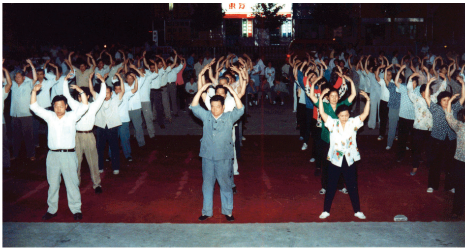
历史图片：1997年8月，山东省潍坊市部分法轮功学员应邀参加潍城区政府在潍州剧场组织的全民健身体育表演

我儿子当时八岁，经常跟着我和姥姥打坐比赛，我读法给他听，教他按照真善忍做人，孩子从小在法中修炼，身心健康。丈夫也很支持，还要求婆母也来炼功。家族其他成员看到我们这么大的变化，也纷纷走入大法中修炼。