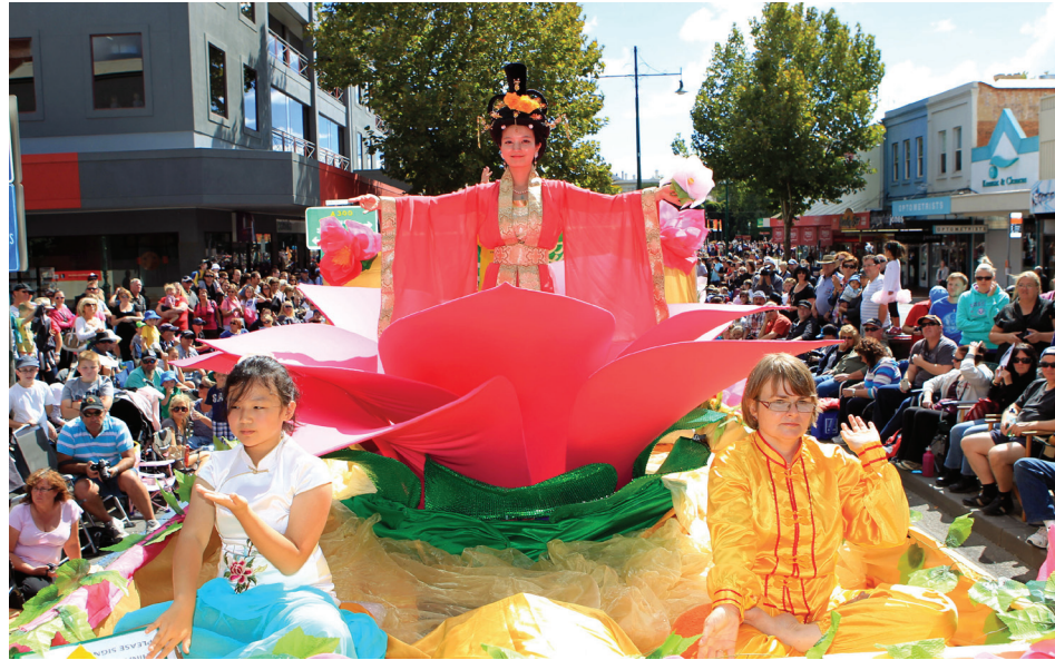
图：法轮功学员参加澳洲班迪戈复活节大游行

天国乐团演奏了《法轮大法好》、《佛恩圣乐》等，乐曲威武雄壮、响彻天宇。超凡脱俗的花车紧随其后，玉洁冰清的仙女坐在圣洁的莲花上，一幅幅写有“真、善、忍”的彩幡、祥和的功法演示、明丽的扇子舞、欢