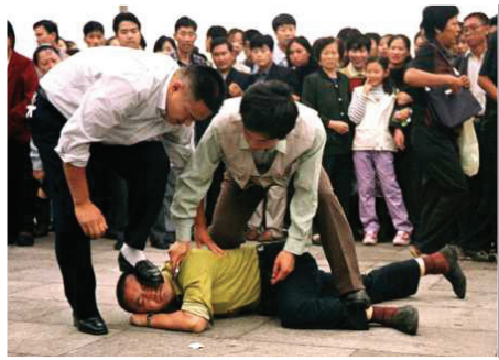
图：围观者观看中共便衣警察光天化日下毒打法轮功学员。照片由美联社记者2001年10月摄于天安门广场。

我一生中看到的最令人毛骨悚然的故事是：在非洲部落中，发生了问题，女巫婆会说，「神」告诉她这个姑娘被妖怪附体了，所以给部落带来了灾难。然后，整个部落的人，就会高高兴兴地把这个姑娘砸死，煮熟以后吃光她的肉。在这个过程中，女巫婆没有灵魂，谁被附体了，是「神」告诉她的。姑娘没有灵魂，或被认为没有灵魂，附体的