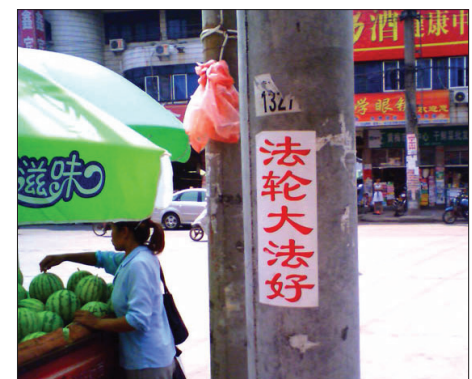
图：大陆湖北黄梅县街头标语“法轮大法好”

「信仰自由」作为一种价值，被世界上几乎所有国家以法律的形式进行保护，干涉信仰自由往往会构成犯罪。连中国的刑法中也规定有「非法剥夺宗教信仰自由罪」。中共在法轮功问题上犯了个愚蠢的错误：作为一个无神论政权，它可以认定所有有神论都是错误的，但它万不该插手评价哪个有神论是「正」的，哪个是「邪」的，更不该在其荒谬的评价基础上用暴力方式去「洗脑」、「转化」一个正常的善良人。中共在干涉信仰自由方面实际上是犯了罪的，当然这是另一个话题。