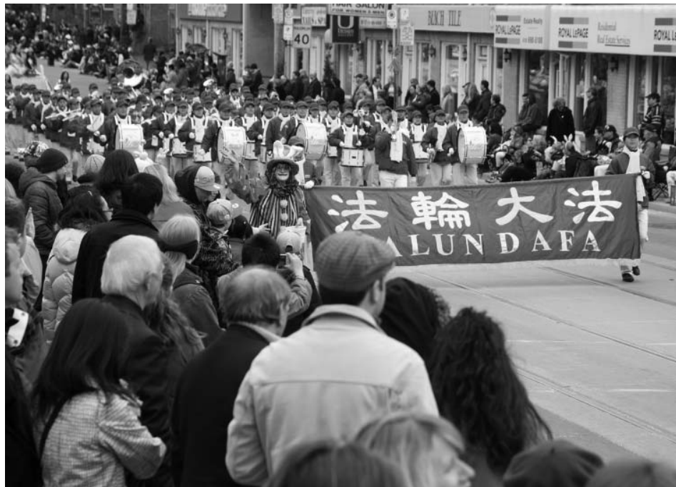
图：天国乐团是游行队伍中最大的一支队伍

复活节是最古老的基督教节日之一，为纪念耶稣于公元三十三年被钉死后第三天复活，世界各地的基督徒每年都要庆祝，复活节被认为象征神的复活以及希望。