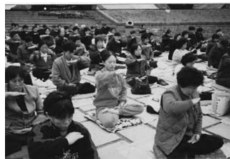
图：1999年1月2日，在四川成都市塔子山公园炼功的法轮功学员。

从那时到现在快十七年了，从未吃一粒药。修炼后，每次消业都是过生死关。不管多难，家里人从来不叫我去看医生，因为他们看得很清楚，从前看了那么多医生、用了那么多药，遭了多少罪我身体也不见好，就是学了大法才开始变好，他们见证了大法的超常。我自己把它当作提高的机会，坚持学法，守住心性，