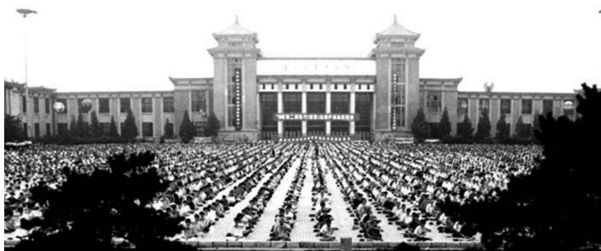
图：1999年迫害之前，辽宁沈阳市万人炼法轮功场面。

看到父亲认真学法轮功所发生的巨大变化，我们全家都受到极大的震撼，并再次感受到大法的神奇！是大法使我们健康、快乐、幸福，我们不知道用什么语言来感谢师尊，感谢大法。我们全家人经常发自内心的喊：“法轮大法好！”我们要告诉世人，法轮大法是千载难遇、万载难遇的能够真正救人出苦海的高德大法！