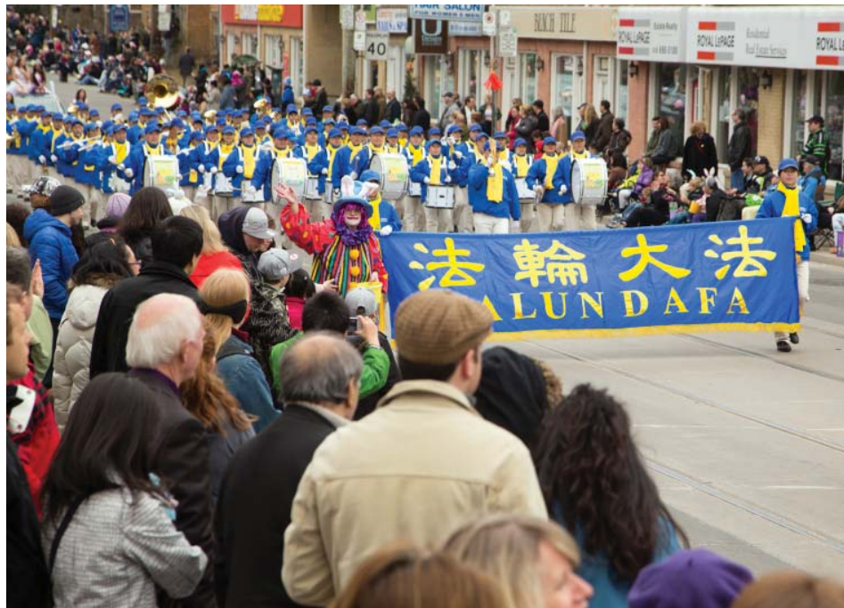
图：天国乐团是游行队伍中最大的一支队伍

复活节是最古老的基督教节日之一，为纪念耶稣于公元三十三年被钉死后第三天复活，世界各地的基督徒每年都要庆祝，复活节被认为象征神的复活以及希望。