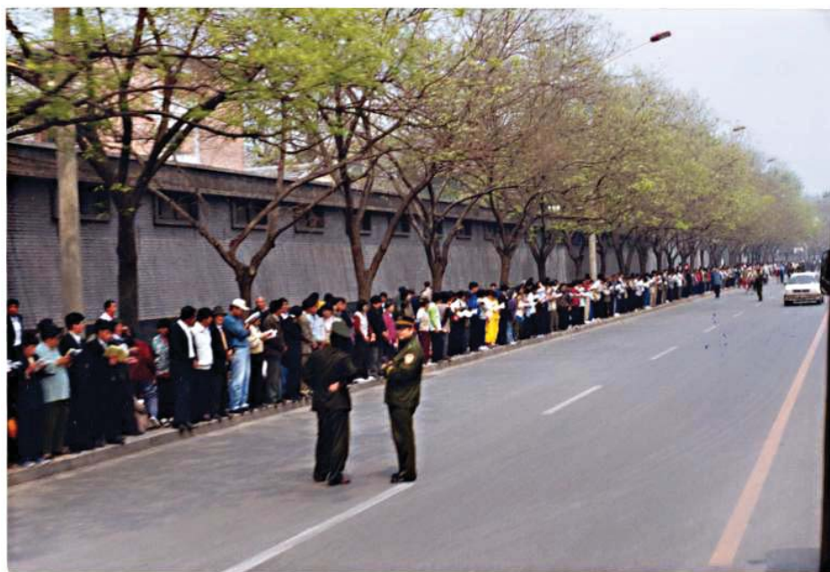
图：一九九九年四月二十五日，逾万名法轮功学员在北京和平上访

中共一直以暴力和谎言维护其统治，使得一些中国人的理念被中共的恐吓和迷惑所扭曲。有人说，是四二五上访导致了中共对法轮功的迫害。其实以江泽民和中共对权力的变态心理，即使没有四二五事件，他们也会制造其它事端进行迫害。引起四二五上访的天津警察抓人事件，本身就是中共制造的事端。在四二五之前中共就已经在对法轮功学员进行打压，不然法轮功学员也就不会在上访时提出“释放被抓学员”、“允许法轮功书籍正常出版”、“给予一个合法的修炼环境”这样的要求。早在一九九六年，中共公安部就以先定罪再调查的方式对法轮功罗织罪名，只是因为法轮功做得太正，中共没