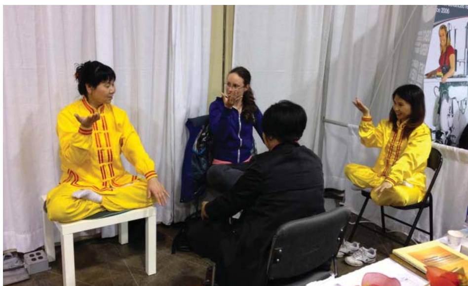
图：感兴趣的人们正在学炼法轮功功法

在法轮功学员的柜台前，不断有的人询问关于炼功的详细信息、关于气功中的一些不解的问题，有的人现场学习炼功动作。一位女士听到法轮功学员介绍说，义务教功，不收分文，一直不相信自己的耳朵，“真的吗？