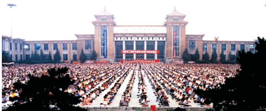
图：1999年迫害之前，辽宁沈阳市万人炼法轮功场面。

看到父亲认真学法轮功所发生的巨大变化，我们全家都受到极大的震撼，并再次感受到大法的神奇！是大法使我们健康、快乐、幸福，我们不知道用什么语言来感谢师尊，感谢大法。我们全家人经常发自内心的喊：“法轮大法好！”我们要告诉世人，法轮大法是千载难遇、万载难遇的能够真正救人出苦海的高德大法！