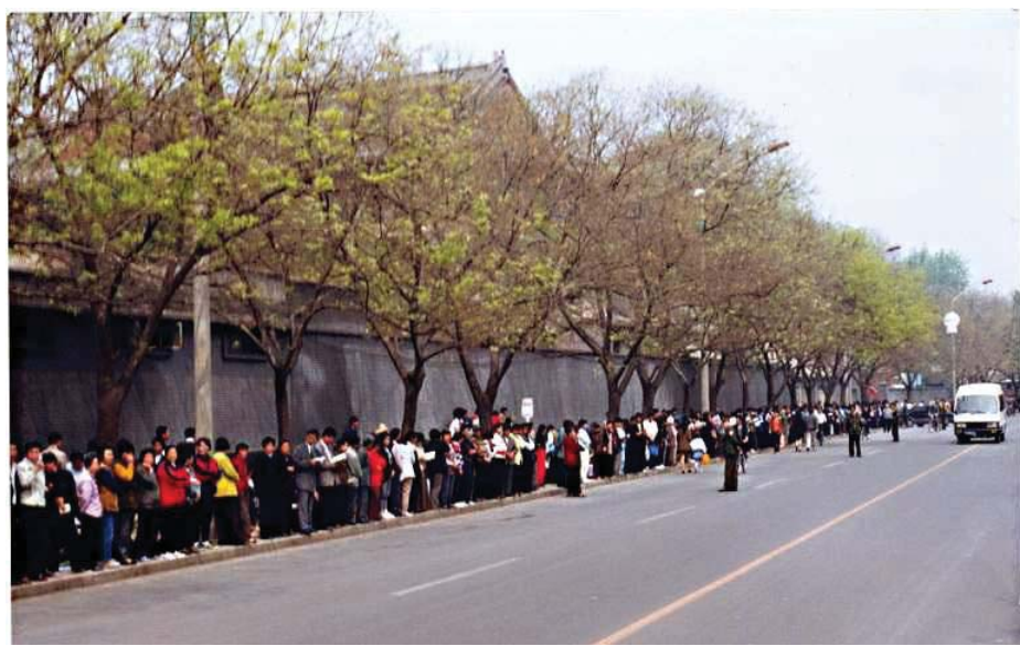
图：1999年4月25日万名法轮功学员和平上访