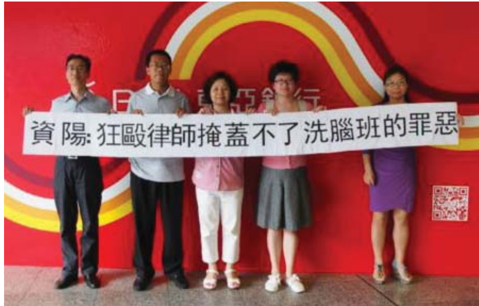
图：律师举牌抗议众人权律师在资阳被殴打扣押

自从中共开始迫害法轮功以后，中国出现了一大堆名叫“法制教育中心”“法制培训中心”“法制教育所”“法制教育基地”等等这样的地方。其实