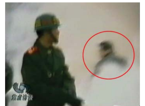
图：CCTV“自焚”节目慢动作分析-4：一名身穿大衣的男子正好站在出手打击的方位，仍然保持着一秒钟前用力打击的姿势