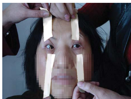
酷刑演示：不许闭眼