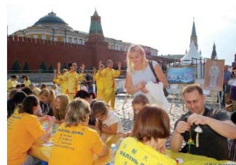
图：法轮功学员们在莫斯科红场教人们叠纸莲花

了解真相后，很多人感到震惊，表示没有想到这么宁静祥和的功法会受到迫害，纷纷谴责中共暴行。