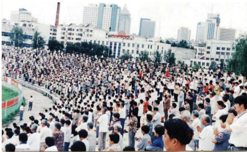
历史图片：1999年“7.20”迫害全面公开开始之前，哈尔滨3万人在体育场晨炼法轮功法。