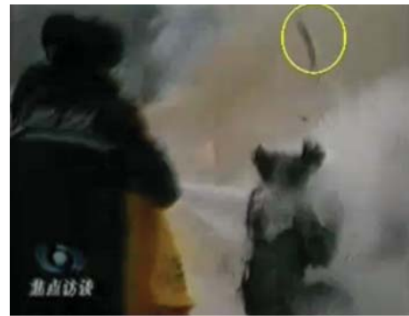
图：CCTV“自焚”节目慢动作分析-2：重物猛击刘的头部后被弹起