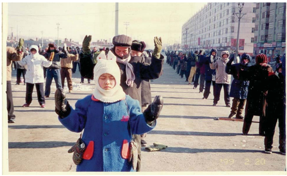
历史图片：黑龙江省双城市法轮功学员集体炼功，承旭广场