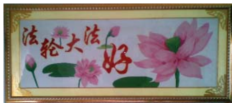
十字绣：法轮大法好

现在的学校订学习资料、订校服等都有回扣，这些回扣我都用在学生身上，有一届学生，从一年级到六年级毕业，自己没有买过作业本，都是我用回扣的钱买的。还有学校返回的书费，