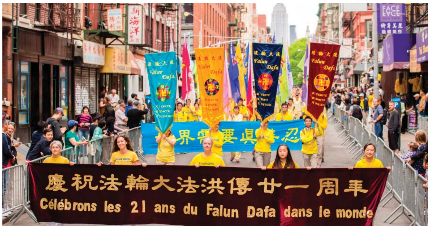
图：五月十八日，来自世界各地的法轮功学员汇集纽约曼哈顿中国城举行纪念法轮大法洪传二十一周年大游行。