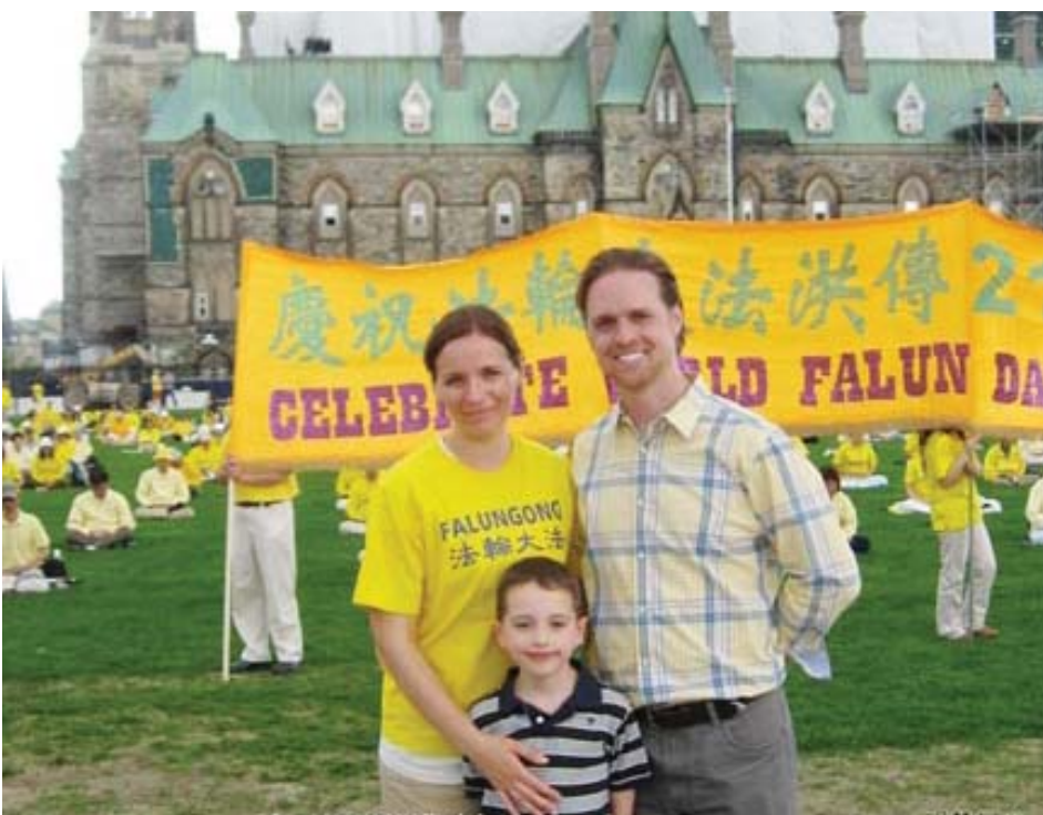
图：德鲁与妻儿二零一三年五月八日在加拿大首都渥太华国会山前庆祝法轮大法传世二十一年