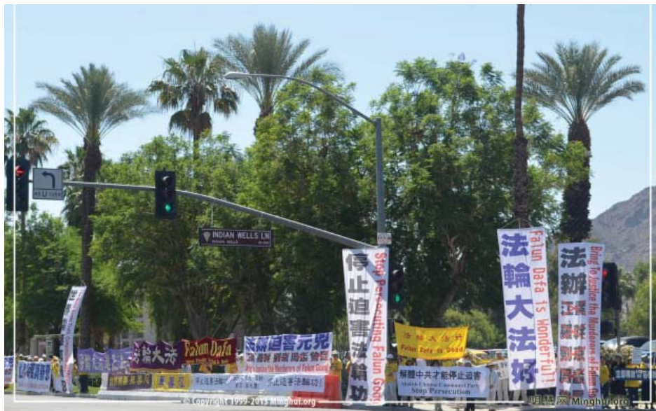
图：美国法轮功学员六月七日在习近平车队必经之路上要求法办迫害元凶

报导说，根据一份由美国国际宗教自由委员会发布的二零一三年报告，在过去的十四年，有超过三千五百名法轮功学员死于迫害。“但是，美国国务院指出，法轮功学员可能占官方记录的劳教所囚犯的一半。”