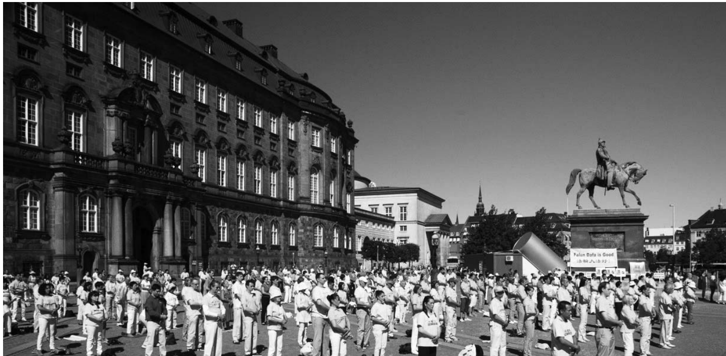
图：欧洲法轮功学员在丹麦首都哥本哈根的国会广场集体炼功

堡（Christiansborg），汇聚了丹麦的立法、行政和司法三大权力机构，里面设有国会、立法