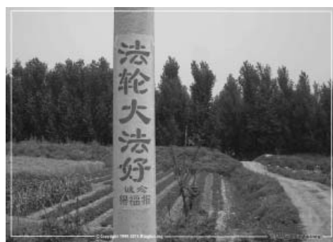
图：山东临沂市沂蒙山区的真相标语