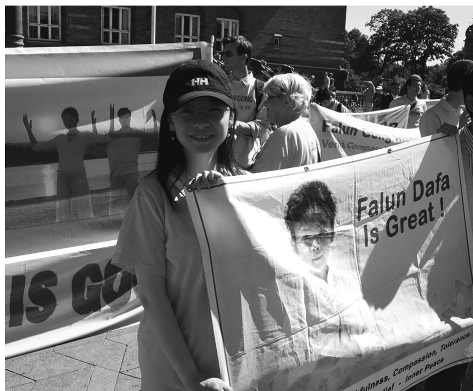
图：零一三年七月二十日，小金参加在丹麦首都哥本哈根举办的和平反迫害游行

特想看这本奇书，但那时她最在乎的是考试成绩，就想等考完试再看吧，没想到考完试她就把看书这事给忘了，这一误就误了十