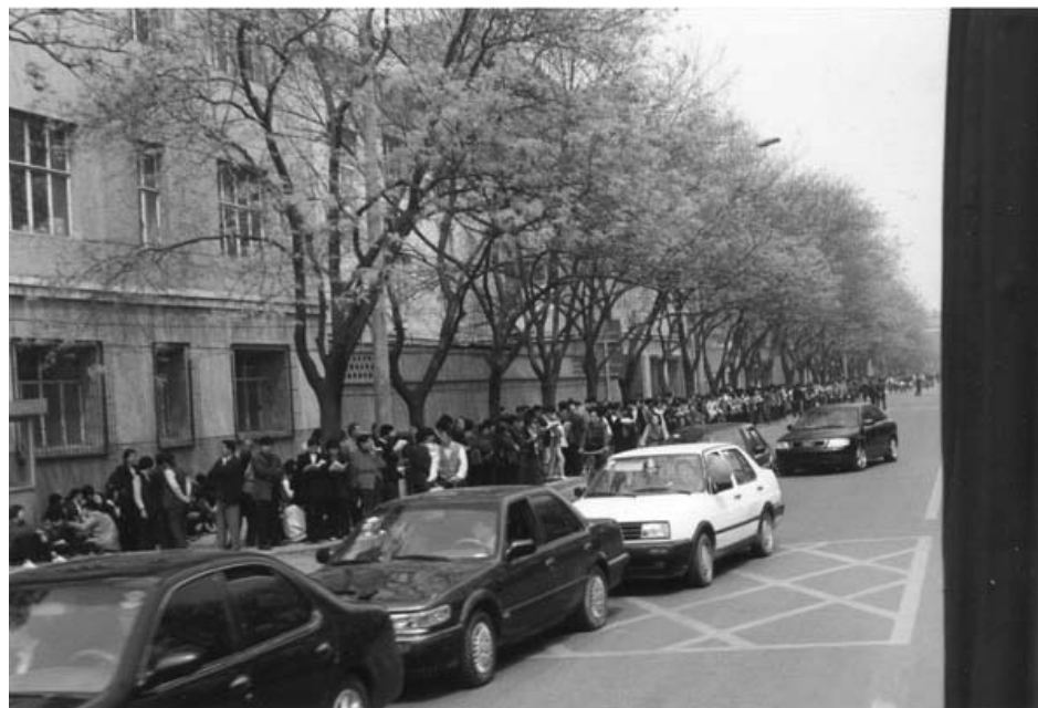
图：中共动用喉舌媒体罔顾事实对法轮功进行污蔑攻击、禁止法轮功书籍正常出版、动用公安非法骚扰甚至殴打法轮功学员等等，都是1999年4月25日万名法轮功学员集体和平上访起因。图为当时法轮功学员集体和平上访（注意街道上汽车、自行车都可以正常行驶，社会秩序正常）。

1999年4月25日法轮功学员集体到位于府右街的国家信访办上访，而信访办就在中南海附近。上访过程中，法轮功学员极其的平和安静，没有标语、口