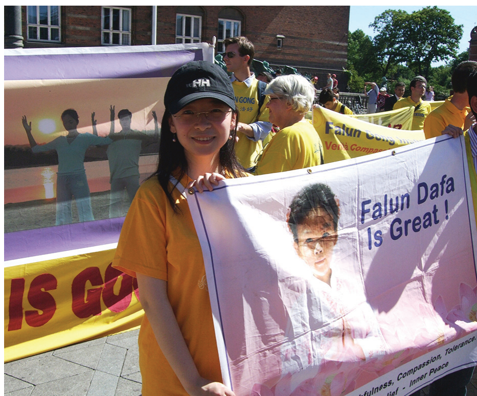
图：零一三年七月二十日，小金参加在丹麦首都哥本哈根举办的和平反迫害游行

特想看这本奇书，但那时她最在乎的是考试成绩，就想等考完试再看吧，没想到考完试她就把看书这事给忘了，这一误就误了十