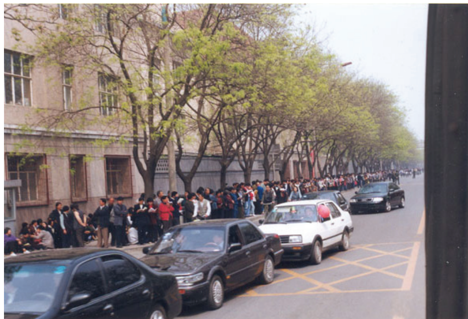
图：中共动用喉舌媒体罔顾事实对法轮功进行污蔑攻击、禁止法轮功书籍正常出版、动用公安非法骚扰甚至殴打法轮功学员等等，都是1999年4月25日万名法轮功学员集体和平上访起因。图为当时法轮功学员集体和平上访（注意街道上汽车、自行车都可以正常行驶，社会秩序正常）。

1999年4月25日法轮功学员集体到位于府右街的国家信访办上访，而信访办就在中南海附近。上访过程中，法轮功学员极其的平和安静，没有标语、口