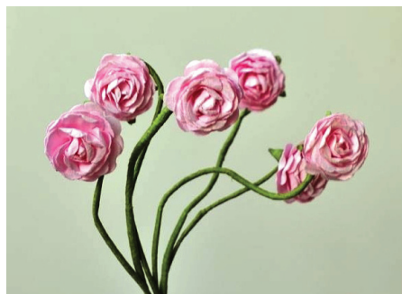
图：山西省晋城市看守所的奴工产品

取暴利，根本不顾被非法关押的法轮功学员和其他在押人员的死活。在押人员每天都处在超紧张的氛围中被奴役着，每天都在担心着完不成定额数量。