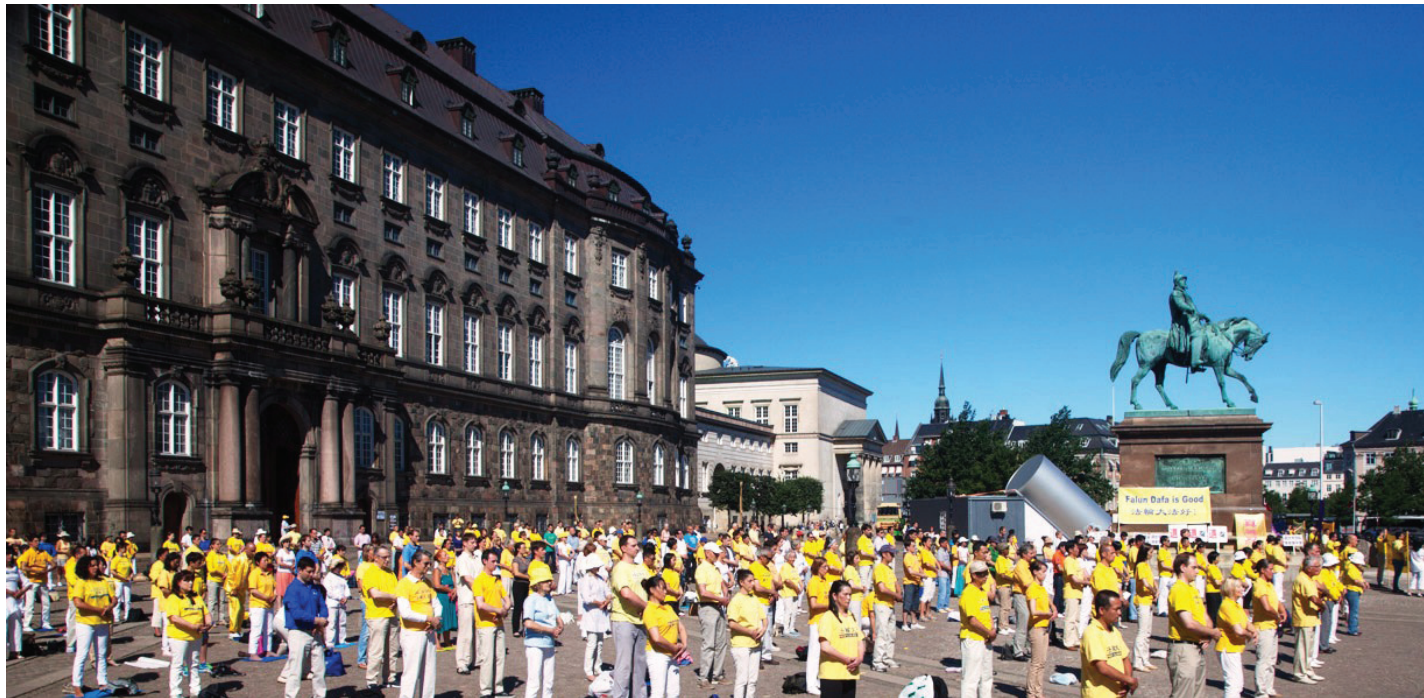
图：欧洲法轮功学员在丹麦首都哥本哈根的国会广场集体炼功

堡（Christiansborg），汇聚了丹麦的立法、行政和司法三大权力机构，里面设有国会、立法