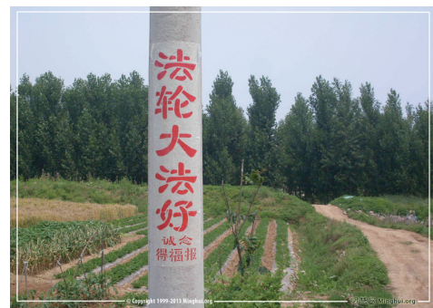
图：山东临沂市沂蒙山区的真相标语