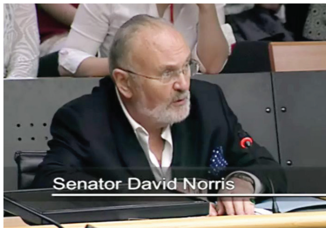
图：爱尔兰参议员大卫·诺瑞斯在听证会上提出针对阻止活摘法轮功学员器官的决议以及立法的议案

麦塔斯和古特曼运用大量调查数据和事实资料得出结论，二零零零年至二零零五年间，至少有六万五千多名法轮功学员被