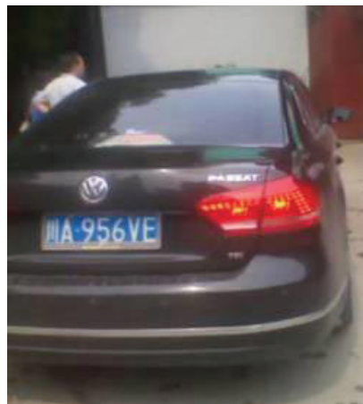
劫持袁斌的主车（捷达川A 8G225）上有四名绑匪，跟车帕萨特（川A 956VE）上有三名绑匪