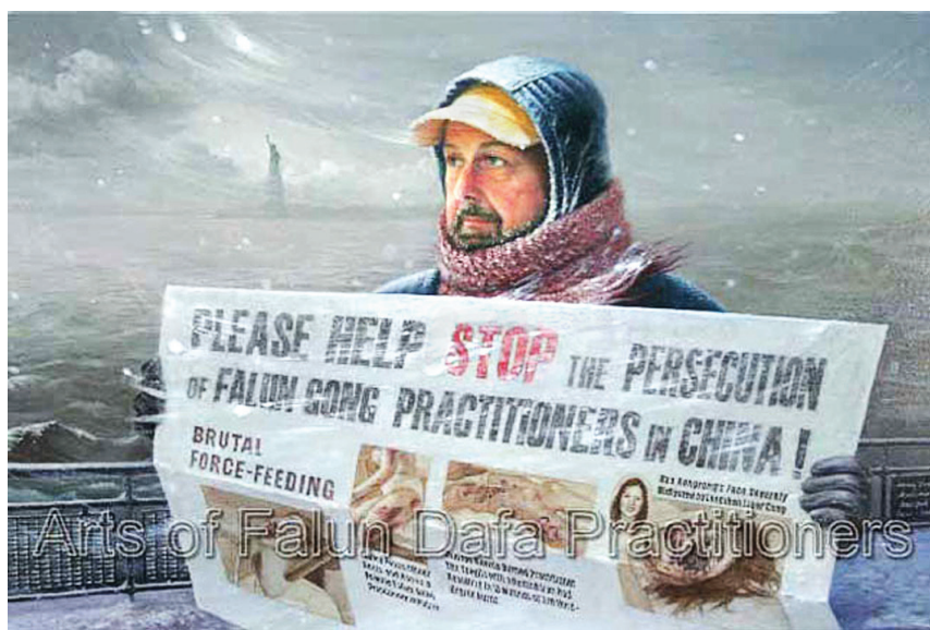
图：油画《在暴风雪中》

报，只为送出一份真相；面对误解者的谩骂，依然心怀慈悲良言相劝，这样的付出和境界用多少钱能买来的呢？