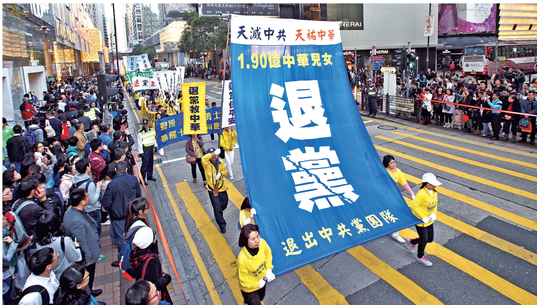
图:二零一五年一月十七日, 法轮功学员在香港集会游行, 反迫害、并声援退出中共的1.9亿勇士。