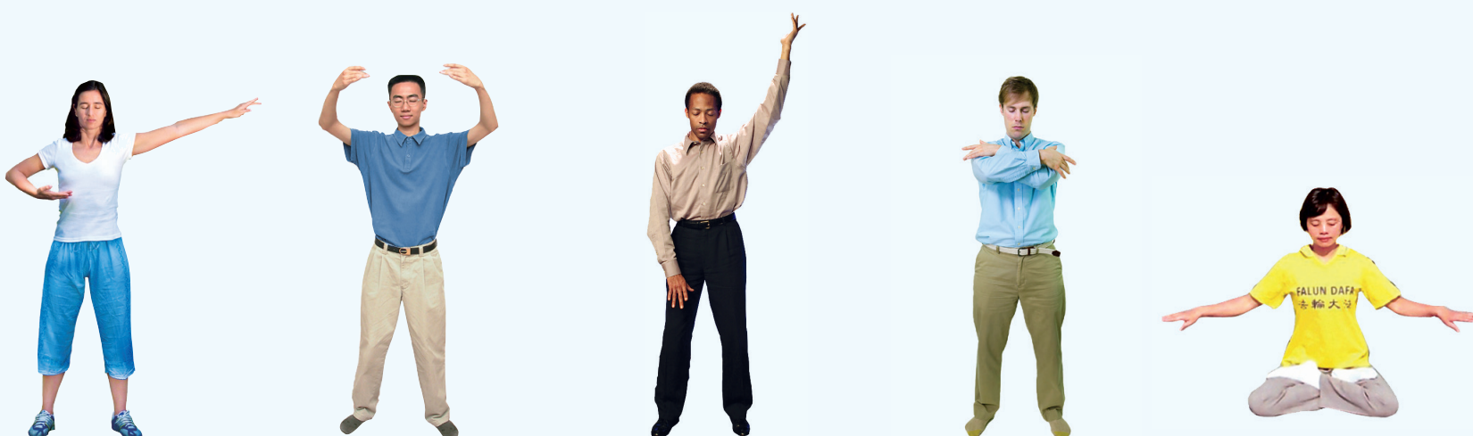
（一）佛展千手法 （二）法轮桩法 （三）贯通两极法 （四）法轮周天法 （五）神通加持法

■全套法轮大法书籍、教功录像DVD和炼功音乐，均可在法轮大法网站免费阅读或者下载： www.FalunDafa.org