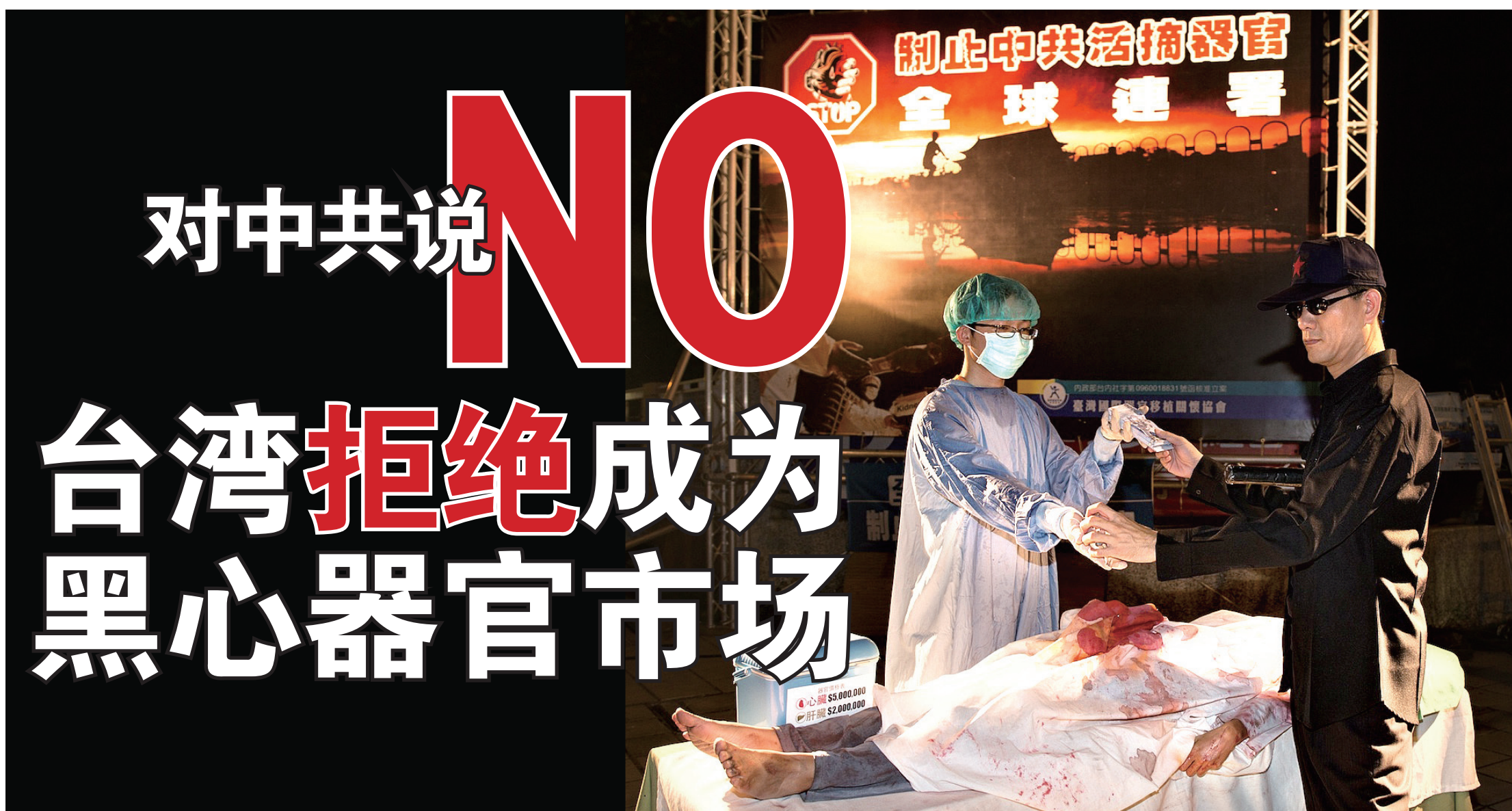
图:高雄法轮功学员在街头上演“制止中共活摘盗卖法轮功学员器官”行动剧。

【明慧记者苏容、孙柏台湾综合报导】前中共卫生部副部长黄洁夫去年到台湾一周，在外界谴责中共活摘良心犯与法轮功学员器官声浪中，于二零一四年十二月十九日参访高雄长庚医院时，竟抛出要建立两岸器官移植合作平台，更透露所谓“明年大陆器官输入台湾”的讯息，引发台湾各界严正抨击。对此，台湾行政院卫福部二十三日回应，黄洁夫这个想法“不可行”，卫福部也“不接受中国器官来台”。