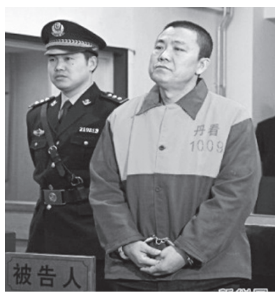
图:沈阳市检察院原检察长张东阳近日被判无期徒刑。