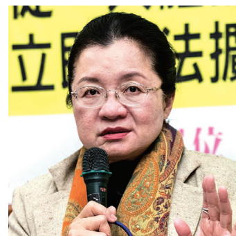
图:立委田秋堇表力促台湾立法，防止台湾人在不知情下去中国掠夺了政治犯、良心犯、法轮功学员的器官。

立委田秋堇也表示：“目前台湾有八千多人等待器官捐赠，盼扩大器捐认定、禁止旅游移植器官的《人体器官移植条例》修法能尽速通过，不要再拖延。这是一个挽救生命、保护生命的立法，是防止台湾人在不知情下，去中国掠夺了政治犯、良心犯、法轮功学员器官的立法。”