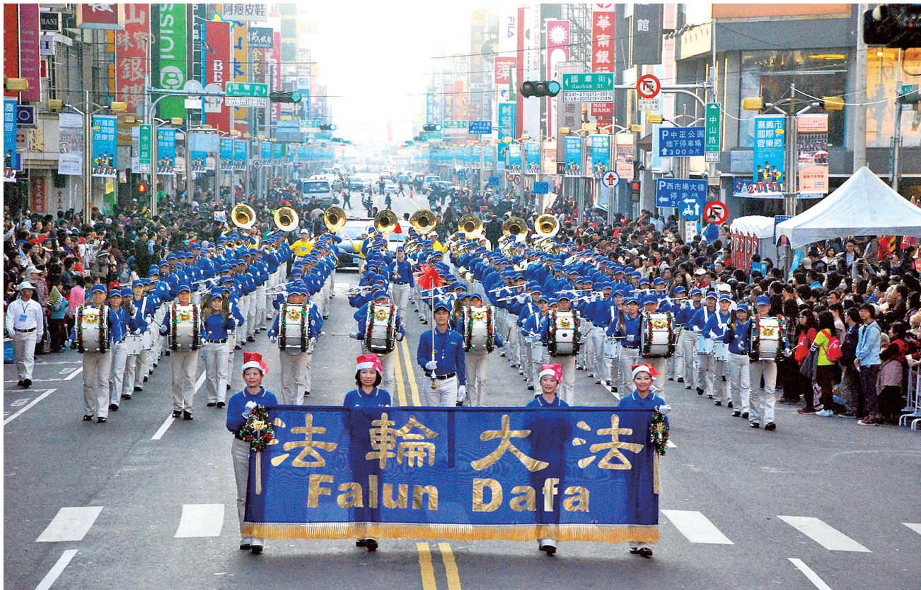
图：法轮功天国乐团参加了国际管乐节踩街演奏，壮观整齐的队伍赢得嘉义市民的热烈欢迎。

行进中除了演奏“法轮大法好”、“送宝”、“佛恩圣乐”外，也演奏了圣诞节的曲子“普世欢腾”，以及代表台湾