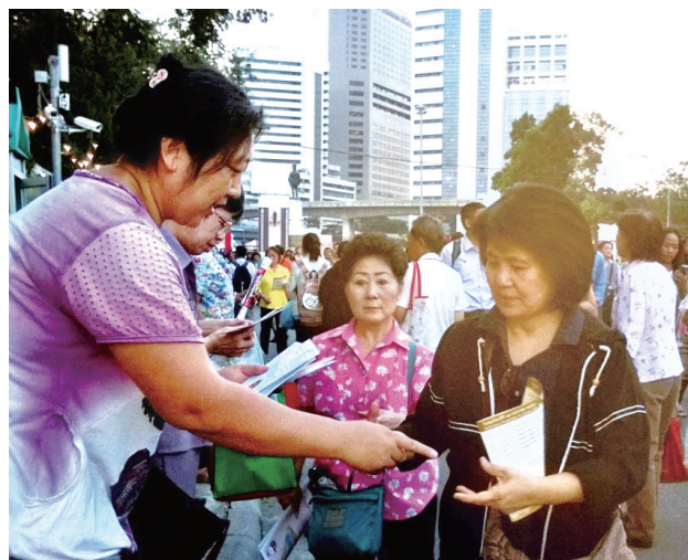
图：民众阅读、接受法轮功学员发放的真相资料。

拿取真相资料的人非常多，法轮功学员忙得甚至头都来不及抬，只要一停顿，立刻有无数只手伸过来要。有的市民和游客对法轮功已有所了解，接