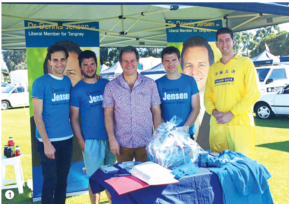
图1: 联邦国会议员Dennis Jensen (中)。