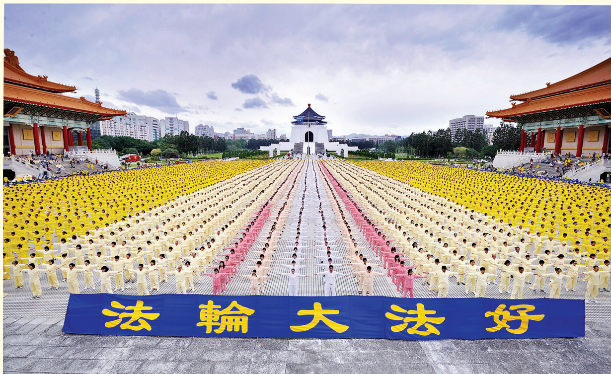
图：2011年11月26日，7500多名法轮功学员在台北自由广场集体炼功。

法轮大法，又称法轮功，是性命双修的佛家上乘修炼大法，由李洪志先生1992年5月从中国大陆传出，现在已经洪传到全世界120多