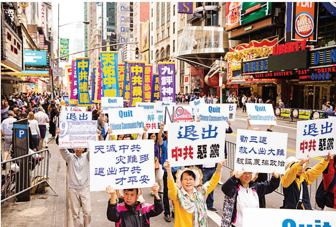
图：八千多名法轮功学员举行横贯曼哈顿市中心的盛大游行。