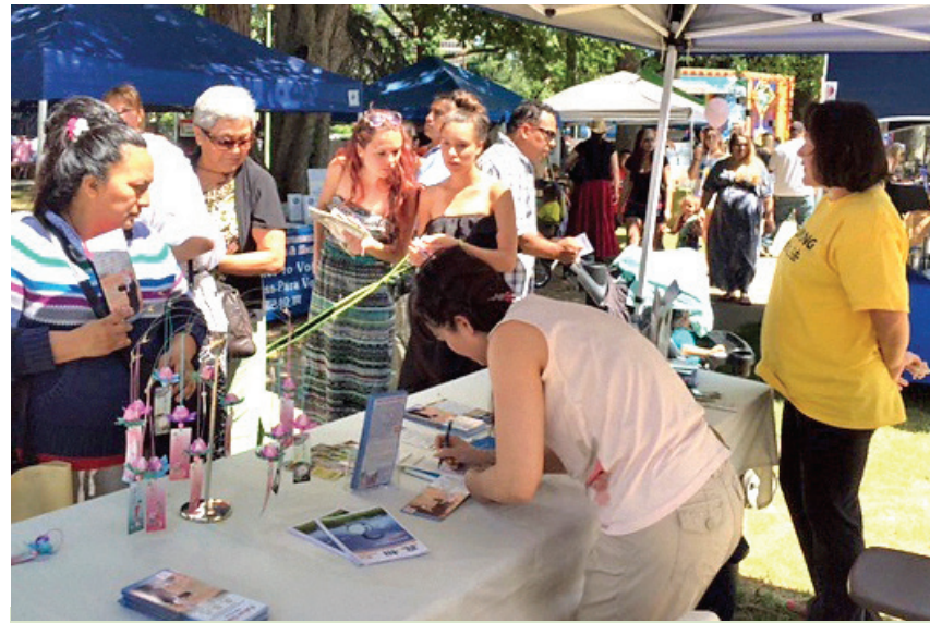
图：加州首府沙加緬度“地球日”，民众索取法轮功真相资料。

胡议员从SBS播放的这个节目中还看到了一些新的证据，他说：“我相信活摘人体器官的罪行的确正在中国发生，而且，如此骇人的罪行不仅仅是个人犯罪行为，而是有中共政府参与其中！”