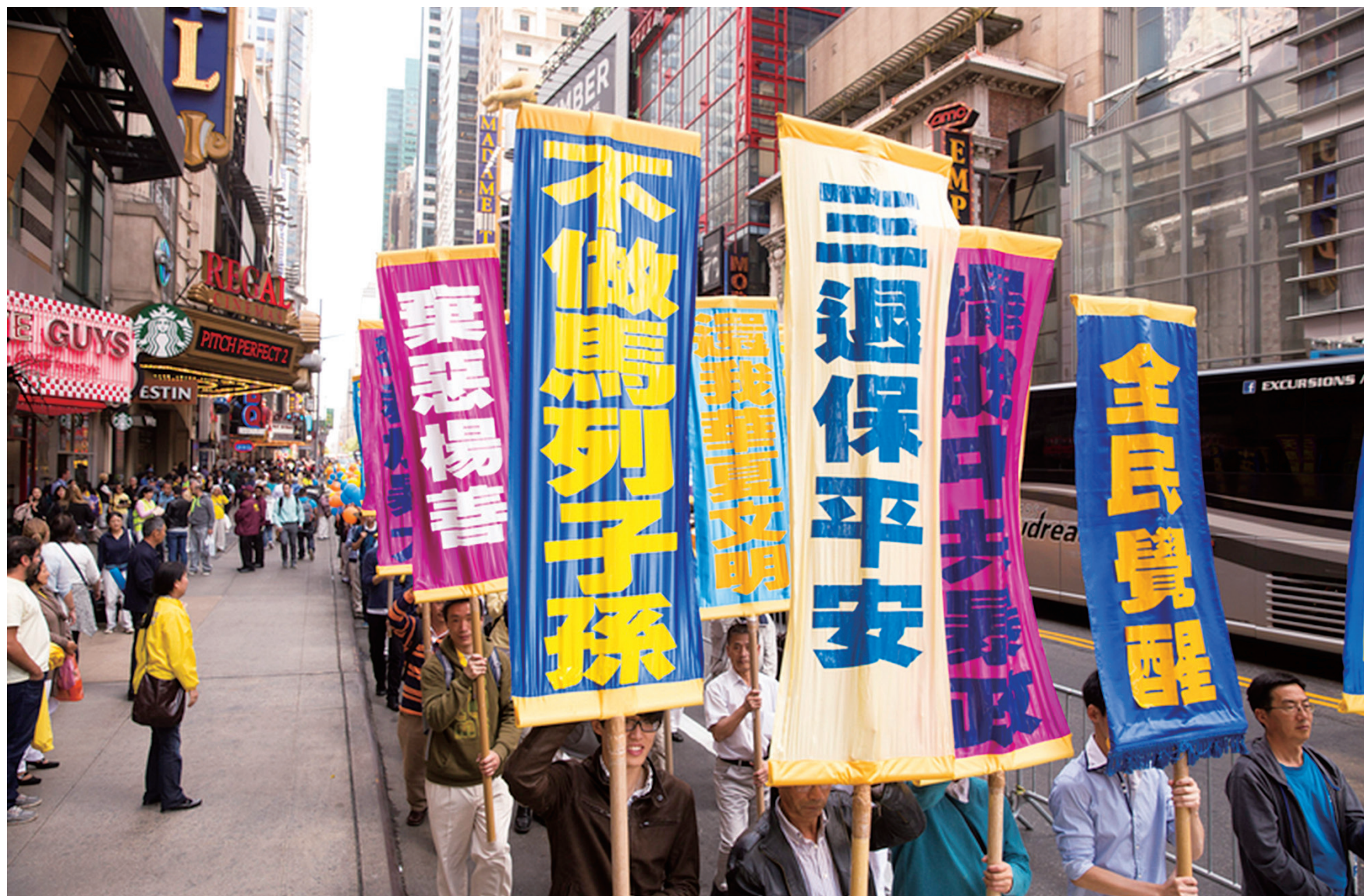
图:在美国纽约曼哈顿,来自全球50多个国家、200多地区的部分法轮功学员约8千多人声援2亿中国人退出中共组织。