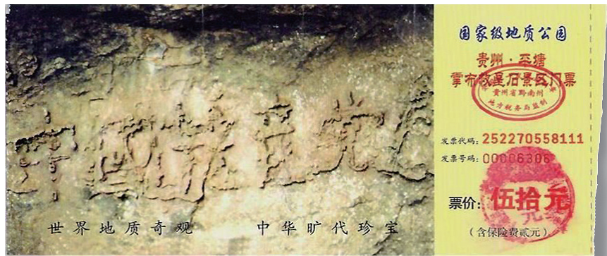
图:贵州省将平塘县藏字石景观建成国家级地质公园,图为公园门票,其中大石头上天然形成“中国共产党亡”六个大字历历可观。

细想想,发誓随时准备为中共牺牲一切?!多么恶毒的誓言?当然多数人并不愿真的为之“牺牲一切”。反过来讲,中国人自古重信义,言而有信是一个正常人的道德底线,一个连发誓都不当回事的人,当