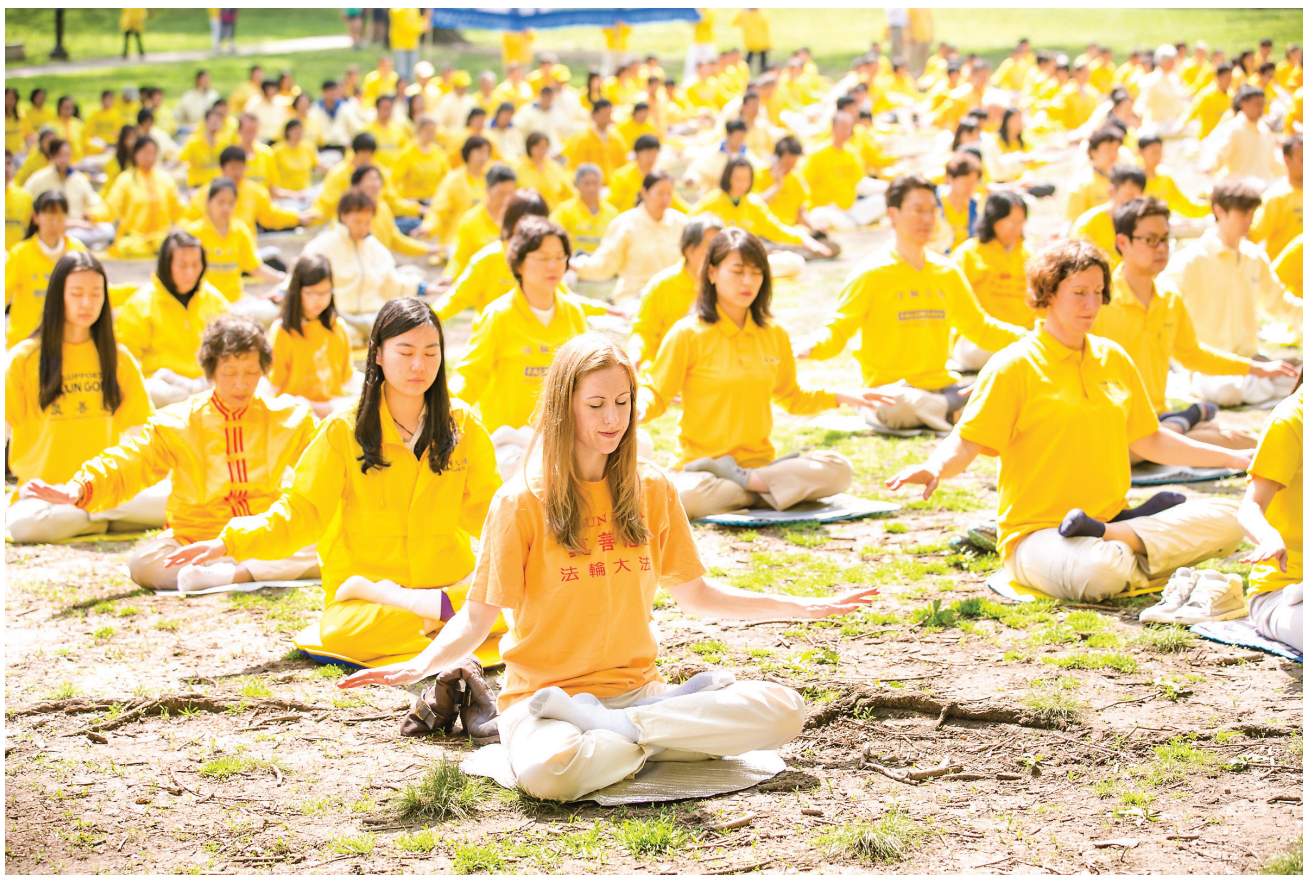
图：2015年5月10日，纽约部分法轮功学员在中央公园集体炼功。

在明慧丛书《绝处逢生》收集的80多个故事中，我们可以看到各种人罹患顽疾和绝症的悲凉故事。幸运的是，他们修炼法轮功之后，都得以绝处逢生，开始了身心健康的修炼生涯。愿被病痛逼到绝路上的朋友，能够受益于此书。