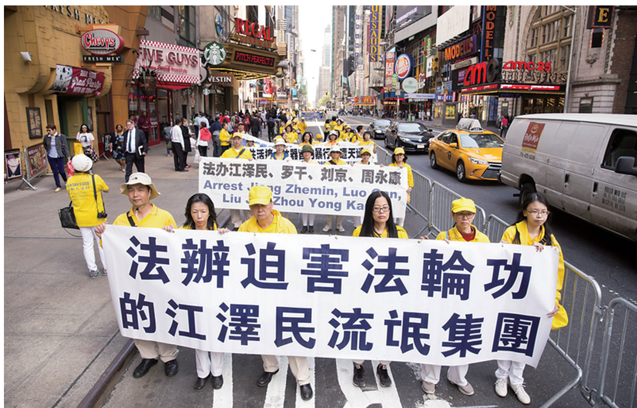
图：5月15日，八千多法轮功学员齐聚纽约市曼哈顿“停止迫害法轮功”，严惩江泽民犯罪集团。

1999年7月，纽伦堡审判的历史教训刚刚过去五十多年，中共独裁小丑江泽民由于妒嫉法轮功创始人李洪志先生