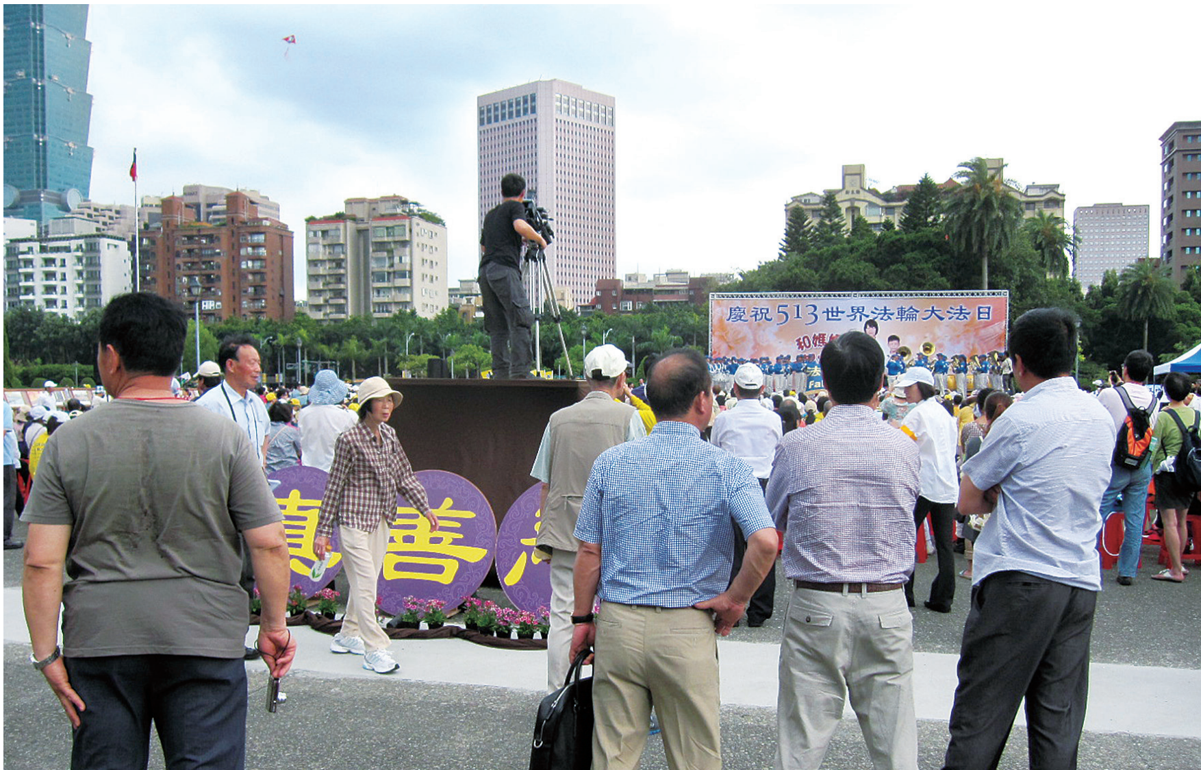
图:台北千名法轮大法学员,五月三日在国父纪念馆前广场举办“庆祝五一三世界法轮大法日”活动,法轮功学员进行功法表演。有的民众情不自禁地站在法轮功学员旁边自己学起了功法,有的大陆游客流连忘返驻足许久舍不得离去。