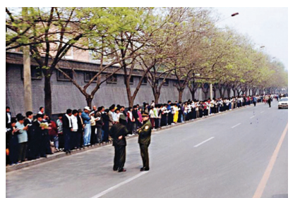
图:1999年逾万名法轮功学员和平上访。照片显示,上访群众静静地等在路边等待,没有“围”中南海,更没有“冲击”。