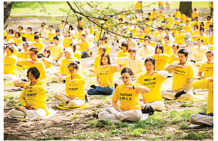
图：法轮功修炼要求重德修心，按“真、善、忍”指导日常生活，在道德普遍提升的同时，法病健身有着神奇效果。现在法轮功已经洪传到全世界一百多个国家，吸引了超过一亿人修炼。图为纽约中央公园，法轮功学员集体炼功。