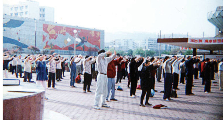
图：迫害前，1998年重庆法轮功学员集体炼功。