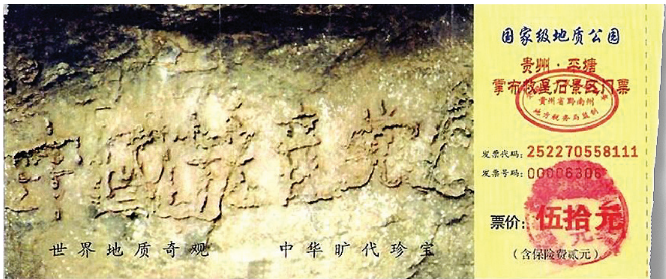
图:贵州省将平塘县藏字石景观建成国家级地质公园,图为公园门票,其中大石头上天然形成“中国共产党亡”六个大字历历可见。

天灭中共,作为中共的一分子,所有加入其党团组织的人,都会因此而受到牵连,退出它的一切组织,才可保平安。退与不退只在一念之间,结果却是天壤之别。愿您及早退出中共的党团组织(三退),为您生命的未来做出明智的选择!