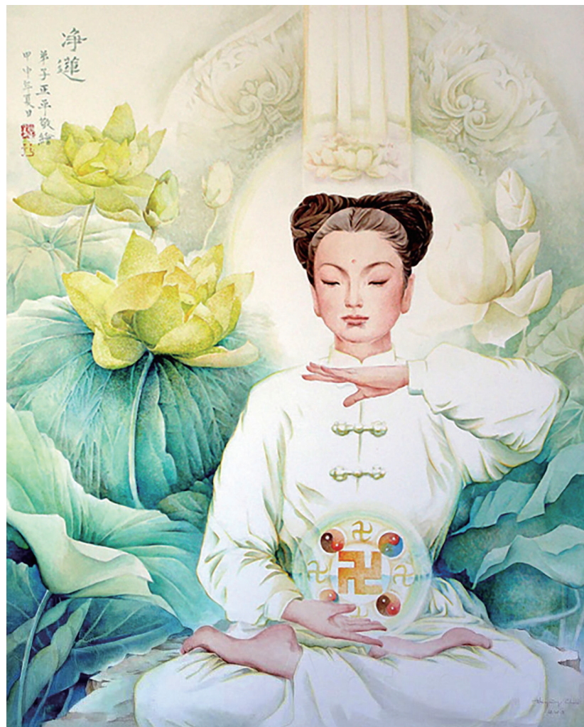
图：真善忍美展作品《净莲》。

居，开始独立生活。我勤奋工作，长年维持最低生活水平，最后建立起了自己的事业。不过，我的心一直在寻找着什么，但我不知道那是什么。我跑去报名参加了一种心灵疗法课程，但并没有什么成效。