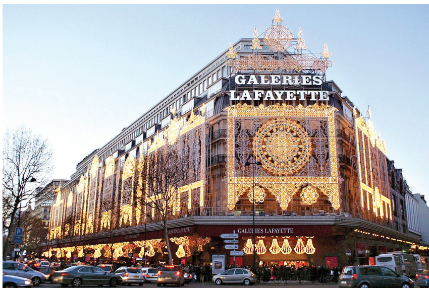
图:巴黎著名老店拉菲耶大商场

字石”上的“中国共产党亡”,有时还把这块大石头的照片拿给大陆游客看。中共灭亡,这是天意。