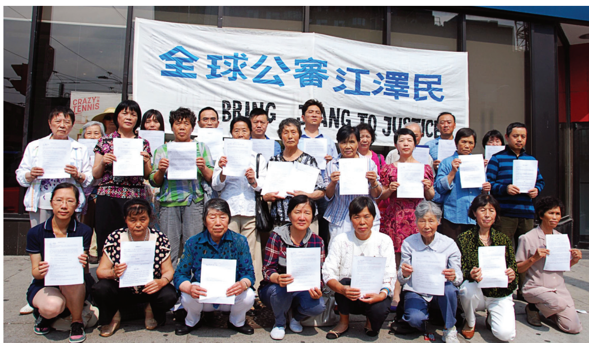
图：加拿大多伦多部分对江泽民提出控告的法轮功学员合影。