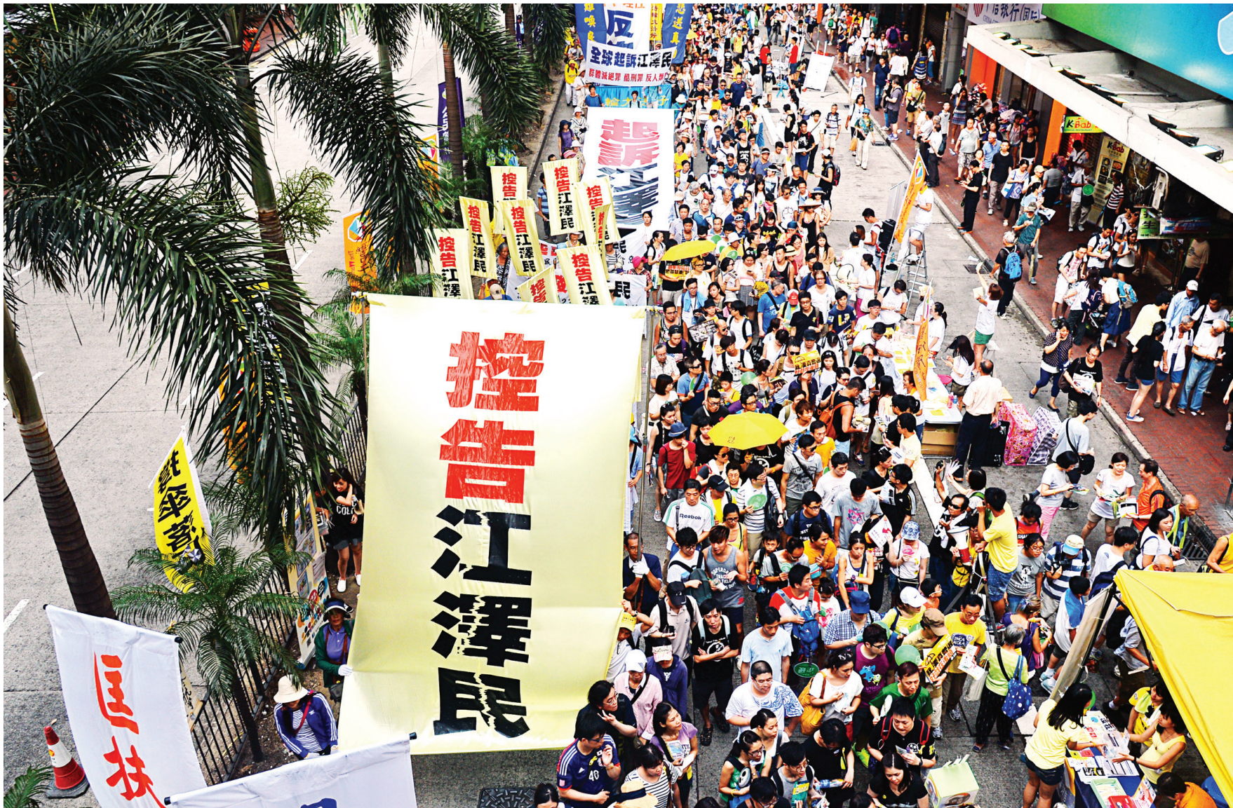
图: 从今年5月以来, 全球控告江泽民大潮迅猛兴起, 图为7月1日香港追求民主人权大游行, 游行队伍中打出诉江标语。

近几日, 河北、湖南、吉林、天津、陕西等地反馈, 有当地市、县级 610、综治办、