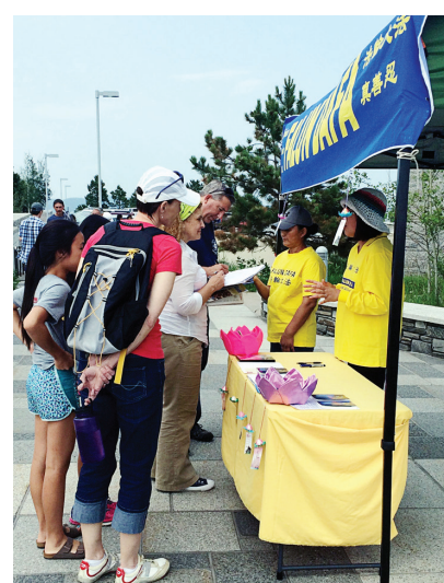
图：美国南达科达州总统山的游客了解真相后，纷纷签名支持法轮功学员反迫害。

一个年轻人听完真相后说：“我相信活摘器官是事实。”他签了名，向停车场走去。过了一会儿他又回来，拿着一瓶矿泉水，用双手递给学员后才急匆匆地离去。