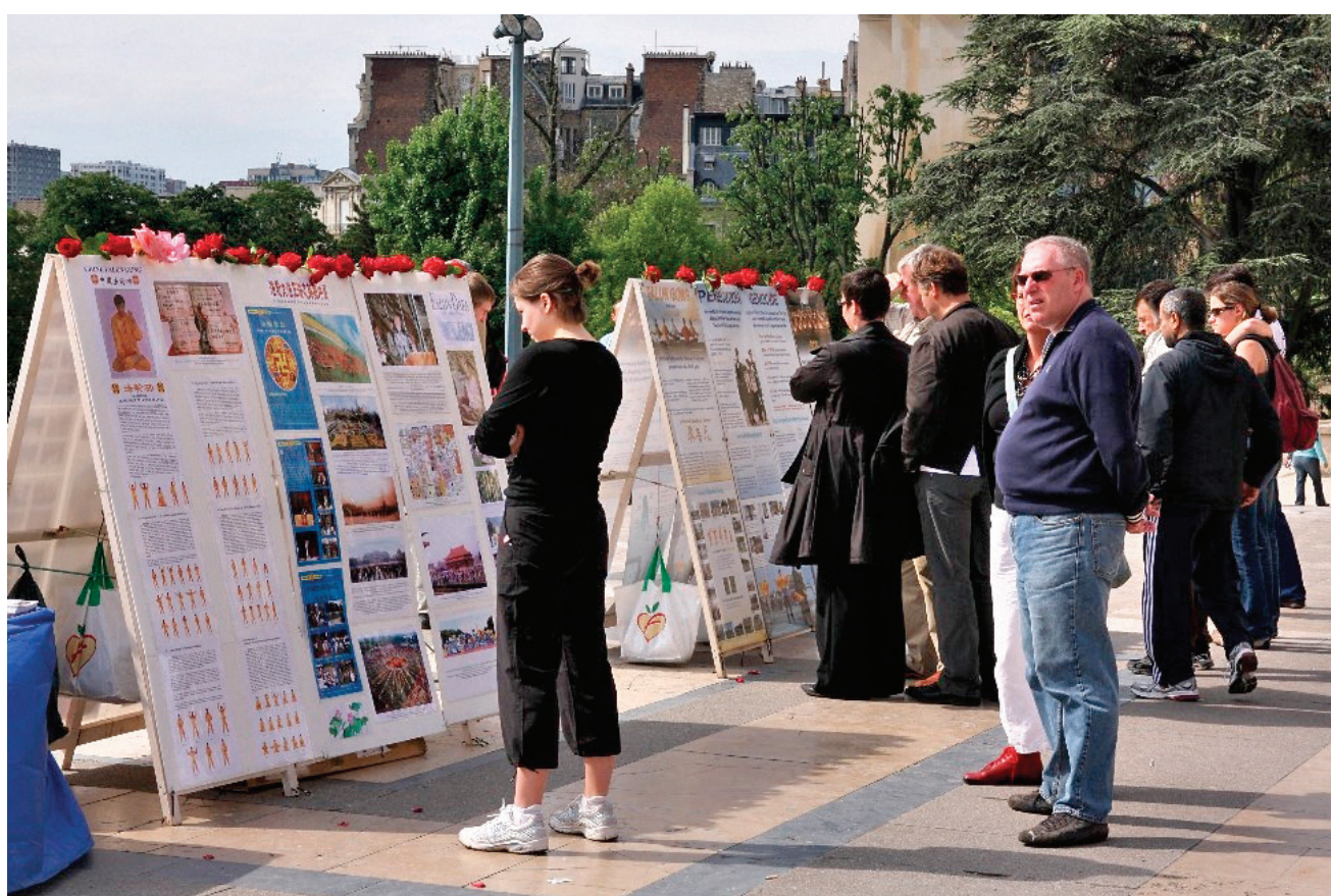
图：法国民众观看法轮功学员设立真相展板

我曾问过在一个在中国生活过很多年并讲着一口流利北京话的美国朋友：“你好像很想再回到中国，你是不是很喜欢中国？”我以为他会肯定说“当然”，然而他没有。他说：“确切地说，我喜欢的是中国的语言、中国的文化、中国的风景和我结识的一些中国朋友，当然还有很多很多，但都不是你们中国人概念中的‘中国’，因为我发现中国人所说的‘中国’，里面加入了太多个人的虚荣和政治因素或者说共产党及政府的因素”。我于是问道：“你为什么这么想？”他坦率地告诉我：“我接触过很多中国人，我觉得他们中有些人并不真心喜欢或关心中国的文化或中国的事，但他们有一种强烈的维护‘中国’的感情，而有时维护的是很坏的东西也不在乎，其实喜欢什么并不等于连不好的也要喜欢和维护。就像我喜欢美国，不代表我不能批评总统和政府或必须维护他们所做的一切，总统或政府和美国也不是等同的概念。如果我很喜欢维护美国那些不好的事，而对真正如何纠正不好的事漠不关心，我不能说我真心想喜欢美国或爱国。可能说爱自己更恰当，因为我对它的关心和维护只与个人的感情和虚荣有关”。我惊讶于这位美国朋友的见解，这让我联想起很多中国人，一方面对发生在中国的事漠不关心，一方面却有着高涨的“爱国”情绪。当