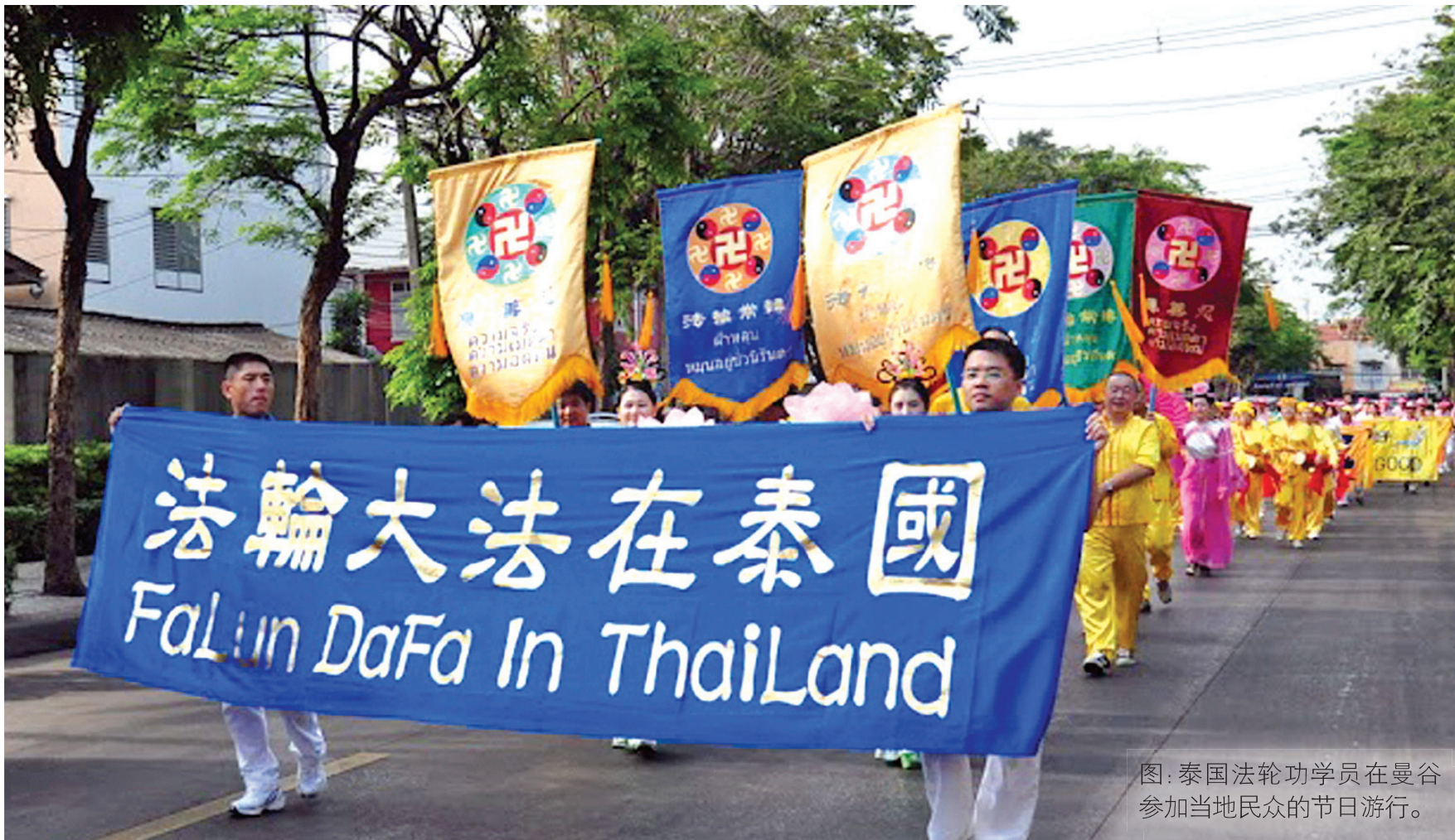
图：泰国法轮功学员在曼谷参加当地民众的节日游行。

2015年8月4日，法轮功学员接泰国最高行政法院通知，并前往听取最终裁决。法庭上，内务部官员辩称，批准该学会将表明泰国支持法轮功，会影响与中国的关系。法轮功学员认为，地方法院拒绝法轮功注册申请的决定是受中共歪曲法轮功真相的影响；法轮功以“真、善、忍”为精神指导，是提高道德，有益身心健康的功法。