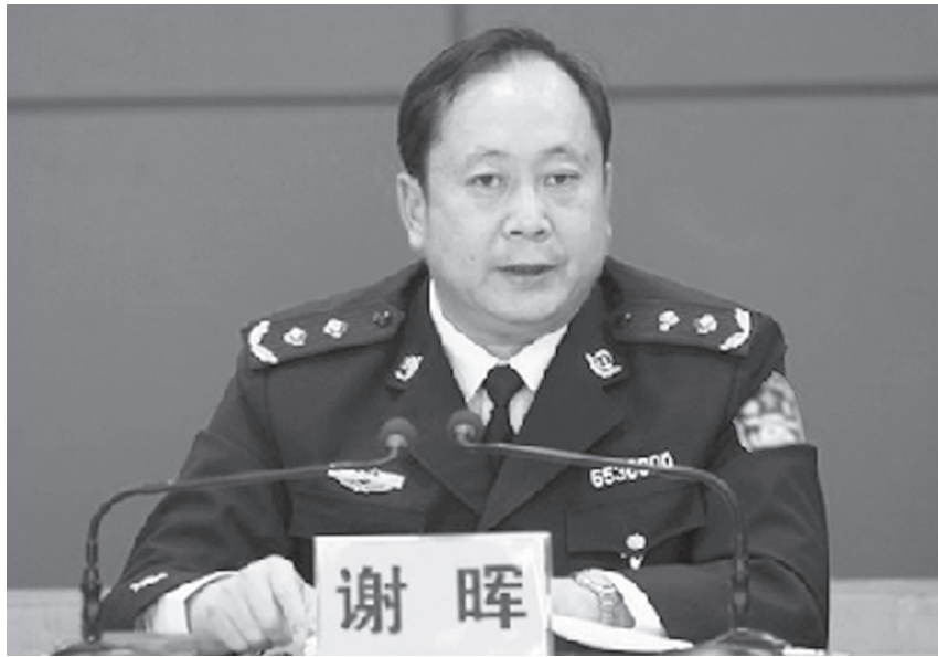
图:新疆公安厅副厅长谢晖是新疆地区迫害法轮功的主要责任人,今年7月遭恶报落马。

体户。一九九九年十月因上访为法轮功说公道话,被非法劳教一年半,在昌吉劳教所长期遭警察和犯人毒打,身体备受摧残,于二零零一年八月离开人世。