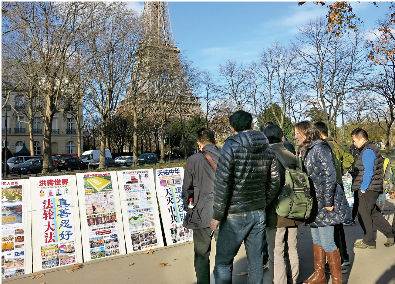
图:大陆游客在巴黎埃菲尔铁塔下观看真相展板。