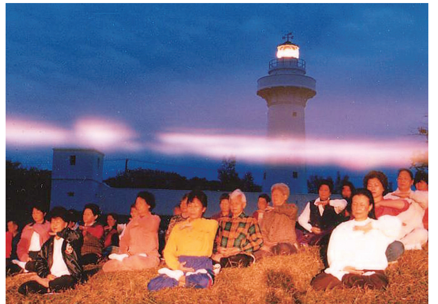
图：在台湾屏东鹅銮鼻灯塔前炼功场上空的能量场

屏东地区位居台湾之最南端，最南端有一座高高矗立着的鹅銮鼻灯塔，照亮了太平洋、巴士海峡、台湾海峡上往来的船只，灯塔四周景色壮丽，是极具特色的屏东地标。