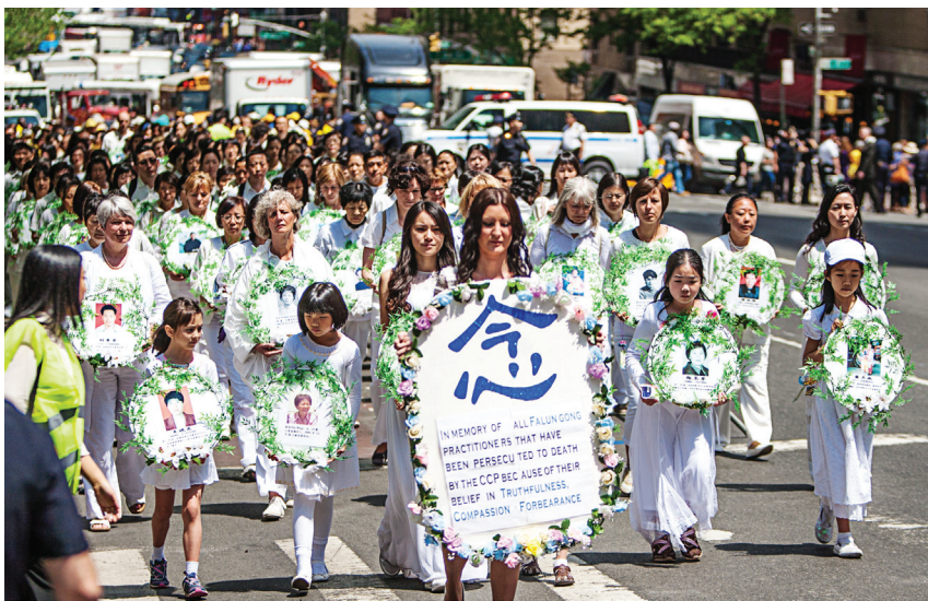
图:海外法轮功学员手持被迫害致死的中国大陆法轮功学员的遗照，呼吁停止迫害。

1999年7.20以来，通过民间途径能够传出消息的已有3888名法轮功学员被迫害致