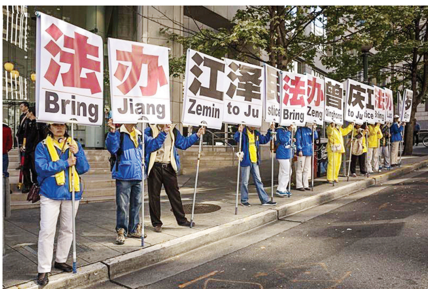
图:法轮功学员要求法办江泽民和曾庆红。

路透社报道说,在西雅图市中心,支持法轮功的人群说,他们在中国受到迫害。他们手持横幅反对活摘器官行