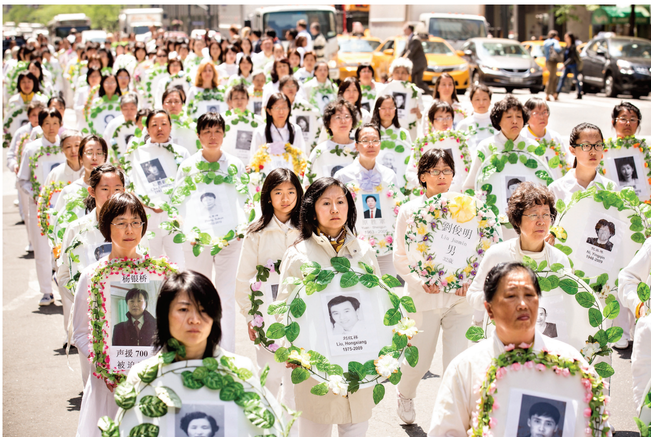
图: 海外法轮功学员手持被迫害致死的大陆法轮功学员的遗照, 呼吁停止迫害。