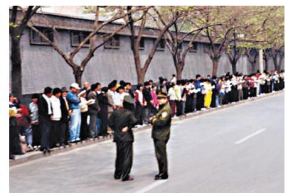
图：1999年逾万名法轮功学员和平上访。现场照片显示，上访群众静静地路边看书等待，没有“围”中南海，更没有“冲击”。