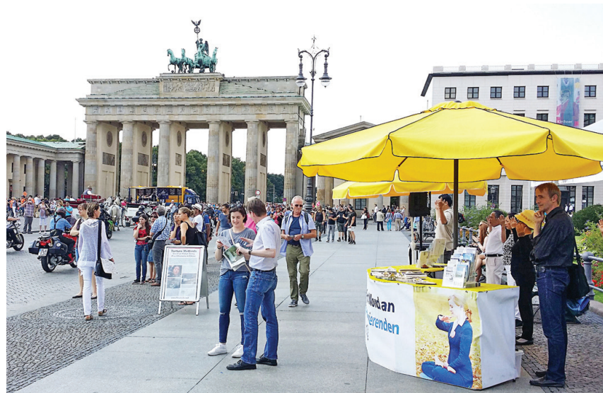
图:勃兰登堡门前法轮功学员炼功、讲真相。

祝法轮功学员们成功。不少游客停留在真相横幅、展台、展板和被迫害致死的大法弟子遗像前,仔细地观看,并向学员了解详情。有的人看了酷刑展板,马上就流泪了,急切地询问我们能做什么,听说可以为反迫害签字,就马上走过来签了字。特别是中共活摘法轮功学员器官的恶行引起民众的关注和震惊。