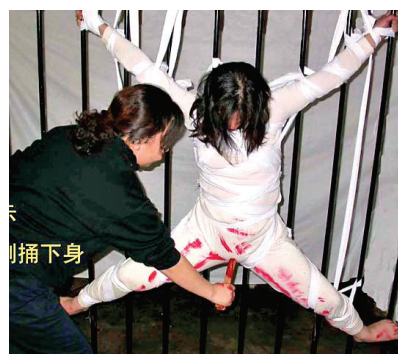
图: 中共酷刑演示: 恶徒用鞋刷、牙刷捅刷法轮功女学员的阴道。

二零零二年中国新年过后, 大连教养院警察对我进行疯狂迫害, 强迫我放弃信仰法轮大法。近六十岁的我被恶人把手脚伸展开捆绑起来, 那些被警察指使利用的犯人将很长的棒子插入我的阴道导致严重的感染, 阴道被刷子和椅背的尖部捅烂。