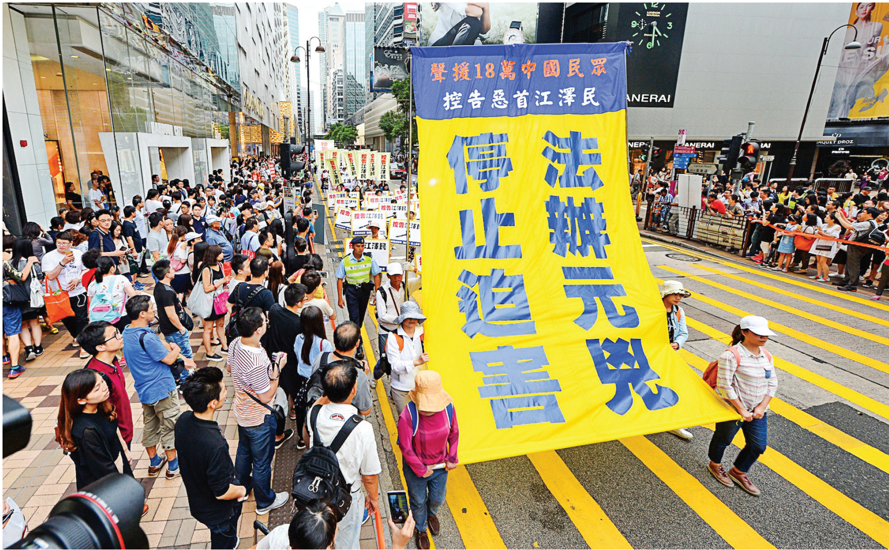
图:十月一日,香港法轮功学员举行“法办元凶、停止迫害”的集会游行,途中许多大陆游客被游行的场面震撼。

卢女士还分享了一个小故事:“我发报时,有一个妈妈先是不愿,当听说是法轮功真相报时,她马上回说:‘这个要看,