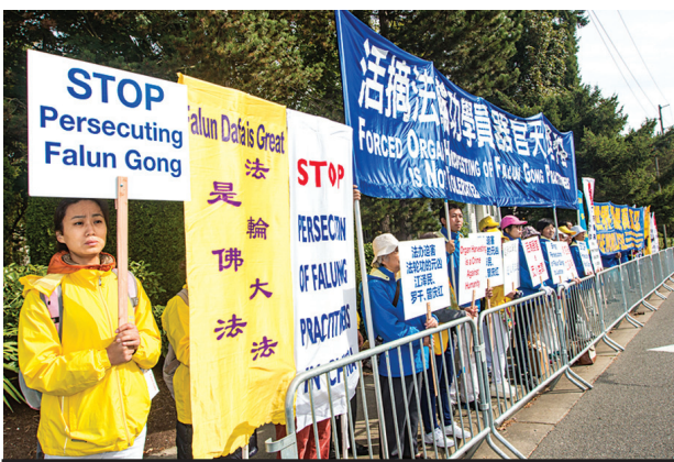
图:法轮功学员要求停止迫害,将迫害的元凶江泽民绳之以法。

西雅图电视台King5报导,见惯了暴力抗议的西雅图,这次迎来了一群安静的抗议者。连续两天,几十名法轮功学员都在和平抗议。