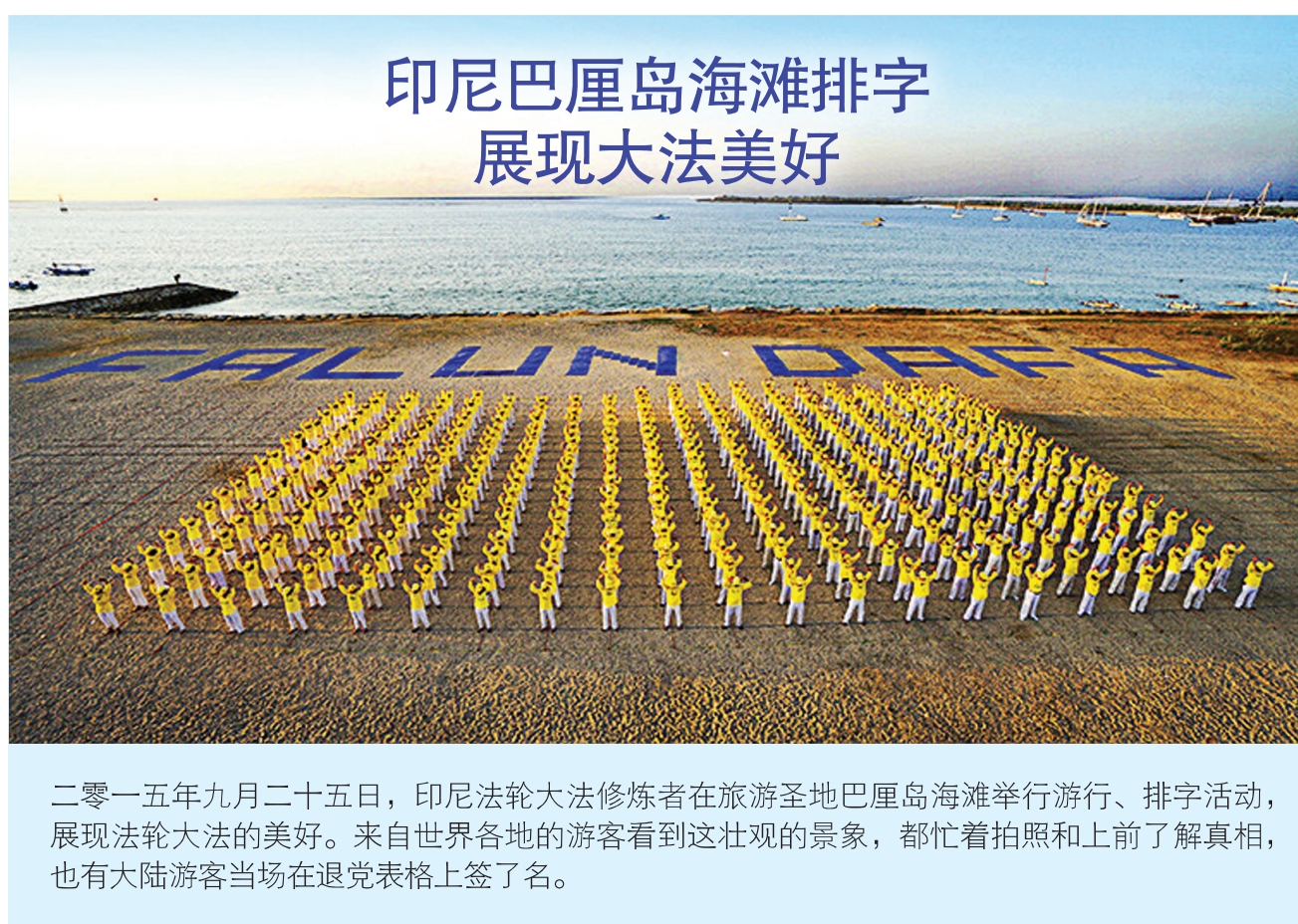
二零一五年九月二十五日,印尼法轮大法修炼者在旅游圣地巴厘岛海滩举行游行、排字活动,展现法轮大法的美好。来自世界各地的游客看到这壮观的景象,都忙着拍照和上前了解真相,也有大陆游客当场在退党表格上签了名。

前保卫民主基金会研究员葛特曼是中国问题专家。迫害发生时他正在中国。葛特曼认为,有五十万到一百万的法轮功学员被关押在拘留所。通过对比中共处决犯人的数量和被活摘器官的人数,他估计在二零零零年至二零零八年,有六万五千名法轮功学员被活摘器官而死亡。