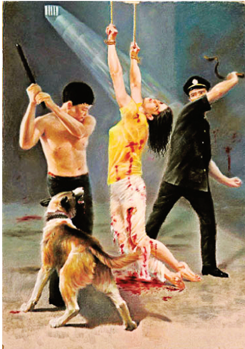
图：描绘法轮功学员在狱中遭受酷刑的油画。

五月二十六日晚，恶警把她铐在野外，用毒蛇缠在她脖子上三次。又把壁虎放在身上，电棍追着壁虎电，直到把壁虎电死。警察还故意无耻地说：“我电壁虎呢，没电你。”