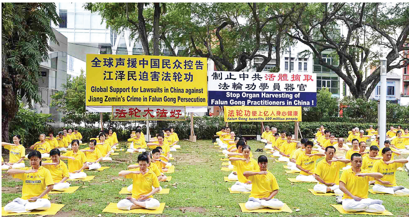
图: 中共领导人习近平访问新加坡，法轮功学员在芳邻公园集会、炼功、征签，要求法办元凶江泽民，结束持续了十六年的迫害。

功学员讲真相的活动揭露了中共的迫害，让民众了解到真相。他出国旅游，在香港和马来西亚等地都遇到过在景点讲真相的法轮功学员。