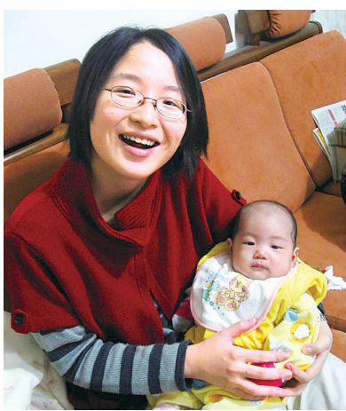
个让她痛不欲生的类风湿性关节炎的资料，然后飞往大峡谷。