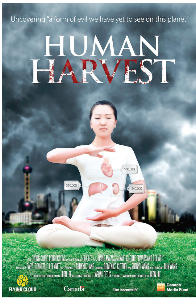
图: 获奖纪录片《活摘》(Human Harvest: China's illegal organ trade) 海报。

《活摘》纪录片让观众看到: 在中共政权下, 发生着血淋淋的非法人体器官贸易, 为了获得用于谋取暴利的用于移植的器官, 大量良心犯被杀害, 其中最主要的无辜受害者是被残酷迫害的法轮大法修炼者。而且是按需杀人, 发生的是活体强摘器官。