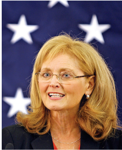
左图: 美国国会议员达纳·罗拉巴克 (Dana Rohrabacher)。中图: 美国国会议员罗伯特·皮廷格 (Robert Pittenger)。右图: 美国国际宗教自由委员会 (USCIRF) 委员、前主席卡翠娜·兰托斯·斯维特博士 (Katrina Lantos Swett)。