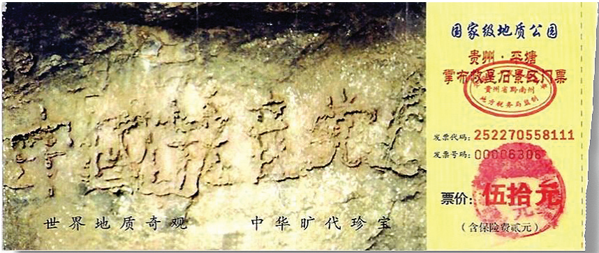
图: 贵州省将平塘县藏字石景观建成国家级地质公园, 图为公园门票, 其中大石头上天然形成“中国共产党亡”六个大字历历可观。

自2004年11月《九评共产党》在民间热传, 人们认清了中共谎言加暴力的邪恶本质, 由此引发了退出中共党、团、队 (三退) 大潮。现在有两亿多的中国同胞公开声明三退。他们为什么要退出中共的组织呢?