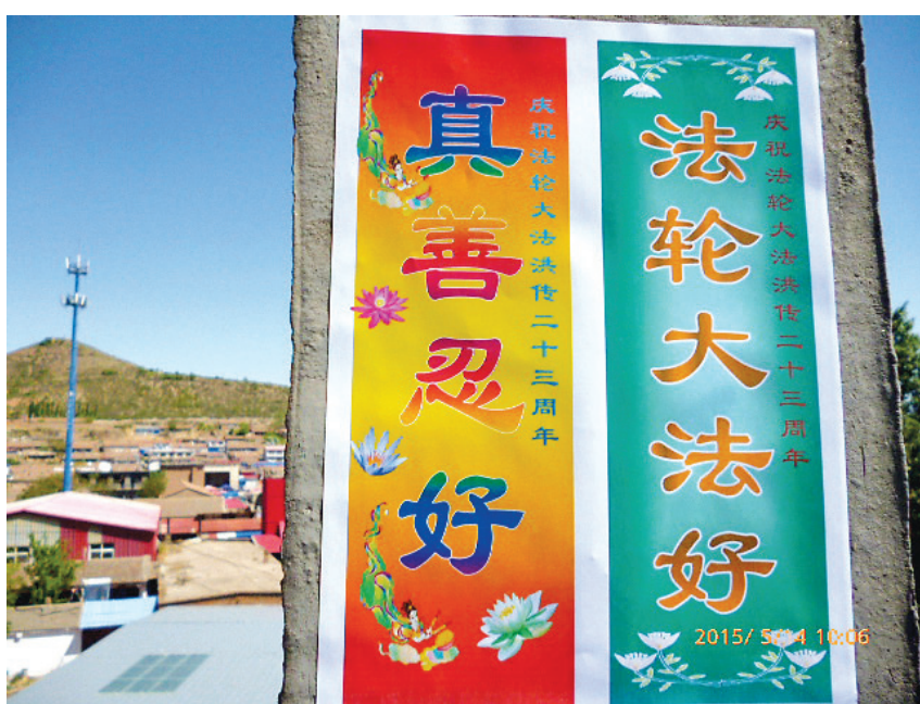
图：在塞外山城张家口出现的法轮大法好横幅

至今能够公开找到的取缔法轮功的唯一“法律依据”，是1999年7月22日，中共媒体公布的民政部《关于取缔法轮大法研究会的决定》和随后公安部依据这个决定而作的“六禁止”《通告》。众所周知，民政部和公安部是两个行政机构，越权发布这样的决定和通告是违宪、违法的，民政部取缔的也只是法轮大法研究会而不是法轮功，更何况这个“组