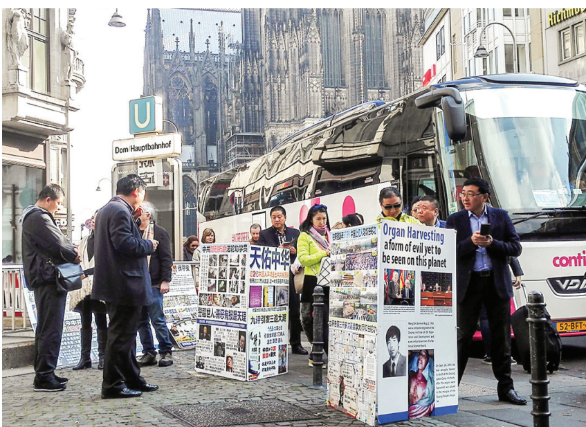
图: 法轮功学员在德国科隆大教堂（Cologne Cathedral, Germany）设立了真相点，传播真相。

一天下午科隆大教堂前来了一个学生团，有二十多人，其中一半的中国学生是大陆来的暑期交换生。一名大陆学生在展板前看了一会，然后对学员说：“我知道法轮功，我支持你们！看到法轮功被迫害我就生气，就着急！”他还说，