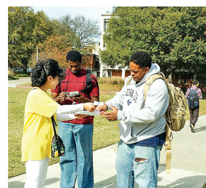
图: 美国亚特兰大学员在乔治亚理工学院校园讲真相劝三退。

人群里开始窃窃私语。学员说：“我之所以来这做退党义工，是真心希望我们同胞都能平安躲劫难，有个好的未来……”游客静静的听着，感动地看着学员。那个刚才质问学员拿钱的女士不住地说谢谢。开车之前，她和在场的游客基本都做了三退。