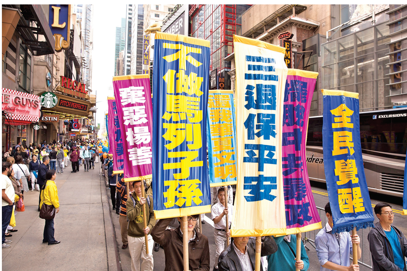
图：2015年5月15日，美国纽约举行声援二亿多中国人退出中共（党、团、队）大游行。

法轮功学员为他起了一个化名，帮他退出邪恶的党、团、队组织。他随口问道：“不知老天爷什么时候、用什么办法把它灭了？”法轮功学员肯定的回答：“具体哪一天说不准，但从现在开始，中共随时都可能灭亡，说来就来。至于老天爷用什么方式灭它，这个不敢妄下结论，但是，有个现象可以参考，因为江泽民犯罪集团对法轮功学员活摘器官等所犯下的反人类罪、群体灭绝