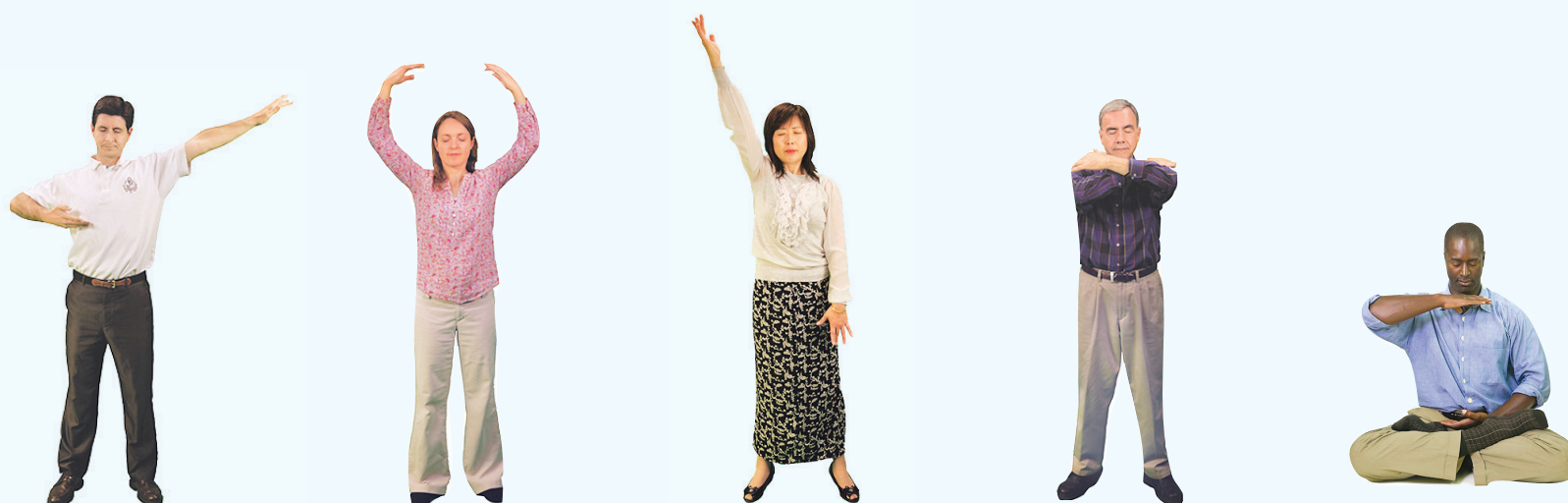
(一) 佛展千手法 (二) 法轮桩法 (三) 贯通两极法 (四) 法轮周天法 (五) 神通加持法

■ 全套法轮大法书籍、教功录像DVD和炼功音乐,均可在法轮大法网站免费阅读或者下载:www.FalunDafa.org