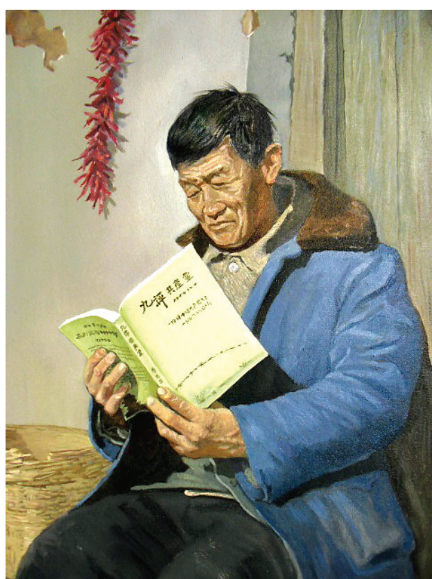
图：油画作品《惊醒》以中国农村现实生活为背景表现了一位乡亲在冬季的午后阅读《九评》的情景。

一日赶集，这个人又背着背篓去了，他果然听见了一个大法弟子在给别人讲真相，这名大法弟子讲完真相后，起身准备走，发现有人跟着她，立马警觉了。这个大法弟子转过身来大声对着这个人问道：“干什么？为什么跟着我！”原来就是这个背着背篓的老农，他不好意思的说：“哎呀，我看你给他们了一些资料，能给我一份吗？我也想看看，我都来了好几次了……”大法弟子当即愣住了，竟然是个主动找真相的人，可是今天的真相资料都发完了，于是大法弟答应回去