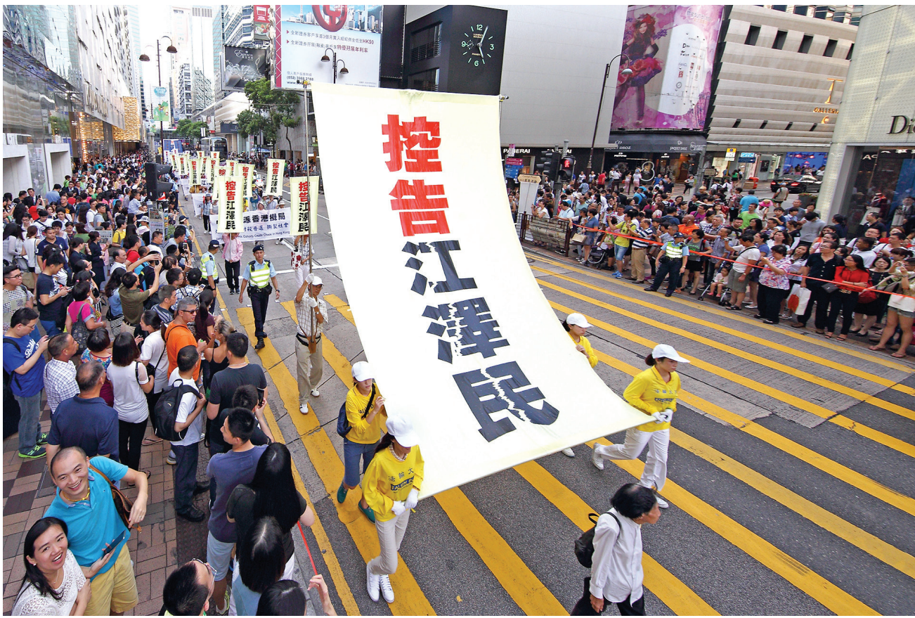
图:二零一五年七月十八日, 香港举行反迫害大游行, 声援全球控告江泽民, 吸引众多市民及大陆游客观看。

尽管被610非法组织、地区国保、警察拦截和骚扰, 法轮功学员和家属坚持不懈地通过邮寄、向官方网络电子投递方式, 将控告江泽民(诉