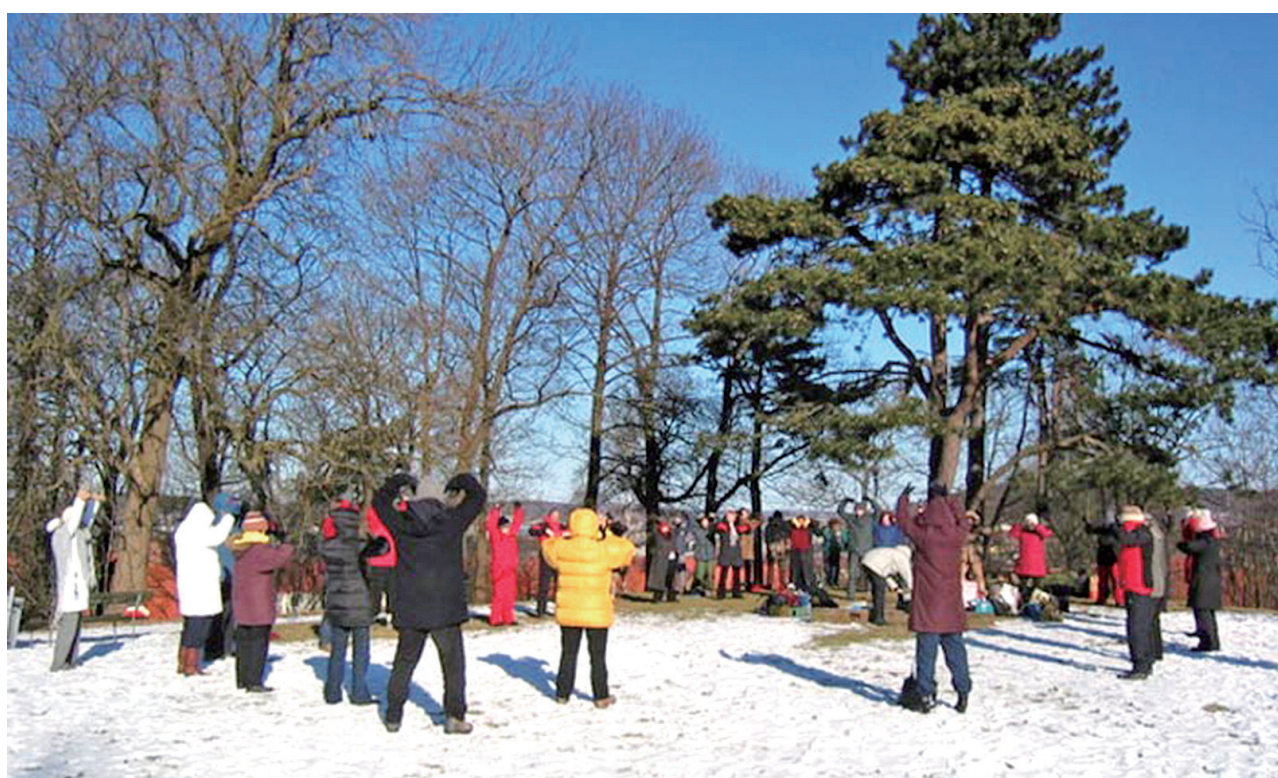
图：哥德堡法轮功学员在公园集体炼功。

(Ronald Franklin)：“在2014年的夏末，我被指引找到了法轮大法。那时我刚刚度过了80岁生日。从那时起我用更多的时间来炼功和读法轮大法的书籍。我的整个身体和心灵都在不断地发生着细致微妙的变化。我非常庆幸能得到法轮大法给予人类福分的一部分，也理解了法轮大法的意义，这是无法能用语言表达清楚的。衷心祝愿我们尊敬的师父新年快乐！”