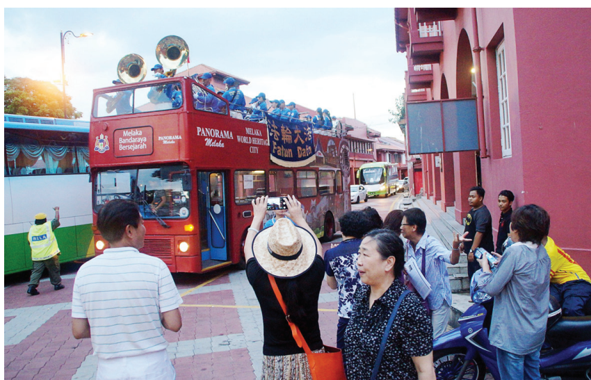
图:民众和游客看到天国乐团在荷兰红屋广场演奏,纷纷拍照、摄影留念。

正在荷兰红屋广场(The Stadthuys)观光的中国游客,看到天国乐团在两侧都挂了“法轮大法”横幅的双层巴士上演奏时感到十分惊喜,当中有一群中国游客,学员给他们送上的真相资料,他们都接