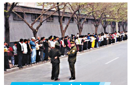
4.25历史真相 万人和平上访为啥

警察一看，赶紧说：“老爷子别生气，别生气……”两天后，警察打来电话，让家属去接老大爷的儿子回家。