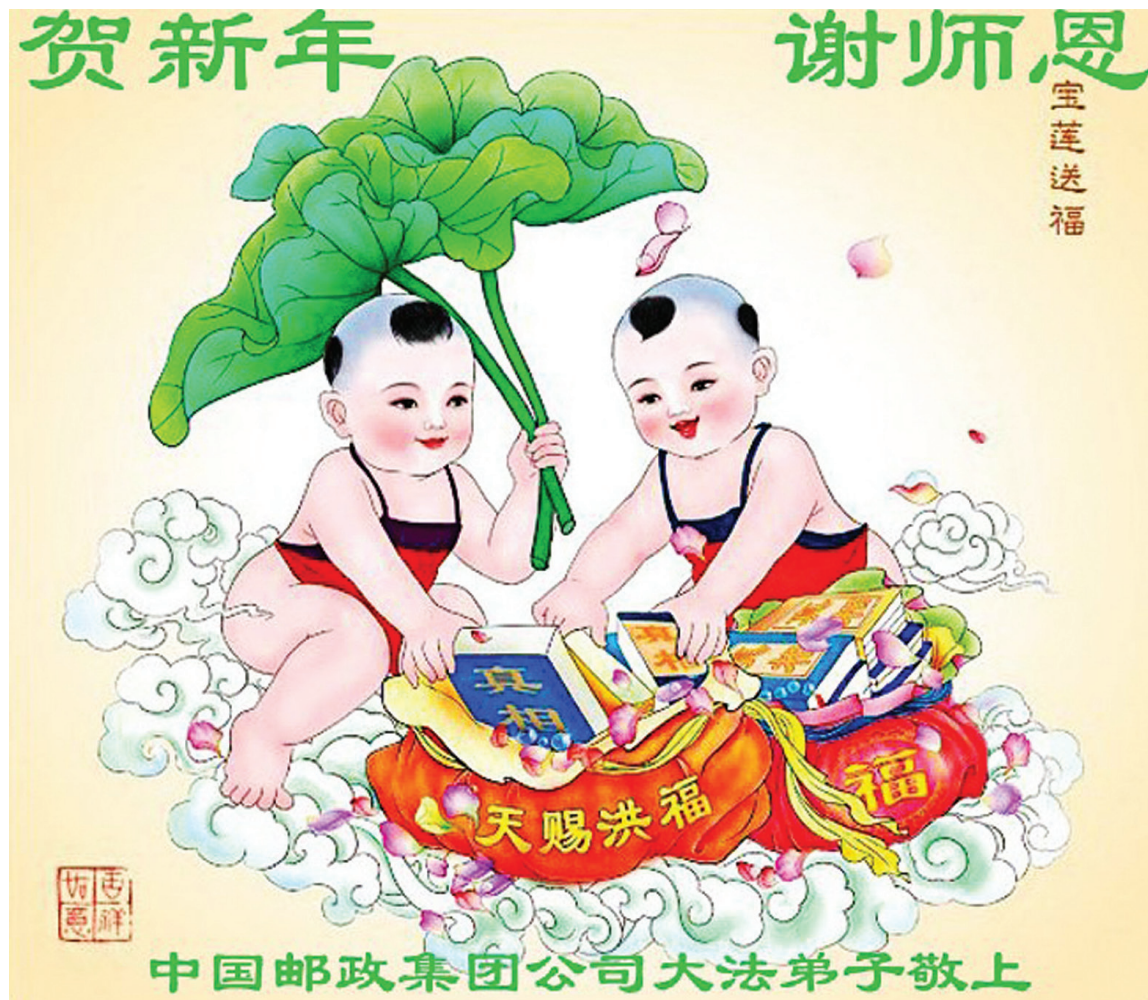
图：二零一六年新年之际，明慧网收到来自世界各地大法弟子及世人给李洪志先生的拜年贺卡，感谢大法的救度之恩。图为来自大陆的上万份贺卡之一。

的时间里，我都会在心里默念：“法轮大法好，真、善、忍好”，完全没有紧张的心理，带着很平和的心态答着一道道题目。那年，理科数学题目出得太过于新颖，很多同学都在考场上抓了瞎，而我却仍然能不慌不忙的、按部就班的做题。就这样，高考中我得到了超常的发挥，考出了高中来最好的名次，并顺利进入全国重点大学学习。