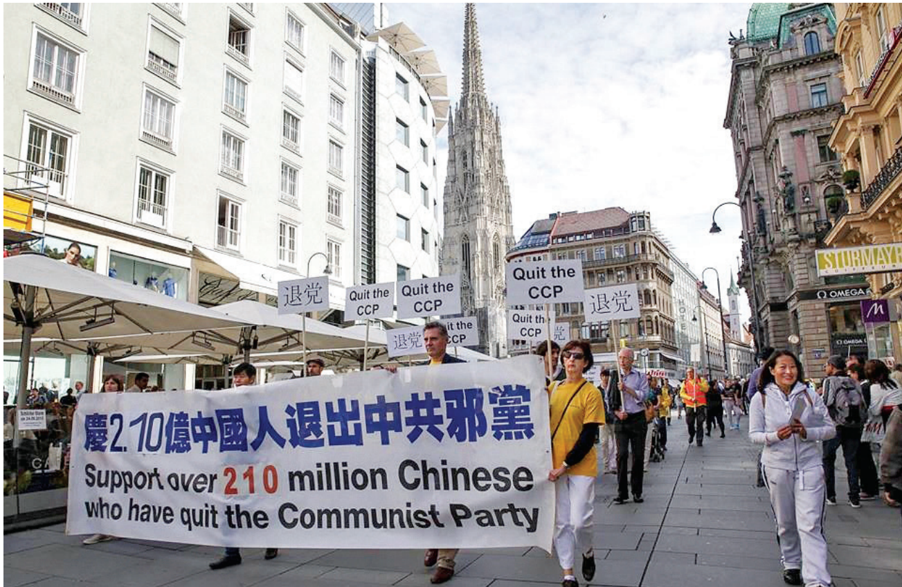
图：二零一五年九月二十二日，奥地利维也纳举行大游行，声援2.1亿中国人退出中共党、团、队组织。

给谁编造打倒的理由。炼法轮功的人按照真善忍要求自己，口碑非常好，中共找不到镇压的理由怎么办？就给法轮功造谣，其中编造了天安门“自焚”伪案。镜头里那几个人都是花钱雇来的，现在基本被灭口了。为激起民众对法轮功的仇恨，江泽民就用“自焚”无中生有构陷法轮功。