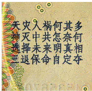
图：人民币上的真相短语。

夫，三、五千元“真相币”就都说换出去了。前几天，她刚要走进一家店铺，不远处就有一位男士喊她：“老太太！这边！”