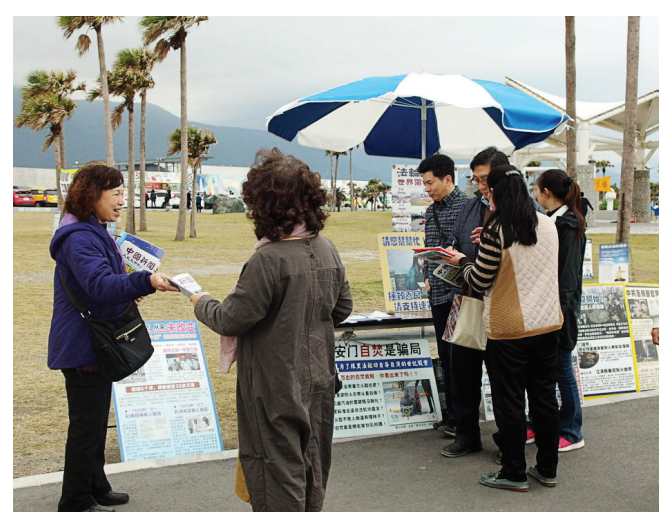
图：法轮功学员在台湾著名旅游景点七星潭设真相点向游客传播真相。