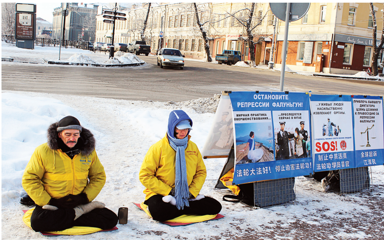
图：俄罗斯伊尔库茨克法轮功学员在中国领事馆对面抗议迫害，向民众讲真相。

二零一一年前举行的是单人抗议活动。因为按照俄罗斯法律，举行两人以上的抗议活动需要获得批准。而由于中国领事馆多次干扰，当时对于真相了解不多的当地政府不予批准。随着法轮功学员们不懈地讲真相，当地政府和警察逐渐确信，法轮功修炼者在按照俄罗斯宪法履行自己和平表达抗议的权利，是在做正义的事情。五年来学员们坚持在伊尔