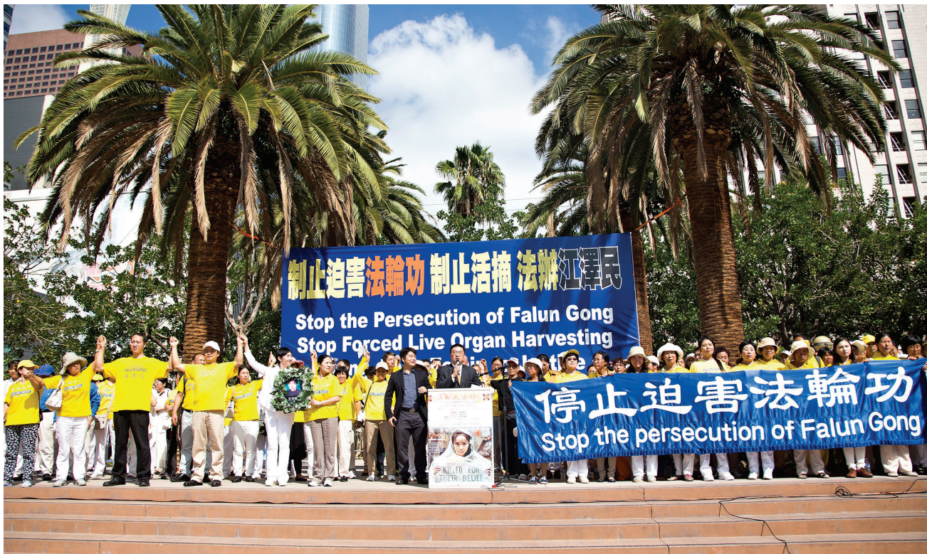
图:2015年10月15日，法轮功学员在洛杉矶市中心集会，要求立即停止迫害法轮功，制止活摘法轮功学员器官牟利的暴行，法办迫害元凶江泽民。