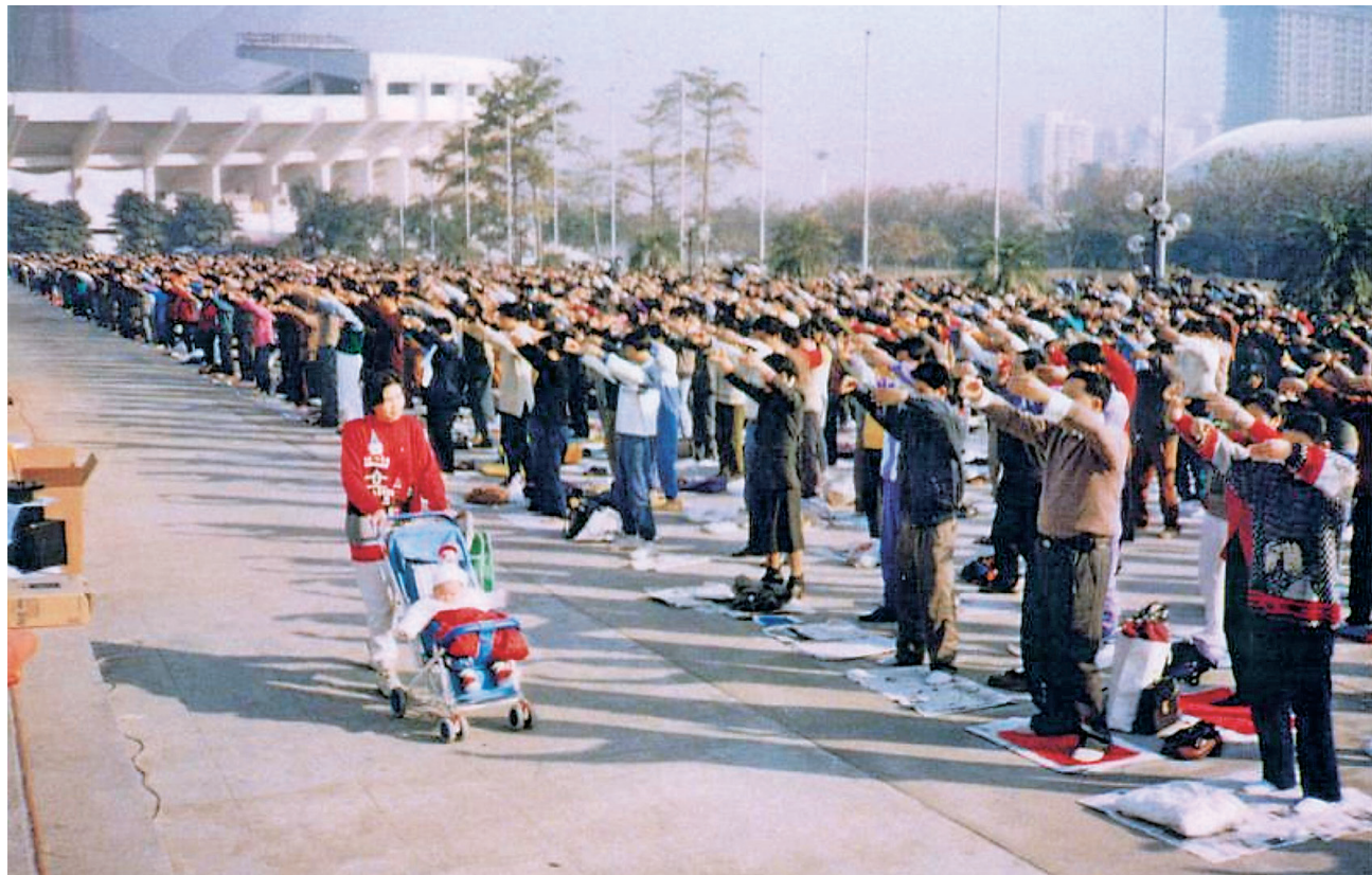
图: 迫害之前, 广州部分法轮功学员在天河体育中心集体炼功。

我姐的孩子八岁, 患脑炎脑子坏了, 姐让孩子也来参加法轮功学习班。孩子贪玩, 总摆弄东西, 我阻止她, 让她注意听。师父看了一眼, 亲切的说: 小孩儿就是贪玩的, 你不要管她, 她什么都落不下, 她该听的都听到了, 可能比大