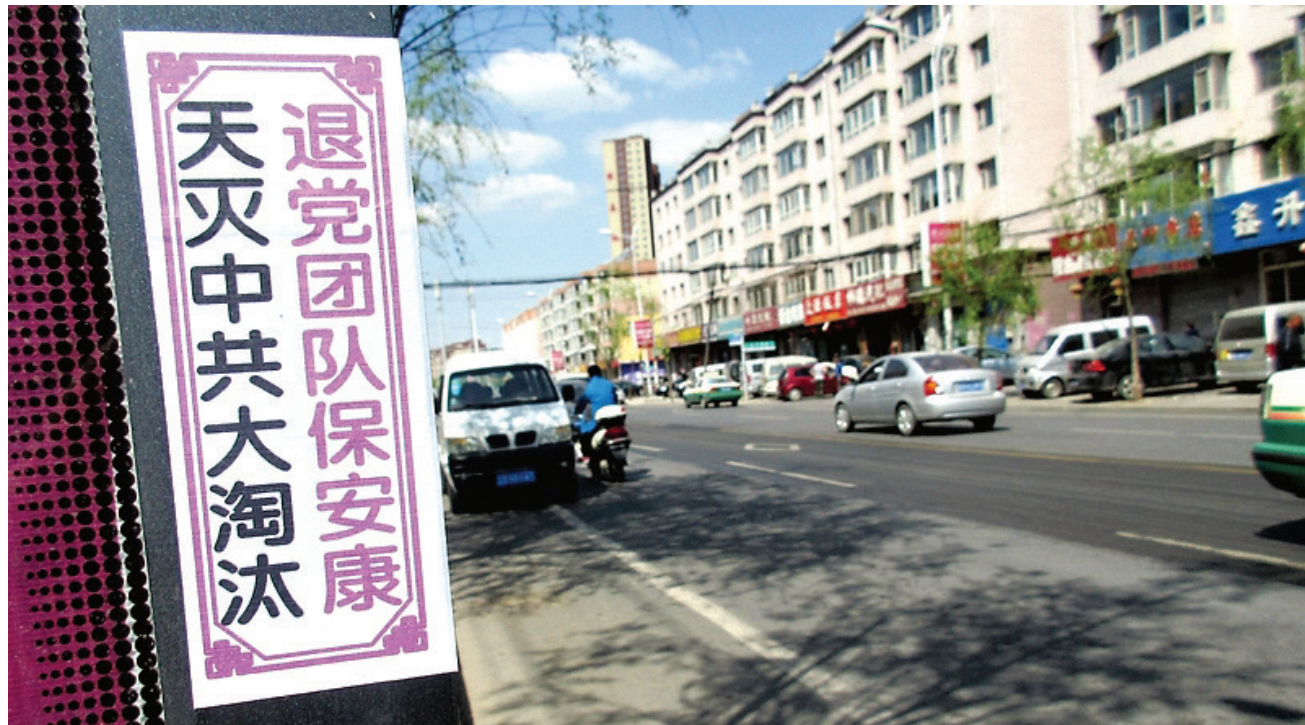
图：吉林某地大街上的退党标语。