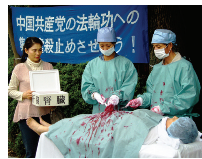
图:法轮功学员在东京曝光中共活摘器官酷刑。

孙鸿志,中共国家工商行政管理总局原副局长,2014年12月26日被调查;2015年1月29日被免职。孙任吉林省松原市委副书记、市长期间,对法轮功学员非法抓捕、判刑及迫害致死负有直接责任。