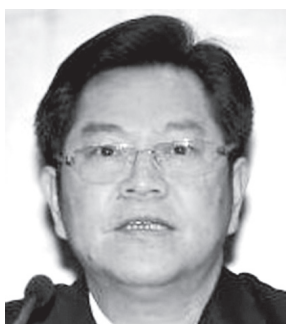
图:广东省副省长刘志庚涉嫌严重违纪被调查。