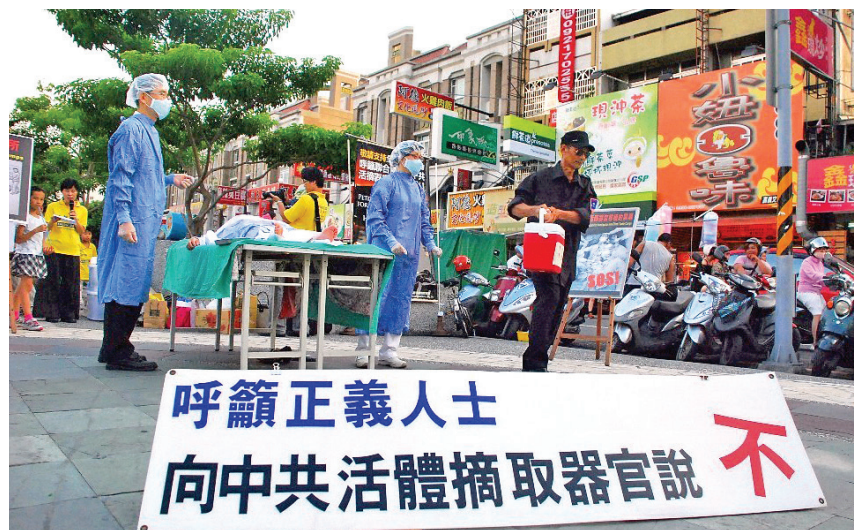
图：“任何有理智的人在读过他们的报告后，都不会不确信这样的事情（中共活体法轮功学员摘器官）正在发生”

回到我们现实当中。2005年底，被海外誉为「中国良心」的高智晟律师通过两周暗访，接触大量遭残酷迫害的法轮功学员，写下致胡、温的第三封公开信《必须立即停止灭绝我们民族良知和道德的野蛮行径》。信中描写的迫害真相惨绝人寰，但从网上反馈情况看，凡是读过这篇文章的，没有人对信中所述迫害真实性提出质疑，尽管其惨烈程度远远超出正常人想像。为什么？现实中法轮功学员所遭受的完全无法无天的抓捕、洗脑、劳教、判刑，以及耳闻目睹的绑架、失踪、迫害致残、致死校例，能够和高律师揭露的迫害事实互相印证，尽管超出自己的想像和心理承受能力，但不会怀疑信中内容的真实性。