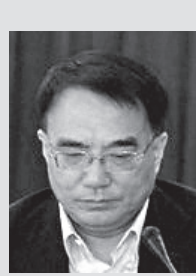
王珉:曾任吉林、辽宁两省书记,今年3月4日落马。

2013年辽宁法轮功学员被绑架人数达632人,居全国之首;2014年640人;2015年高达1176人。