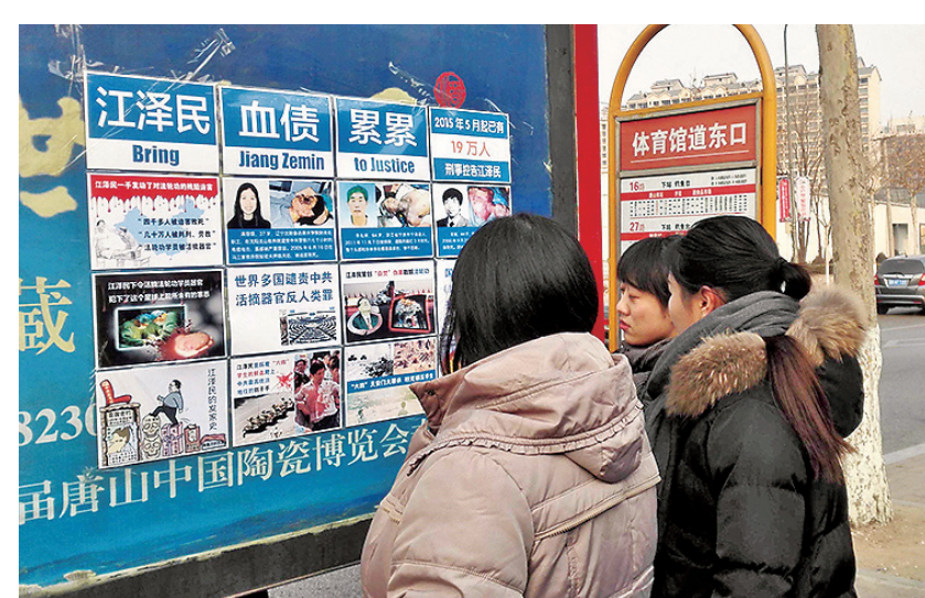
图：今年一月河北唐山街头，民众观看起诉迫害元凶江泽民展板。

没有资格给任何一个信仰定性，但是即使根据中共自己制定的法律，迫害法轮功也是非法的。