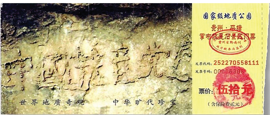
图: 贵州省将平塘县藏字石景观建成国家级地质公园, 图为公园门票, 其中大石头上天然形成“中国共产党亡”六个大字历历可观。

自2004年11月《九评共产党》在民间热传, 人们认清了中共谎言加暴力的邪恶本质, 由此引发了退出中共党、团、队 (三退) 大潮。现在有两亿多的中国同胞公开声明三退。他们为什么要退出中共的组织呢?