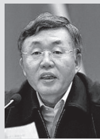
苏宏章:辽宁省政法委书记,今年4月6日被调查。