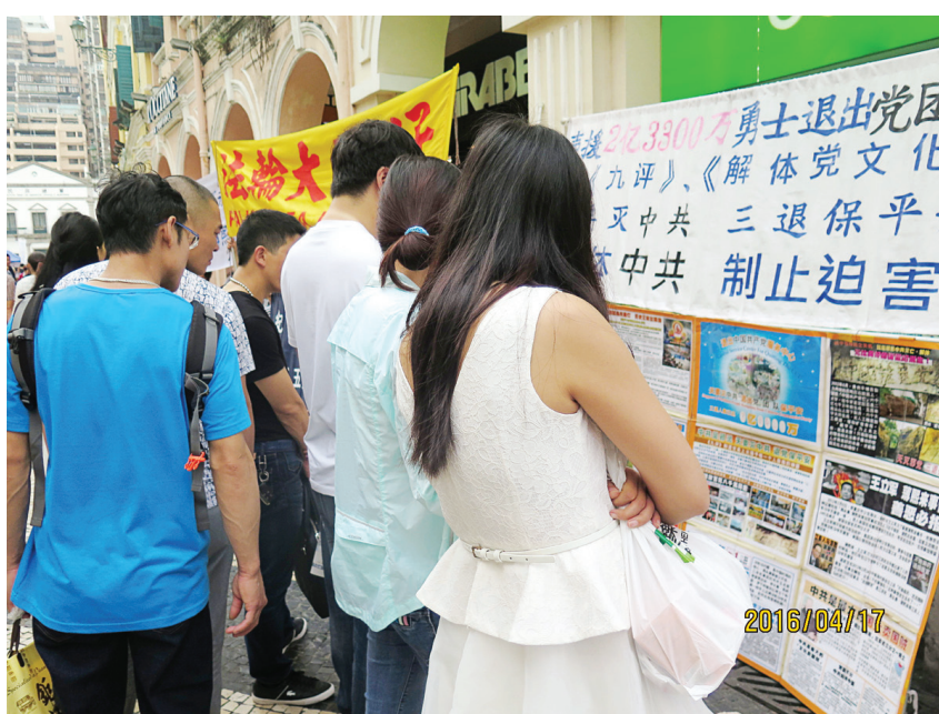
图：游客认真阅读真相展板。

就有好的未来；你走到哪里，老天爷都会保佑你，希望你和家人都退出来，选择光明。”那位女士很认同学员的话，一