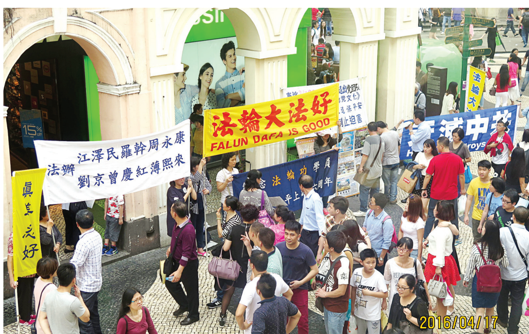
图：澳门法轮功学员举行“纪念四·二五和平上访17周年”活动。

当天，也有其他团体在相同地点举行活动，其中一位女士表示要加入法轮功的活动。法轮功学员问她：“你加入过中共党、团、少先队吗？你知道三退保平安吗？”对方表示不是很清楚，学员进一步向她介绍：“中共前头目江泽民因为妒忌法轮功创始人，发起迫害，中共更做出天理不容的活摘法轮功学员器官的恶事。大浪淘沙，淘剩的你就是一粒金子，老天爷就是看你良知的一面。选择良知，不和邪党走在一起，