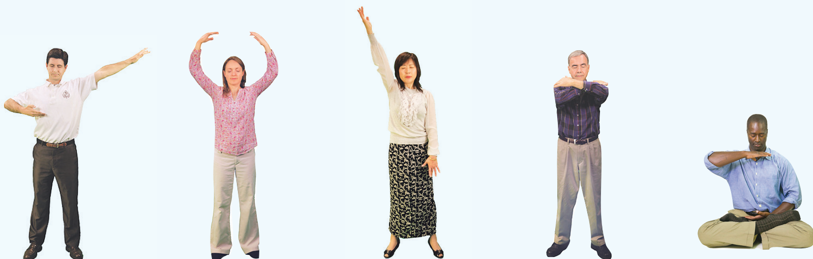
(一) 佛展千手法 (二) 法轮桩法 (三) 贯通两极法 (四) 法轮周天法 (五) 神通加持法

■ 全套法轮大法书籍、教功录像DVD和炼功音乐,均可在法轮大法网站免费阅读或者下载:www.FalunDafa.org