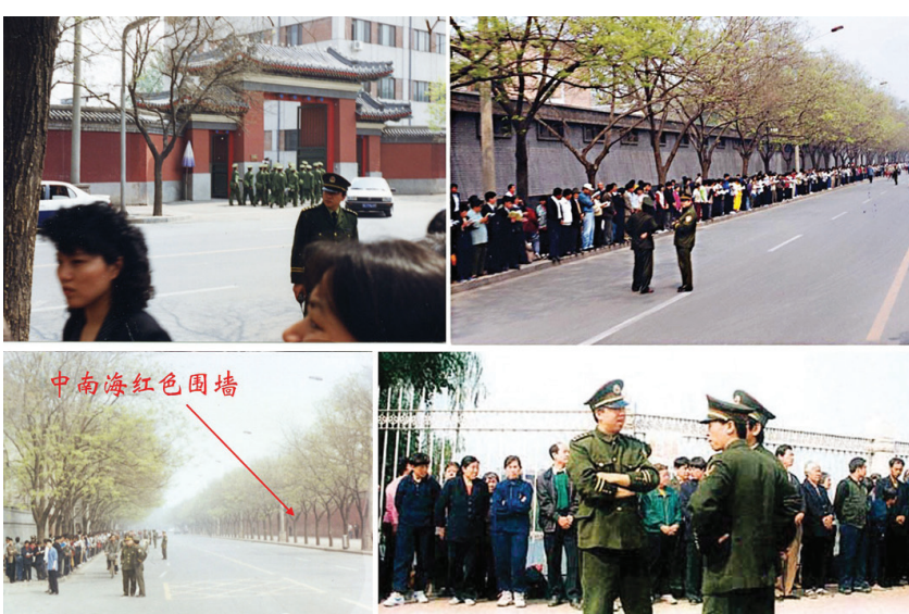
图:四.二五上访现场照片显示,上访群众是在中南海(红墙)对面的国务院信访办外面静静等待,没有「围」中南海,更没有「冲击」。否则,现场警察也不会如此悠闲地聊天。

按照当时新华社报导的数据,法轮功修炼者在全国有七、八千万,相比之下,参与上访的人数还是非常少的。