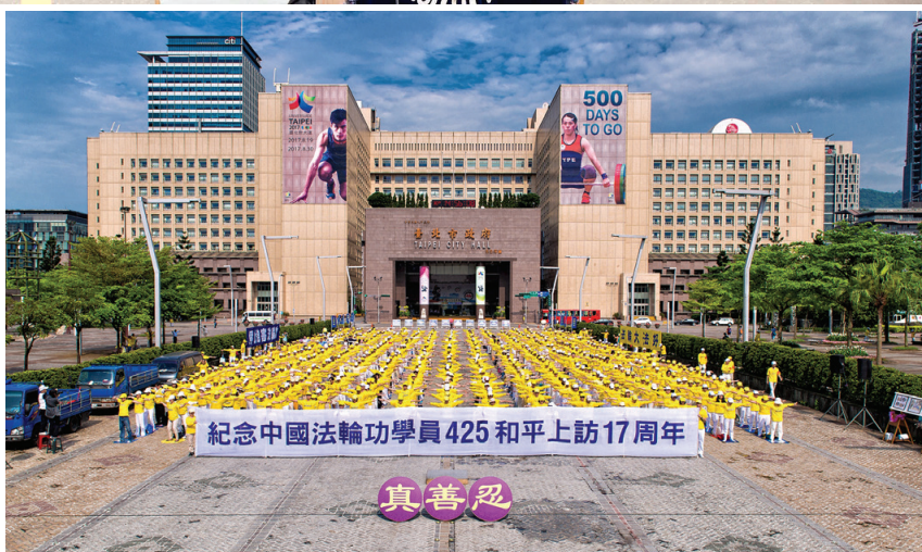
图:4月24日下午,台湾部分法轮功学员上千人在台北市市民广场集体炼功,纪念“四二五”和平上访十七周年。