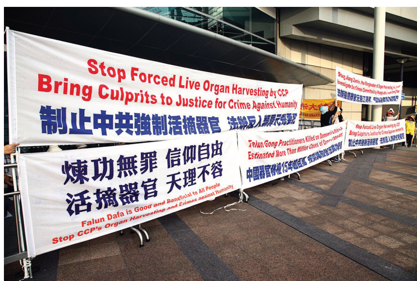
图:法轮功学员在会场外多处设立真相点,将中共活摘器官的真相告诉与会的专家及医生。

表示,英文资料很受西方人接受,不少与会的西人医生对法轮功学员表示,“I know all about that”、“I'm your