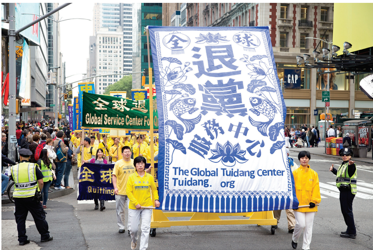
图：二零一六年五月十三日，美国纽约曼哈顿举行万人大游行，声援二亿多中国民众退出中共党、团、队组织。

姐：“我们是法轮功学员，按照‘真善忍’修炼，处处做好人。印这些真相资料需要钱，但是我们没拿别人的钱，用的是自己的钱。现在大陆世风日下，唯利是图，很多人已经理解不了法轮功学员这种无私付出的境界了，认为绝对不会白干，所以还在轻信中共诋毁法轮功的谎言。”