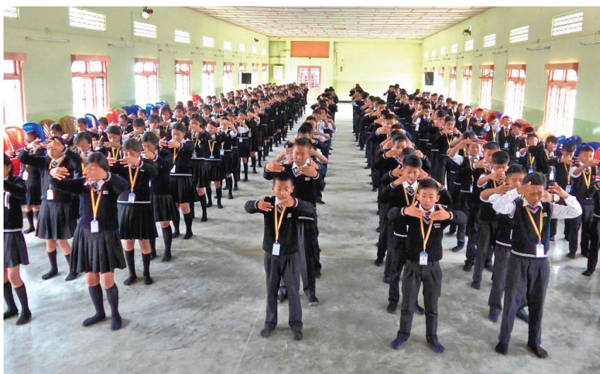
图：印度学生学炼法轮功功法。

传功的学员到达该邦首府第二天举行了记者招待会，五个当地媒体的记者和一个电视台参加了记者会。三家报纸