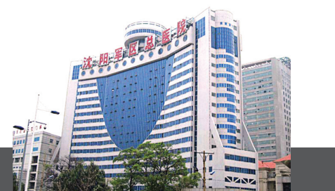
上图：沈阳军区总医院又称作陆军总院。

沈阳军区总医院心外科的技术在全军首屈一指，完全具备心脏移植的条件。总医院外部不招眼，而内部设施完善、机关重重，低级别的工作人员和军医都不真正了解整个医院的布局。证人提供的证词及大陆媒体的报道显示，沈阳军区总医院涉嫌强摘法轮功学员的心脏用于心脏移植手术。