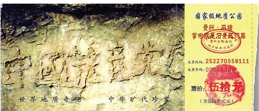
图：贵州省将平塘县藏字石景观建成国家级地质公园，图为公园门票，其中大石头上天然形成“中国共产党亡”六个大字历历可观。

自2004年11月《九评共产党》在民间热传，人们认清了中共谎言加暴力的邪恶本质，由此引发了退出中共党、团、队（三退）大潮。现在有两亿多的中国同胞公开声明三退。他们为什么要退出中共的组织呢？