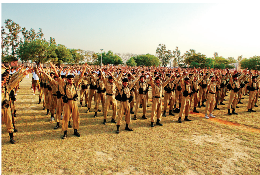
左图：印度德里警察训练大学上千学生现场学炼法轮功。右图：墨西哥警察在学炼法轮功功法。