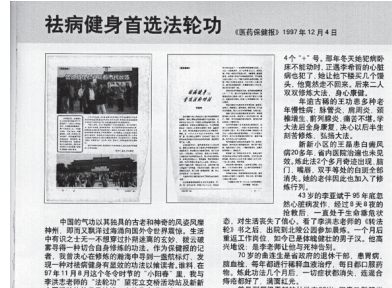
图：大陆《医药保健报》1997年12月4日的报道，标题是《祛病健身首选法轮功》。

老年人谁不想有一个健康的心脏和身体呢？可是在常人看来，岁月的流逝与身体器官的衰竭是一致的。那么中国传统文化中所讲的返老还童现象是不是真的存在呢？究竟有没有返本归真的修炼方法呢？上面的这些事例可以给您提供一个参考。笔者不但真心希望老年人去真正的了解一下法轮功，更希望有孝心的儿女为自己的老人找到一个真正的祛病健身的好功法。