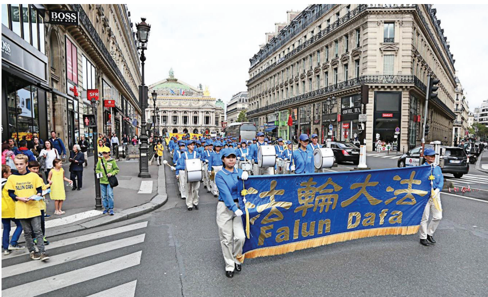
图:二零一六年十月一日,欧洲部份法轮功学员在法国巴黎市中心举办游行活动,呼吁共同制止迫害。