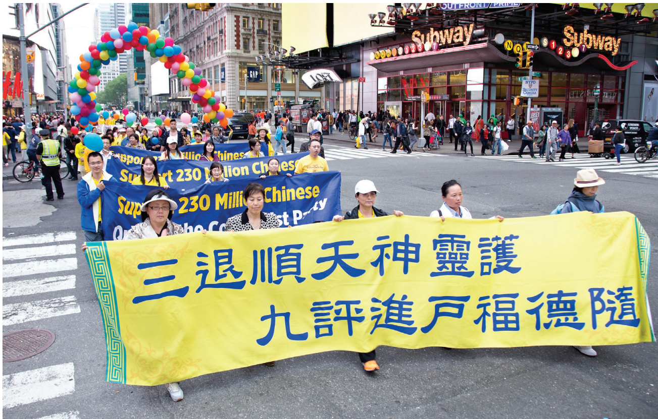
图:2016年5月13日，美国纽约曼哈顿万人游行，声援二亿多中国民众三退（退出中共党、团、队），图为游行队伍中的“三退顺天神灵护 九评进户福德随”横幅。

看看病房里外除了我和丈夫之外没有其他人，我以为父亲是在说胡话，可他不停的喊，让我快点说。我就问他，来的人都是些穿什么样衣服的呢？