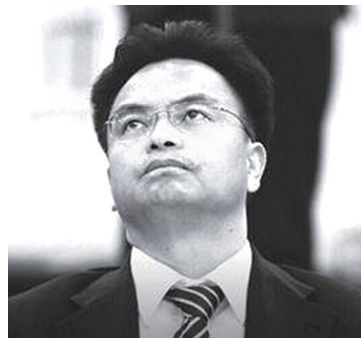
图：原广州市委书记万庆良积极迫害法轮功遭恶报，最近被判无期徒刑。

万庆良于2014年6月27日落马被调查，2015年12月25日开庭审理。南宁市中级法院2016年9月30日以受贿罪判处万庆良无期徒刑，剥夺政治权利终身，并没收个人全部财