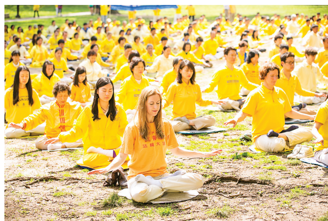
图：纽约部分法轮功学员在中央公园一起炼功。

法轮功带给他们的不仅是身体的健康，通过遵循“真、善、忍”的法理修炼心性，他们的内心也更加宁静、祥和、开阔、豁达。