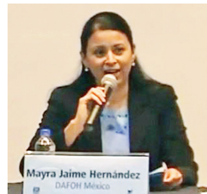
图:医生反对活摘器官国际组织驻墨西哥的代表在发言。

澳洲摄影师达夫拥有一个有六百万追随者的Youtube频道，他的社交媒体拥有五十万中国粉丝。他头一天在法轮功学员的征签活动中了解到集会的信息，当天特地带了一个三人摄影团队来到集会现场，对两位曾在中国遭受残酷迫害、并被多次抽血、验眼的法轮功学员做了视频采访，并表示会发布在他们的Youtube和社交媒体上，让人们看到第一手的采访。