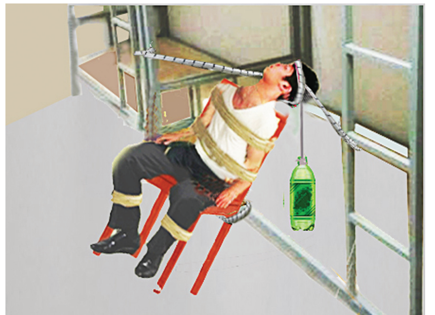
图:中共监狱酷刑示意图:“吊瓶”。

冀东监狱一直积极参与迫害。有许多法轮功学员被迫害后出现严重病态，有的致残，有的被迫害致死。