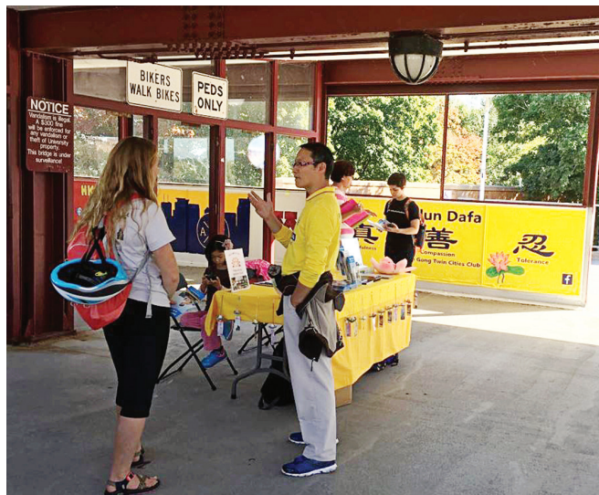
图:美国明尼苏达州民众了解法轮功真相后，纷纷在反活摘征签表上签名。图为民众和法轮功学员交谈了解真相。

中国大陆的女士在法轮功学员的展位前驻足，详细提出了很多问题并仔细聆听了学员们的解答。二十多分钟以后，心满意足地离开了。四、五位中国留学生在旁安静地听法轮功学员讲真相，纷纷点头。