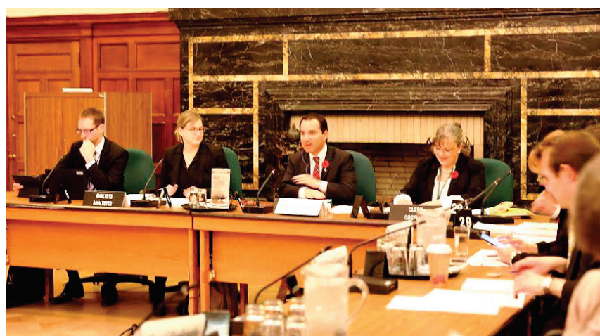
图:二零一六年十一月三日加拿大国会国际人权小组委员会举行“中共活摘法轮功学员器官”听证会。

“我们提供大量证据表明,中国存在产业的规模、国家导向的器官移植网路,通过国家政策 and 资金控制,并涉及军队、