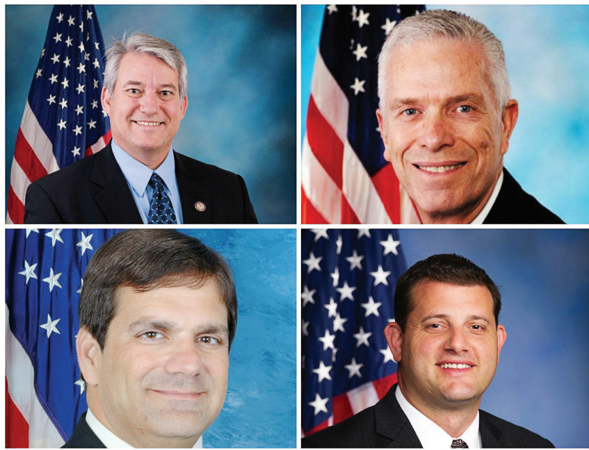
图：四位美国国会议员联名致信习近平，呼吁释放被非法迫害的法轮功学员。图上排从左至右：丹尼斯·罗斯（Dennis Ross），比尔·约翰逊（Bill Johnson）；下排从左至右：古斯·比拉拉克斯（Gus Bilirakis）和大卫·瓦拉多（David Valadao）。