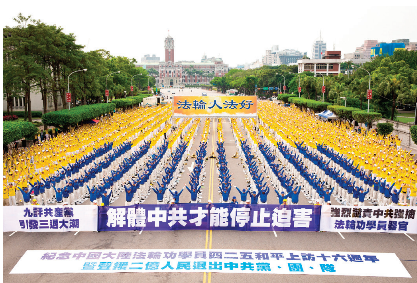
图：台湾法轮大法学会举办「纪念中国大陆法轮功学员四二五和平上访十六周年暨声援二亿人民退出中共党、团、队」活动。图为法轮大法学员演练功法。