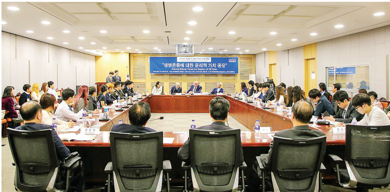
图：二零一六年十月十三日，加拿大人权律师大卫·麦塔斯和美国独立调查记者伊森·葛特曼应邀到韩国国会，与韩国议员、医学、法学系的大学生、电视和媒体人士一起研讨中共活摘器官议题。

伊森·葛特曼说海外许多国家早就禁止国民赴中国做器官移植手术。以色列早在二零零八年就制定了相关法律，西班牙、台湾、意大利等国家和地区也相继严令禁止，日本对这些也十分重视。