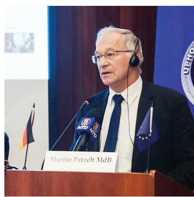
图：德国的欧盟议员盖立克指出，江泽民是迫害法轮功的罪魁祸首。

起来也还是远远不够的，而是应该全社会都来关注。不只是在德国，在欧洲要进行讨论，在所有尊重人权的国家都要进行讨论。