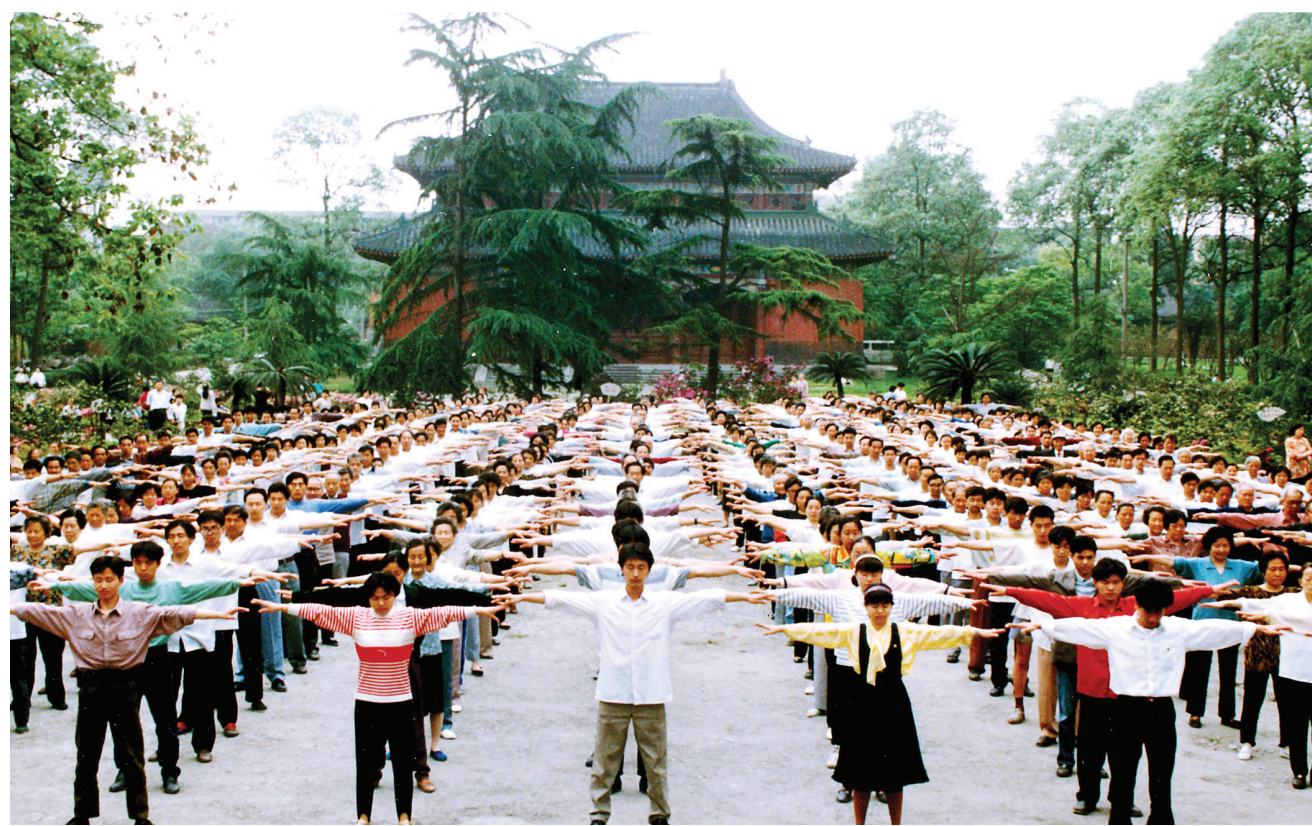
图:迫害之前,四川成都法轮功学员集体炼功场面。

回家后我真正开始相信法轮大法,从修心性开始,按照“真、善、忍”的标准要求自己。两个月后,我的身体出现奇迹,慢慢地能炼动功了,腹水消下去很多。我的状况一天比一天好,逐渐地能行动自如,自己做饭了,我决心天天炼法轮功的五套功法,不再停下来。