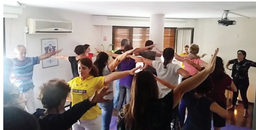
图:法轮功学员在土耳其第三大城市教授功法。

(土耳其来稿)土耳其法轮功学员10月8日在第三大城市伊兹密尔(Izmir)教授法轮功功法,吸引了许多当地民众参加。