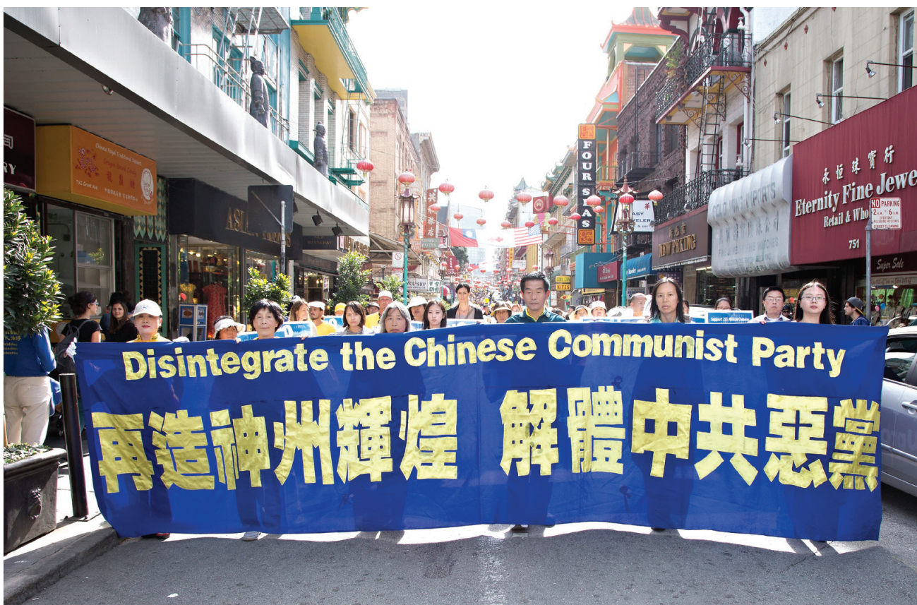
图：2016年10月22日，美国旧金山举行声援二亿多中国民众退出中共党、团、队组织大游行，图为游行队伍中的标语“再造神州辉煌 解体中共恶党”。

有游客说：“我接了你们的资料也带不回去啊？”义工告诉他，先拿着在路上仔细看，要是不愿意带回去，可以看完后送给遇到的其他华人，或者放在有华人光顾的旅馆、饭馆、车站里，留给有缘人接着看。游客说：“这主意不错，这些材料看完一遍就扔了，太可惜了，应该让更多的人看看。”有人插话：“我出来好几次了，材料都带回去了，国内人特爱看，都是听不到、看不到的重要消息。”