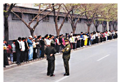
图:1999年逾万名法轮功学员和平上访。照片显示,上访群众静静地等在路边等待,没有“围”中南海,更没有“冲击”。

这些年我在告诉村里人记住“法轮大法好,真善忍好,三退保平安”时,也有不接受的,还说:有什么用,能把共产党搞垮吗?我说:共产党垮不垮,就像天要下雨、下雪,那是天意,谁能阻止?是神在看着。你还记不记得我家鞭炮坊爆炸的那件事。他们听了,就不再说什么了。