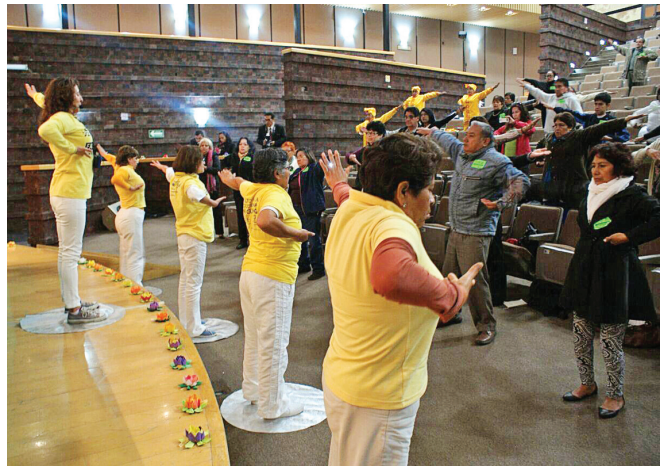
图:与会者跟随法轮功学员学炼法轮功第一套功法。

法轮功学员在国会举办的论坛包括“中国与墨西哥——人性的本质”,讲述了在中国和墨西哥文化中对宇宙和人类