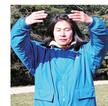
图: 在澳大利亚联邦政府部门任分析师的璇炼法轮功法。谣言而产生的偏见, 开始接触法轮功。刚开始炼功, 璇就感受到非常强大的能量场, 身体奇迹般地恢复, 颈椎的伤痛也基本好了。