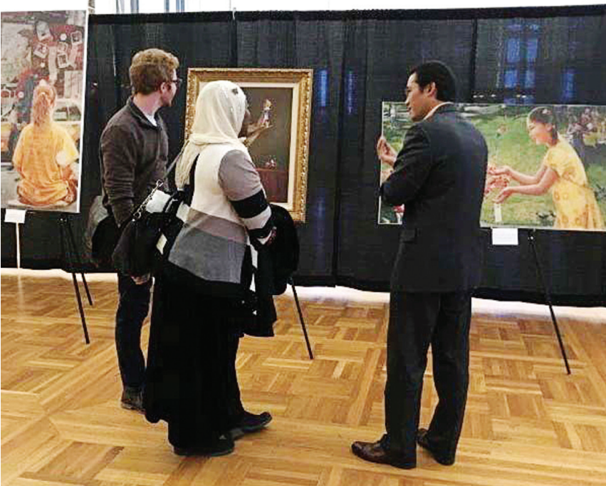
图:画展参观者与法轮功学员交谈。