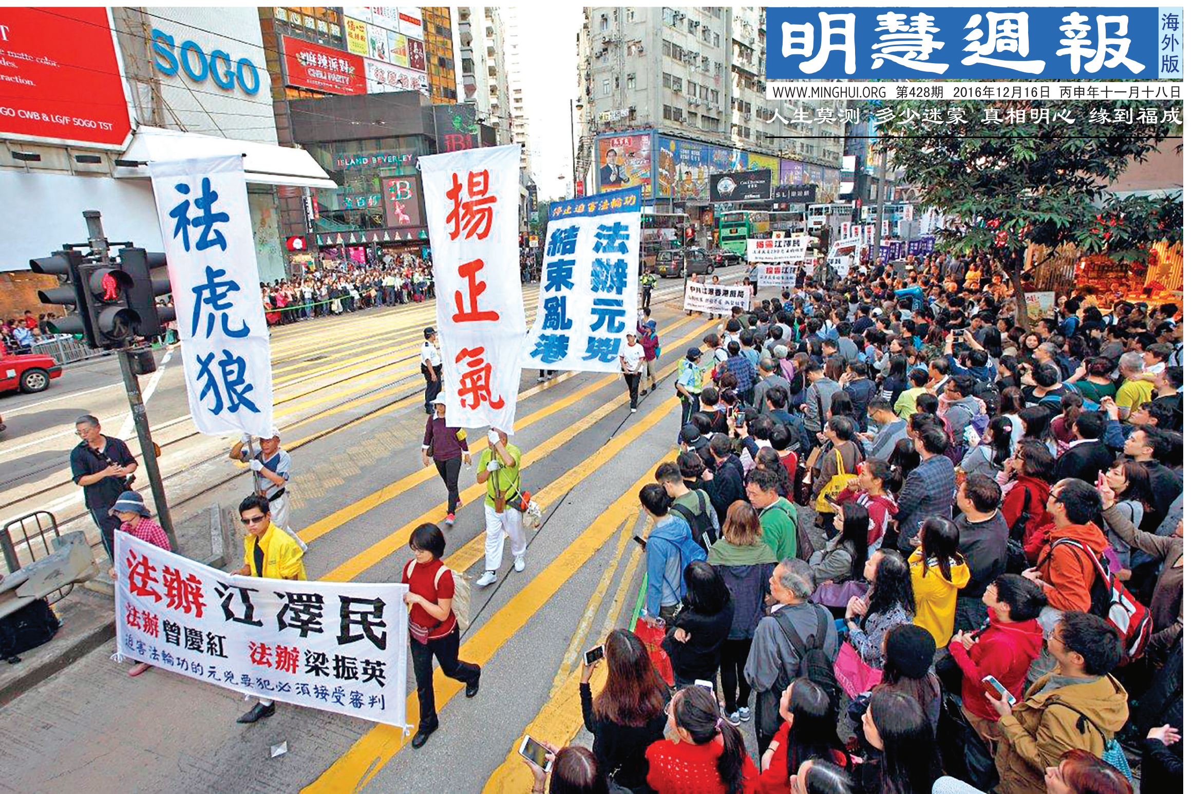
图:十二月十日国际人权日,香港部分法轮功学员举行反迫害及声援二亿五千万中国民众三退(退出中共党、团、队)的集会和游行。