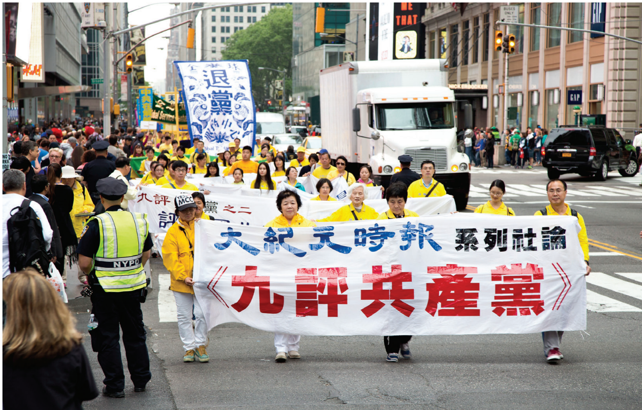
图: 由《九评共产党》引发的三退大潮汹涌澎湃，越来越多的中国人选择远离中共。二零一六年五月十三日，美国纽约曼哈顿举行万人大游行，声援全球二亿四千万中国人三退（退出中共党、团、队组织）。

我告诉他，“退党”不等于“反党”，世界上任何正常的政党都是进出自由的，唯独共产党，一进去就要你发毒誓，要为你奋斗终生，你想退出来就给你扣帽子、吓唬你，这正是共产党邪恶本性的体现。再说，共产党坏事做绝，害死了八千万中国同胞，老天都要灭它，你不退出来，将来就是它的殉葬品，你值得吗？