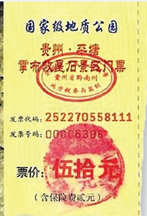
图: 贵州省将平塘县藏字石景观建成国家级地质公园，图为公园门票，其中大石头上天然形成“中国共产党亡”六个大字历历可观。

的一个原因，是出于良知和道义的选择：要做一个言而有信的华夏儿女，不愿做马列子孙，犯不上为西方（德、俄）国家都唾弃的某某主义欺骗良心，“牺牲一切”。