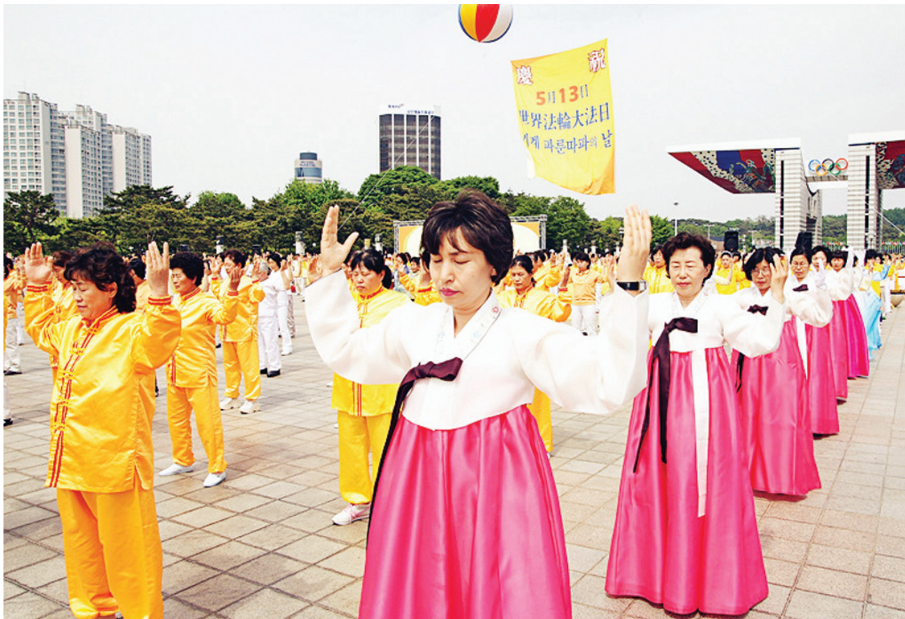
图:韩国法轮功学员集体炼功,庆祝5.13世界法轮大法日。

还不止这些，我的肾脏（副肾）长了肿瘤，幸亏不是恶性肿瘤，但是医生说不做手术病情会进一步恶化，没办法