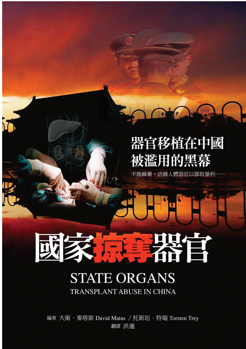
图:《国家掠夺器官》一书详述了中共活摘器官的真实性。