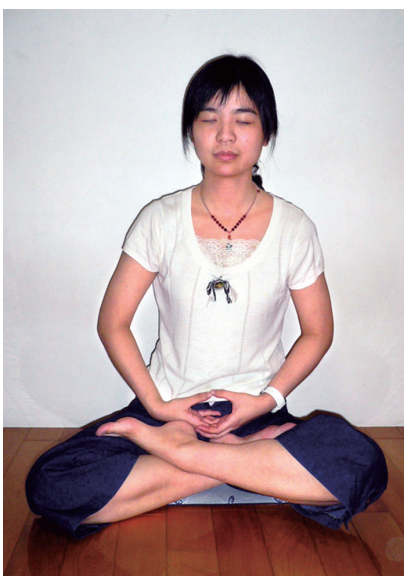
◀惠君炼法轮大法第五套功法——神通加持法。

到看完整本书, “顿时人一下子清明起来, 有种安定的感觉, 从那一刻起我就决定开始修炼法轮大法。”