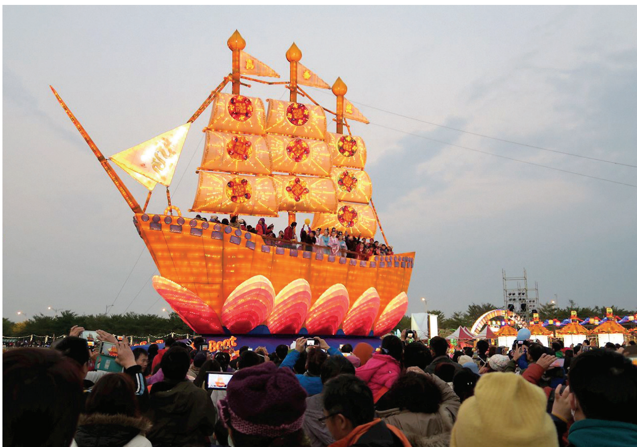
图:台湾新年期间最大的庆典活动“台湾灯会”，2017年2月11日到2月19日在云林盛大举办，法轮功学员制作的“法船花灯”再次吸引民众的目光。

元宵节开幕当天，法轮功学员组成的腰鼓队、合唱团、儿童舞蹈团轮番表演，现场热闹非凡。多位民意代表、地方仕绅到场参与点灯仪式，赞誉“法船花灯”带来正向能量，