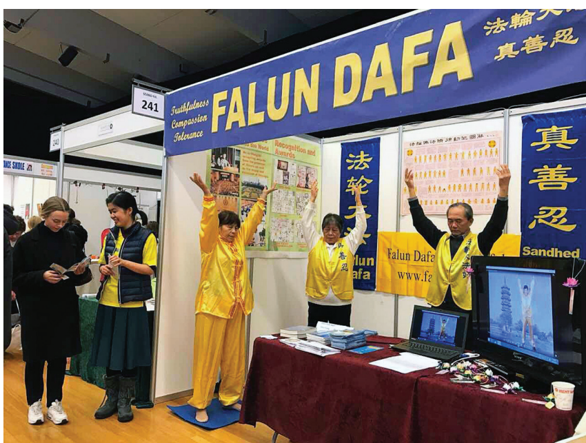
图：丹麦哥本哈根健康博览会上的法轮功展位。