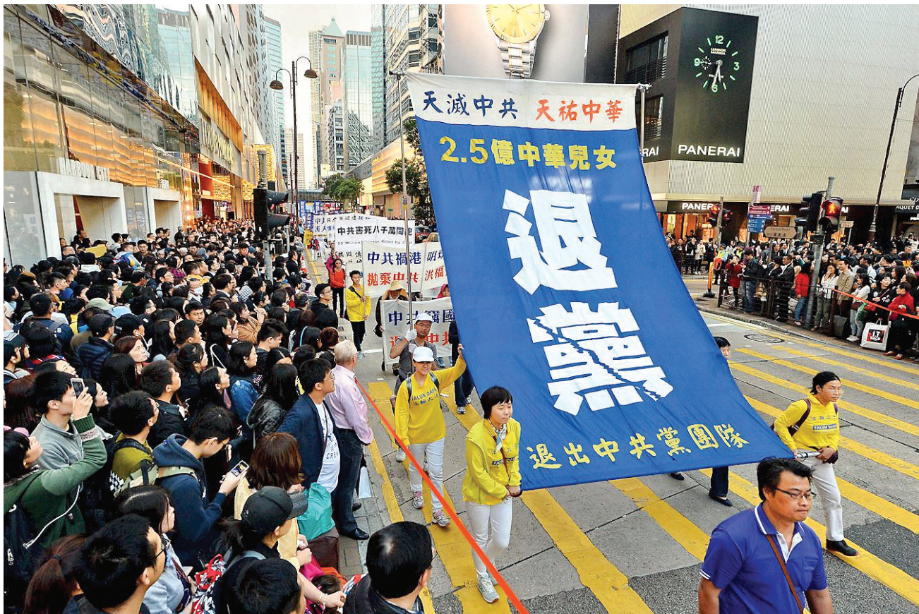
图:二零一五年四月二十六日，香港举行声援二亿中国民众三退（退出中共党、团、队组织）大游行，吸引众多市民和各地游客驻足观看。

我接着说：“您的这个观点不符合事实，建议您重新思考，得出正确结论。我们的退休金、医药费都不是党给的，那是自己奋斗了一生挣下的，也可以说是百姓给的，或者说是纳税人养着我们，但决不是党的恩赐。如果党不搞运动不破坏生产、不贪腐、不挥霍、不浪费、不搞破坏性建设、少援外等等，百姓会堂堂正正的给你更好的待遇。几十年来，党偷盗了纳税人无数财富进行非法活动，所以从来党就不敢公开这个账目，这本身就是违法犯罪的。这算是我的第一个观